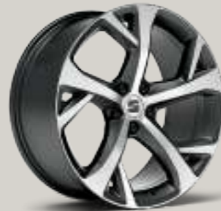
19"-LEICHTMETALLRAD EXCLUSIVE II GLANZGEDREHT FR