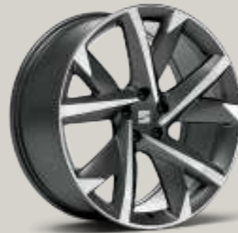
20"-LEICHTMETALLRAD SUPREME II GLANZGEDREHT FR

Style St XPERIENCE XP FR FR Serie ■ Optional ■