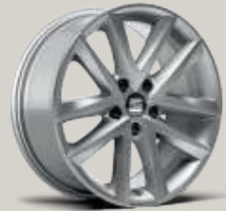
17"-LEICHTMETALLRAD DYNAMIC St