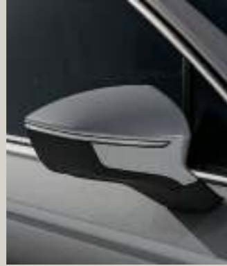
REFLEX SILBER METALLIC St XP