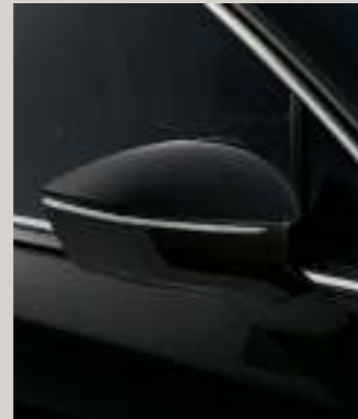
DEEP SCHWARZ METALLIC St XP FR