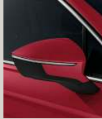
MERLOT ROT METALLIC St XP FR