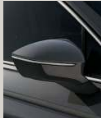
URANO GRAU St XP FR