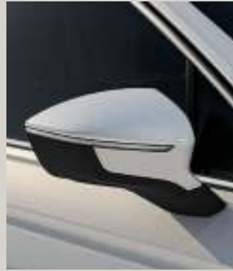
ORYX WEISS METALLIC St XP FR

Style St XPERIENCE XP FR FR Serie ■ Optional ■