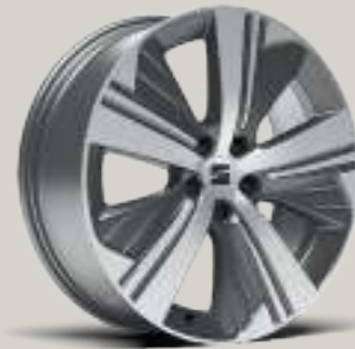
19"-LEICHTMETALLRAD EXCLUSIVE AERO GLANZGEDREHT XP