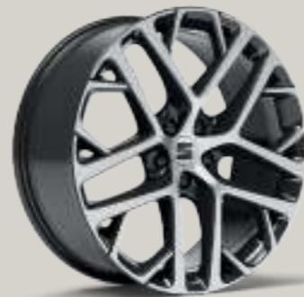
20"-LEICHTMETALLRAD SUPREME III GLANZGEDREHT XP