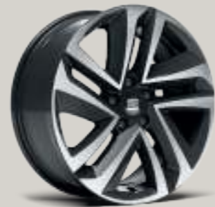
18"-LEICHTMETALLRAD PERFORMANCE GLANZGEDREHT St