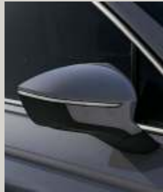
DELPHIN GRAU METALLIC St XP FR