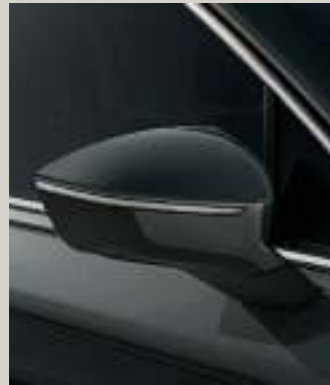
DARK CAMOUFLAGE METALLIC St XP FR