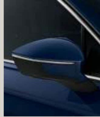
ATLANTIC BLAU METALLIC St XP