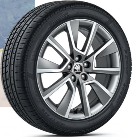
BRAGA Die serienmäßigen 17"-Leichtmetallfelgen Braga unterstreichen den dynamischen Look des FABIA COMBI SCOUTLINE.