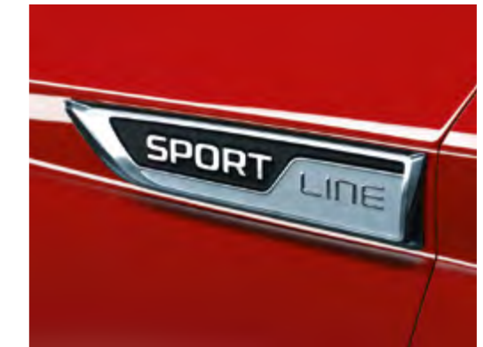
SPORTLINE-SCHRIFTZUG Ein SPORTLINE-Emblem ziert die vorderen Kotflügel.