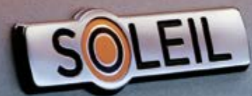
SOLEIL-SCHRIFTZUG Dekorativ: der SOLEIL-Schriftzug auf den vorderen Kotflügeln.