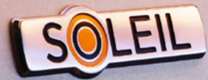
SOLEIL-SCHRIFTZUG Dekorativ: der SOLEIL-Schriftzug auf den vorderen Kotflügeln.