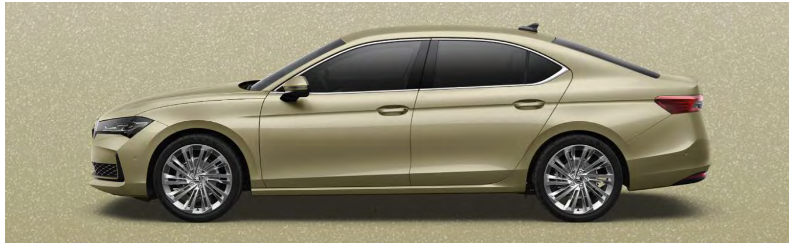
Ice Tea-Beige Metallic