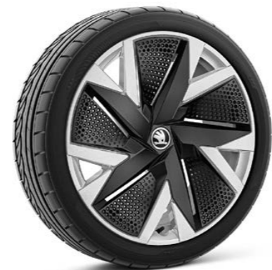
19"-Leichtmetallfelgen Aniara Silber mit Aeroblende in Schwarz