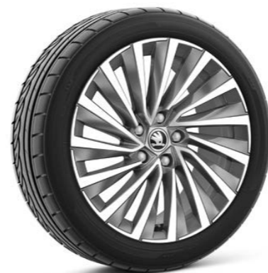
18"-Leichtmetallfelgen Belatrix glanzgedreht Anthrazit