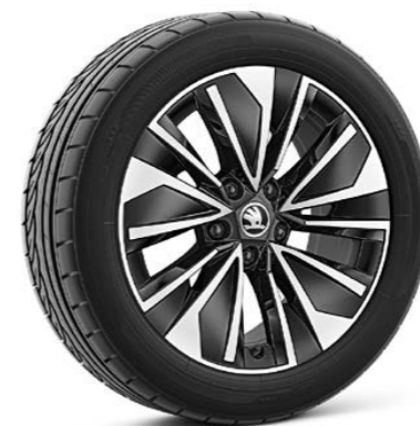
17"-Leichtmetallfelgen Alrakis Aero Schwarz/Silber