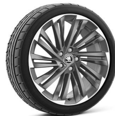
19"-Leichtmetallfelgen Veritate glanzgedreht Anthrazit