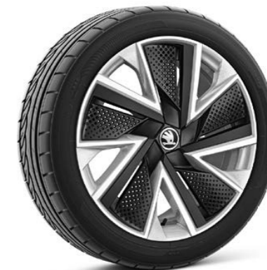
18"-Leichtmetallfelgen Bosona Aero Silber mit Aeroblende in Schwarz