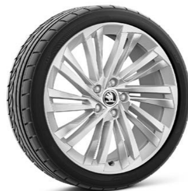
19"-Leichtmetallfelgen Veritate Silber