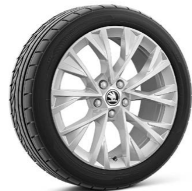
18"-Leichtmetallfelgen Dofida Silber