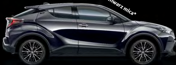
209 Mysticschwarz mica*