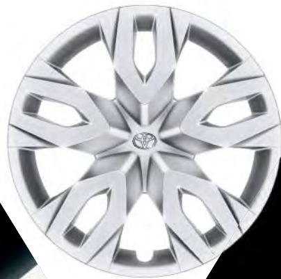
17"-Stahlfelgen für die Ausstattung „TOYOTA C-HR“