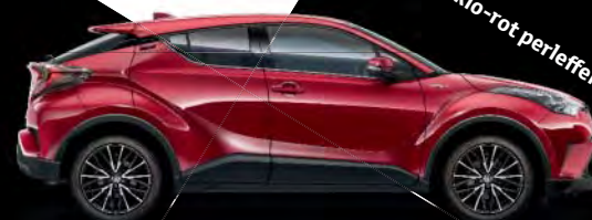
3T3 Tokio-rot perleffekt*