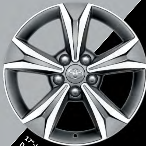
17"-Leichtmetallfelgen im 5-Speichen Design, anthrazit oberflächenpoliert (auch in silber, matt schwarz, schwarz oberflächenpoliert)