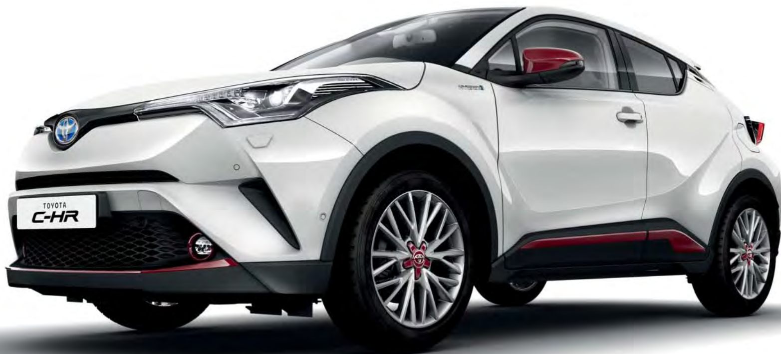
TOYOTA C-HR mit Original-Zubehör