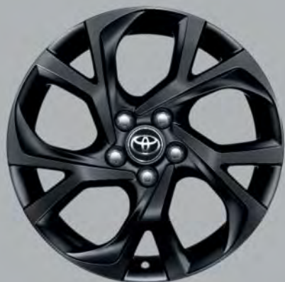
18"-Leichtmetallfelgen im Y-Design, matt schwarz