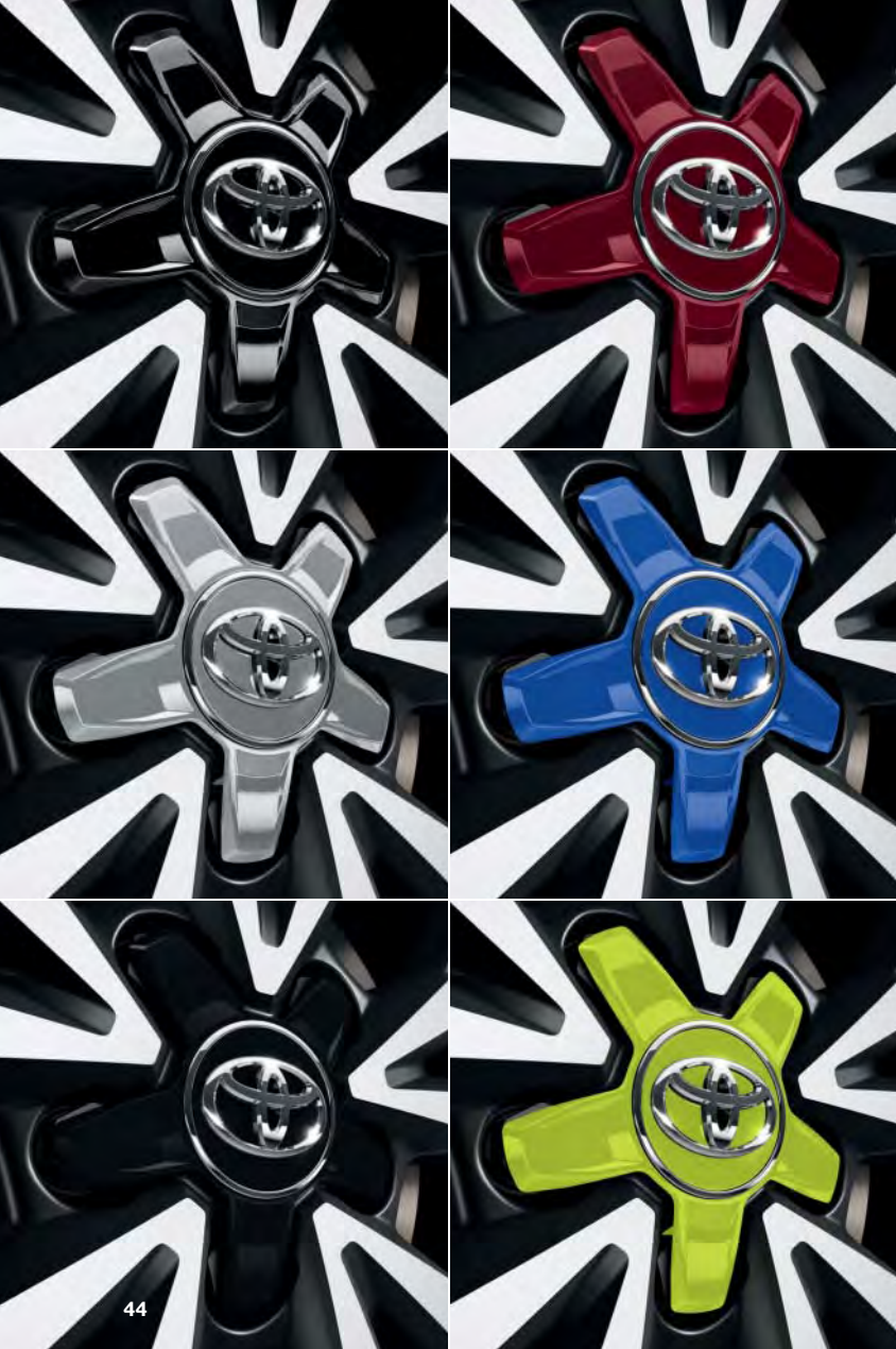
Nabenkappen in Kontrastfarben. Passend für 18"-Leichtmetallfelgen