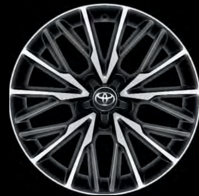
18"-Leichtmetallfelgen für die Ausstattung „LOUNGE“