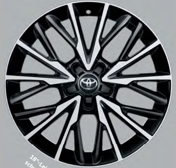
18"-Leichtmetallfelgen im V-Design, schwarz oberflächenpoliert