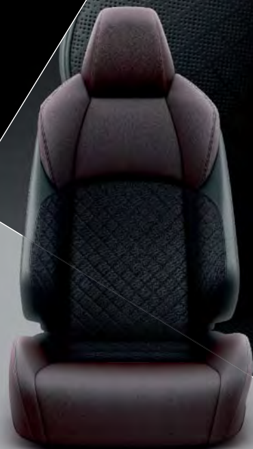
Teillederpolster, dunkelbraun mit schwarzem Rautenstoff für die Ausstattung „LOUNGE“