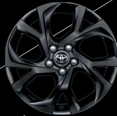
18"-Leichtmetallfelgen für die Ausstattung „STYLE SELECTION“