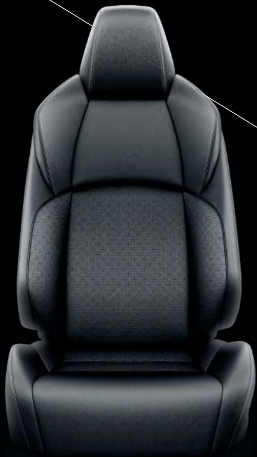
Lederpolster, schwarz optional für die Ausstattungen „STYLE SELECTION“, „LOUNGE“ und „TEAM DEUTSCHLAND“