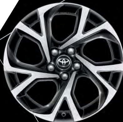
18"-Leichtmetallfelgen für die Ausstattung „TEAM DEUTSCHLAND“