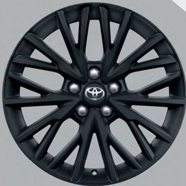
18"-Leichtmetallfelgen im Y-Design, matt schwarz