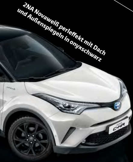
2NA Novaweiß perlfeffekt mit Dach und Außenspiegeln in onyxschwarz