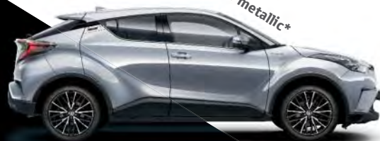
1F7 Platinsilber metallic*