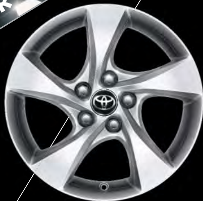
17"-Leichtmetallfelgen für die Ausstattung „FLOW“