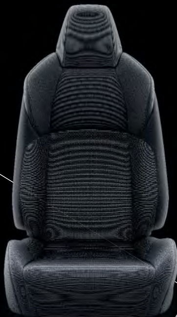
Stoffpolster, schwarz für die Ausstattungen „TOYOTA C-HR“, „FLOW“ „TEAM DEUTSCHLAND“ und „STYLE SELECTION“