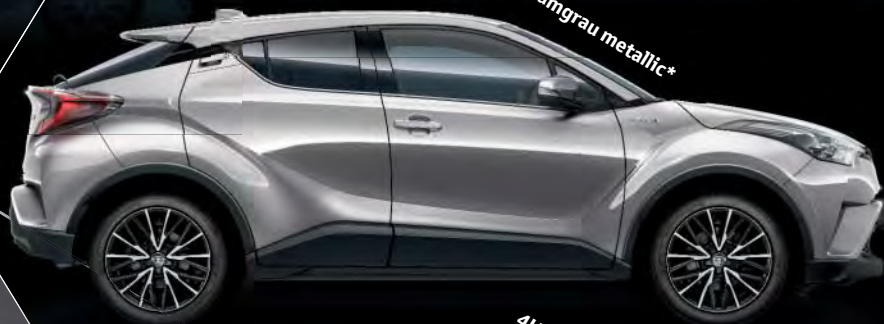
1K0 Metalstreamgrau metallic*