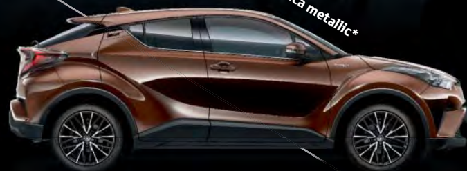
4U3 Havannabraun mica metallic*