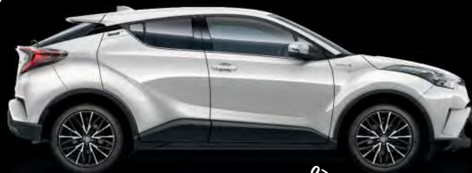
070 Novaweiß perleffekt*