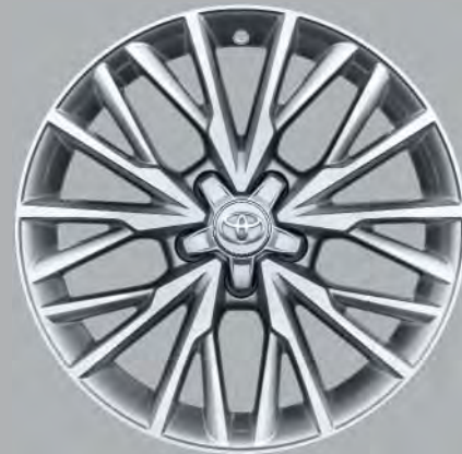
18"-Leichtmetallfelgen im V-Design, silber glänzend