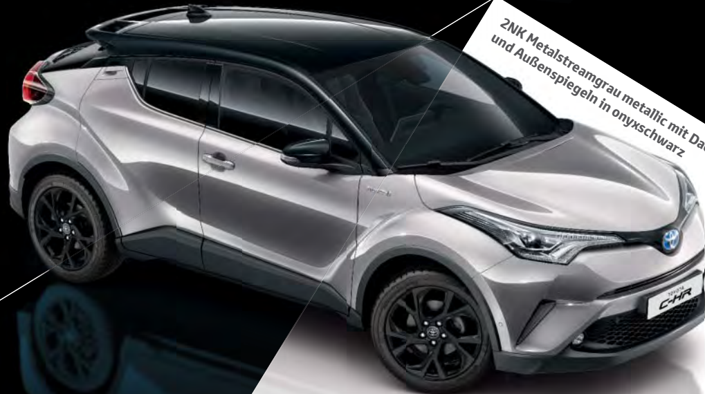
2NK Metalstreamgrau metallic mit Dach und Außenspiegeln in onyxschwarz