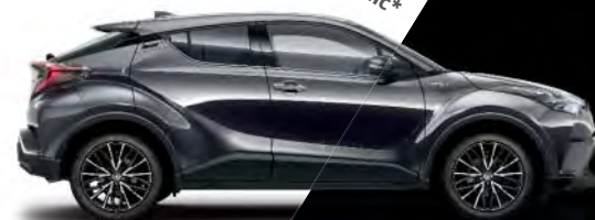
1G3 Marlingrau metallic*