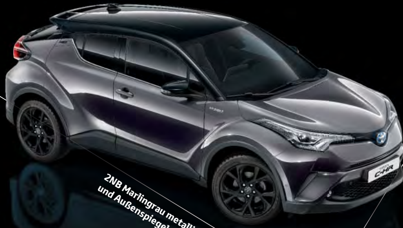
2NB Marlingrau metallic mit Dach und Außenspiegeln in onyxschwarz