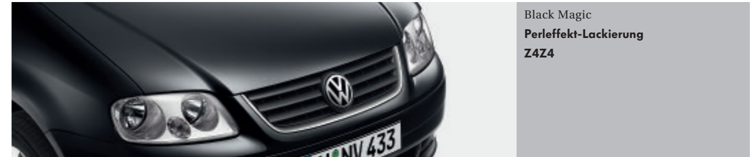
Black Magic Perleffekt-Lackierung Z4Z4