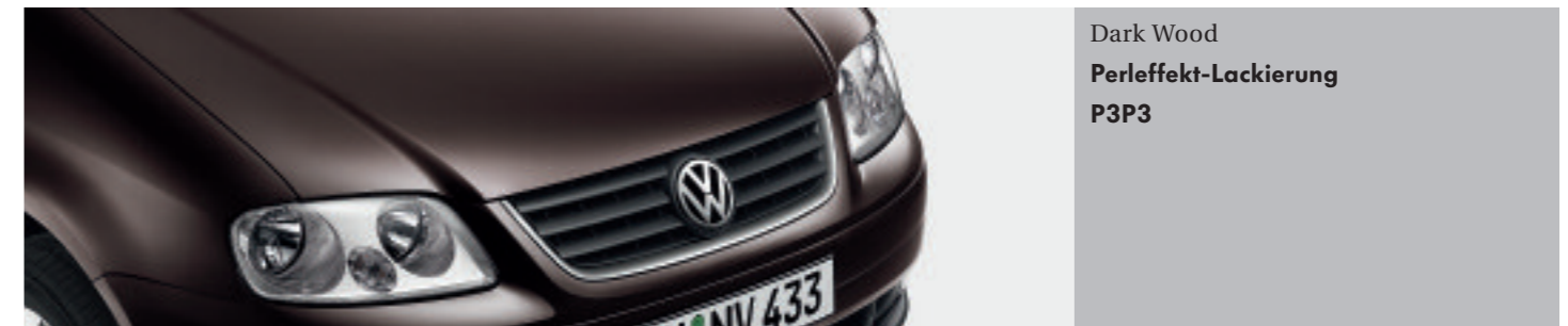
Dark Wood Perleffekt-Lackierung P3P3