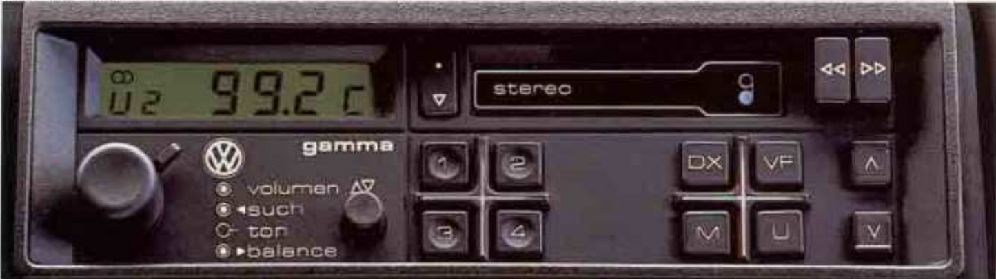
Das Audio-System „gamma“.