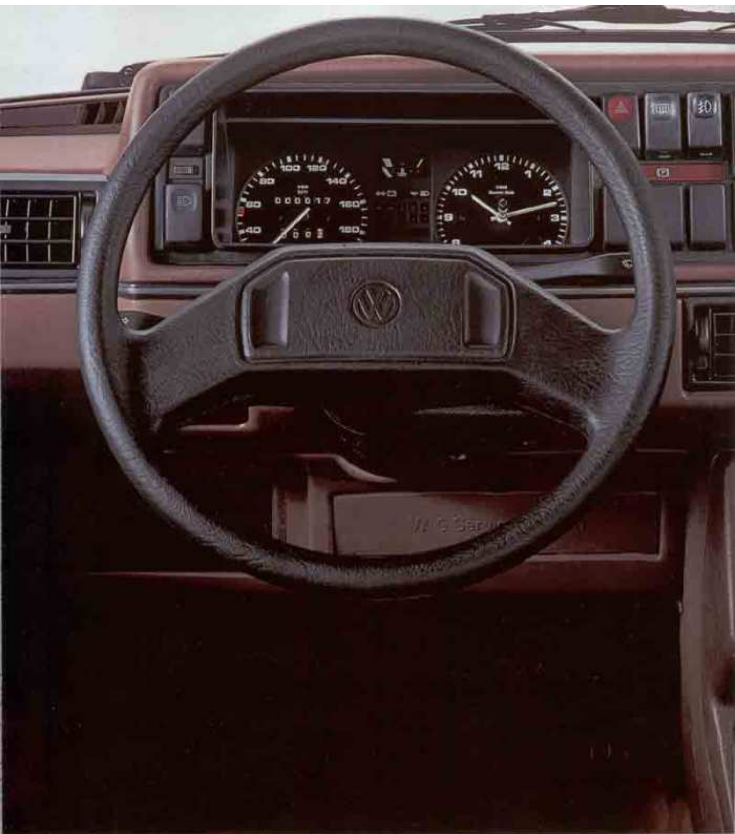
Die Armaturentafel des Golf GL Extra. Audio-System und Cassettenslot.