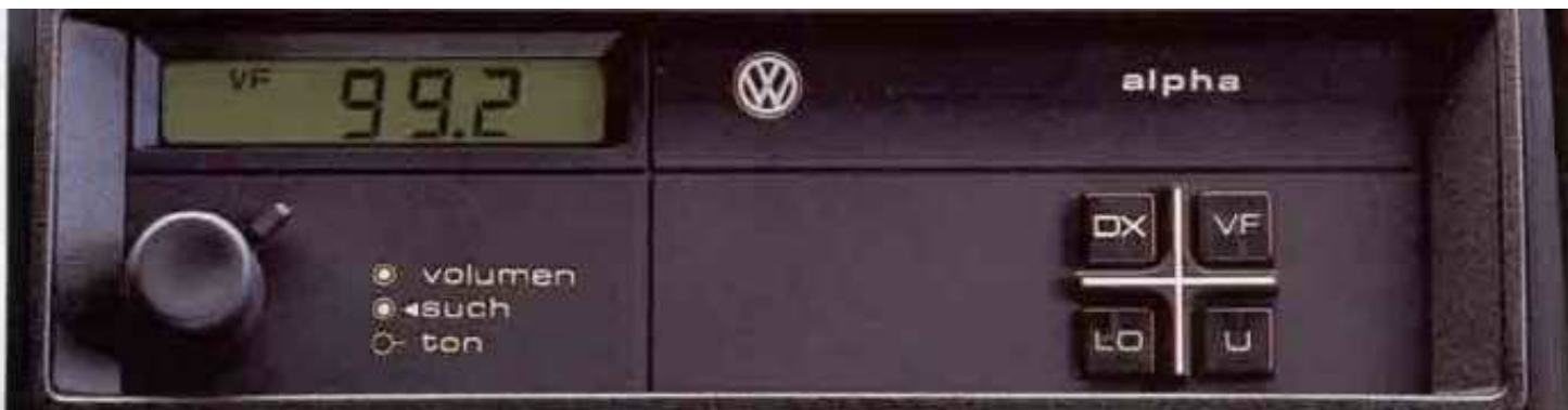
Das Audio-System „alpha“.