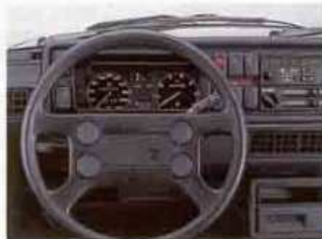
Die Armaturentafel. Extra: Audio-System.

und Stoßfänger mit roten Zierstreifen. Und hinten: das sportliche Auspuff-Doppelendrohr. Nehmen Sie Platz in den körpergerecht geformten Sportsitzen, und genießen Sie die Schubkraft des elastischen Motors. Durch seine Windschlüpfigkeit erreicht der GTI mit seinem 1,8 l/82 kW (112 PS)-