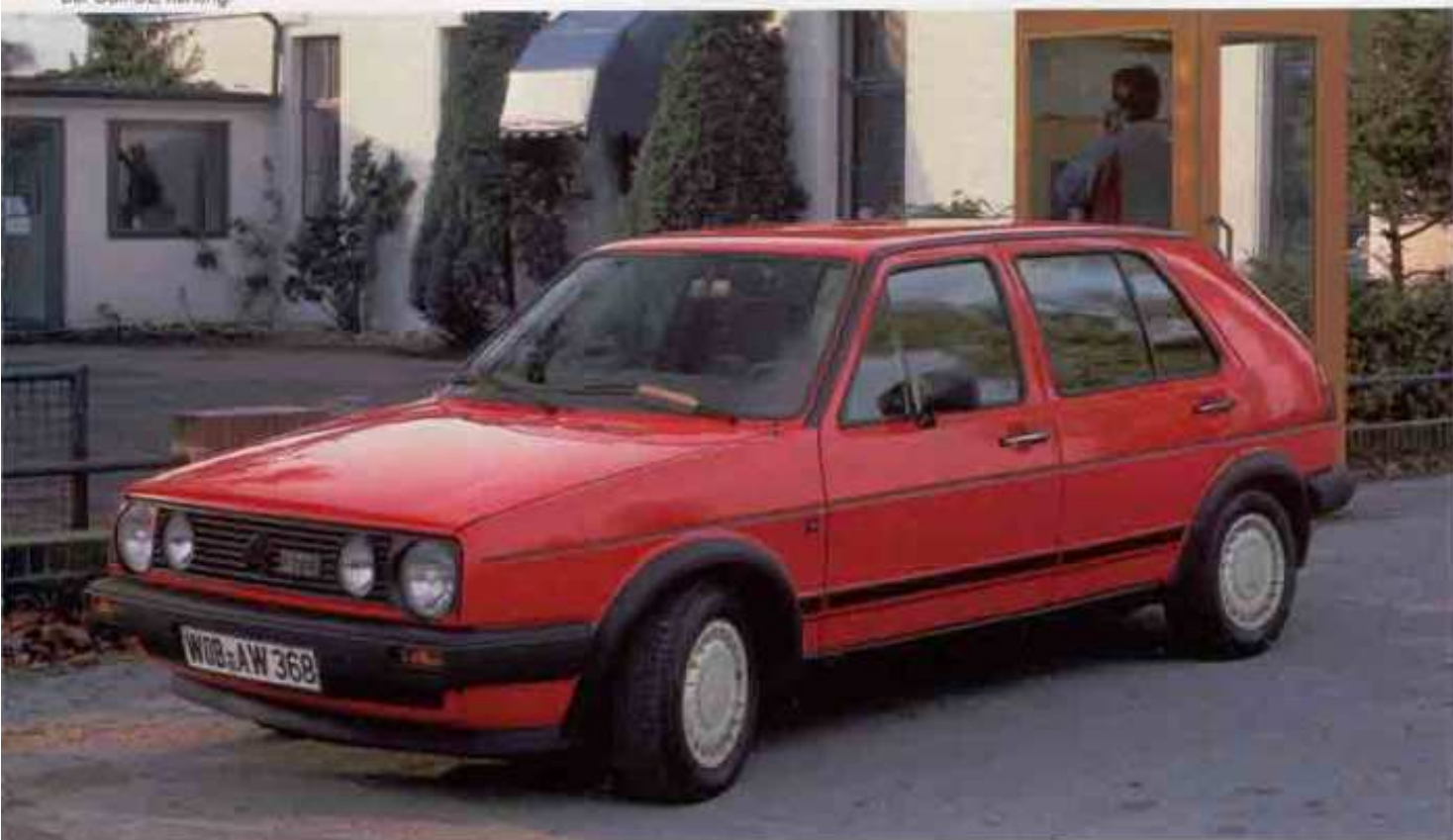
Der Golf GTD, vierfüßig. Extra: Beifahreräußenspiegel