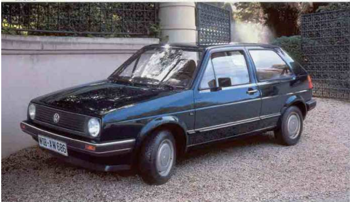
Der Golf CL