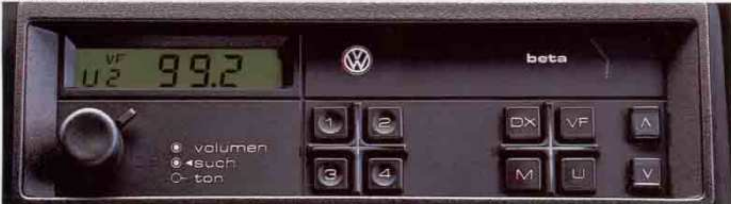
Das Audio-System „beta“.