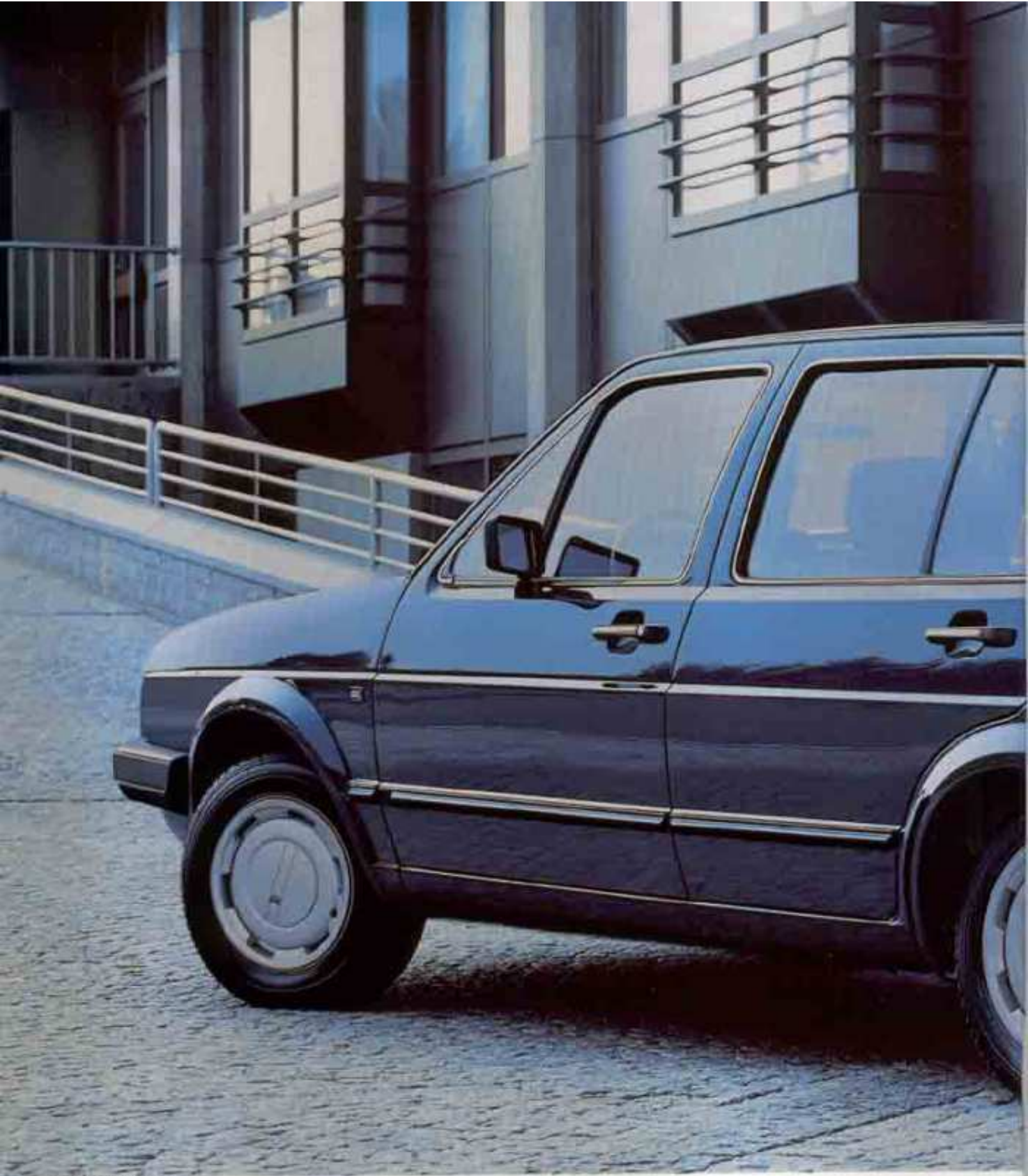
Der Golf GTI, viertürig.