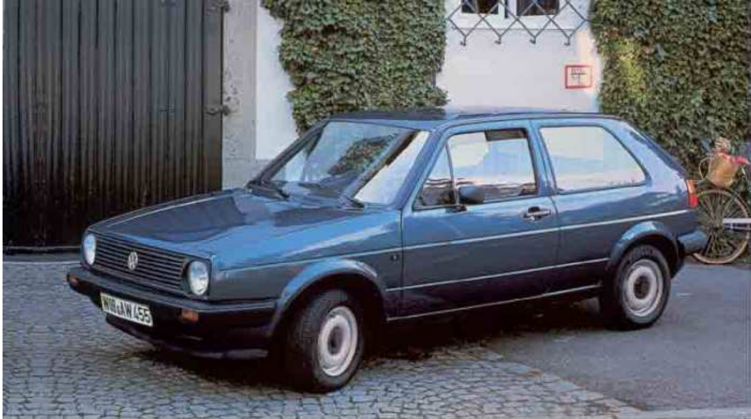
Der Golf C