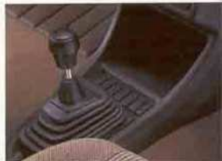
Die praktische Mittelkonsole.

ganz individuell einstellen. Und niemand braucht sich, ob groß oder klein, im Golf irgendwo beengt zu fühlen. Das liegt an einem Innenraum, der sich auf sage und schreibe 1,84 m in die Länge streckt (gemessen vom Gaspedal bis hin zur hinteren Rückenlehne). Riesig Platz damit auch für die