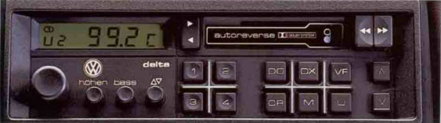
Das Audio-System „delta“.