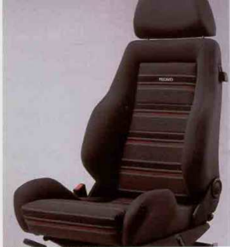
Der Recaro Sportsitz mit elektrischer Höhenstellung.