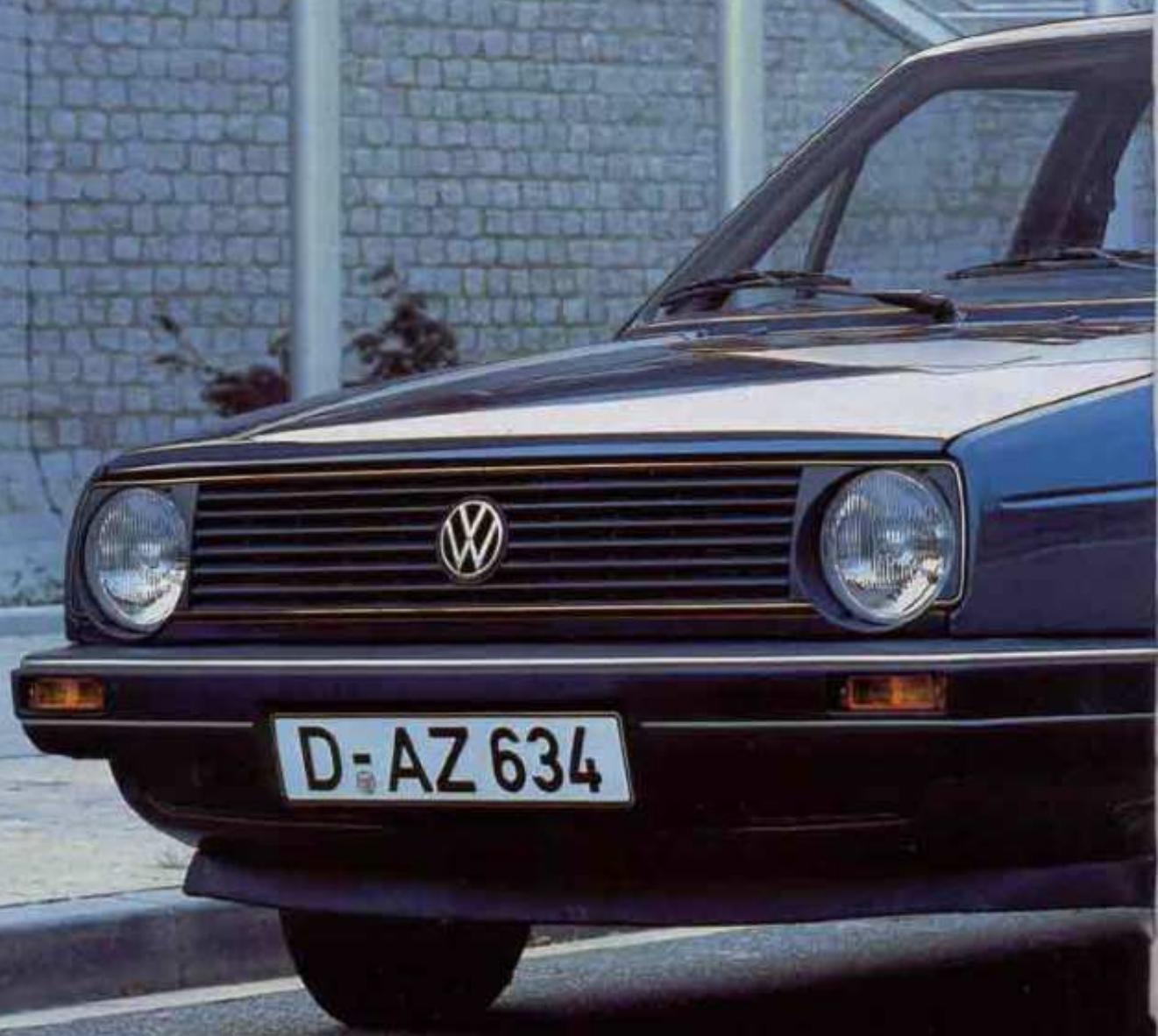
Der Golf GL, vierübrig.