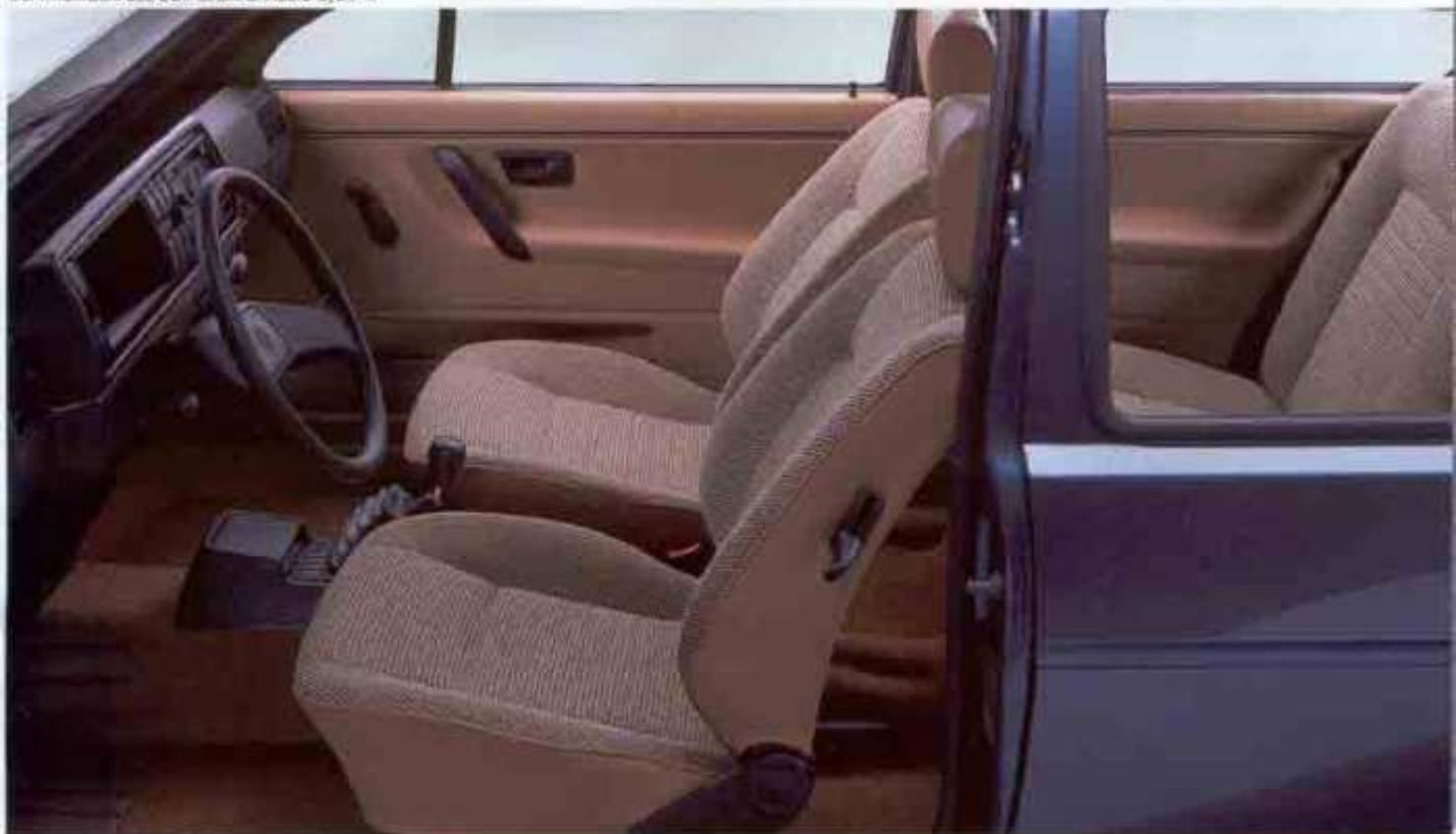
Der Innenraum des Golf CL. Extra: Audio-System.

Außen: Halogen-Scheinwerfer, Verbundglas-Windschutzscheibe, Nebelschlußleuchte, Heckscheiben-Wasch-Wisch-Anlage mit Intervallschaltung etc.