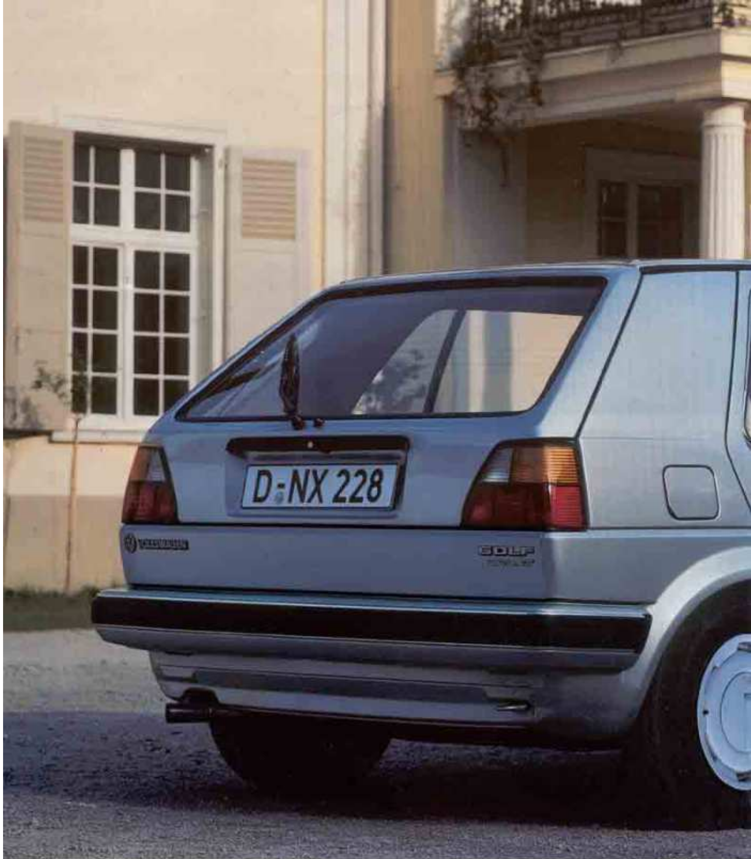
Der Golf Carat.