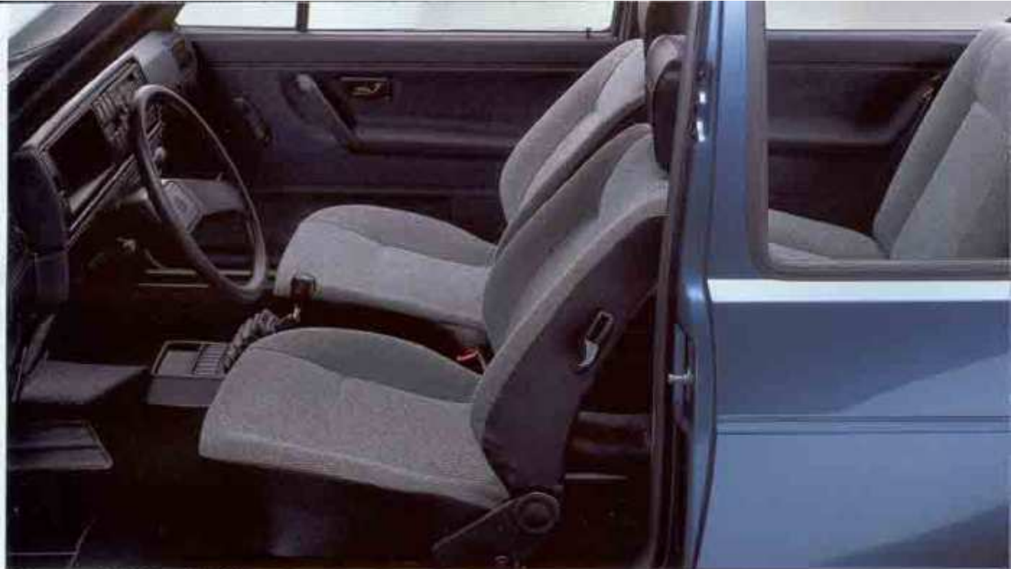
Der Innenraum des Golf C. Extra: Audio-System.