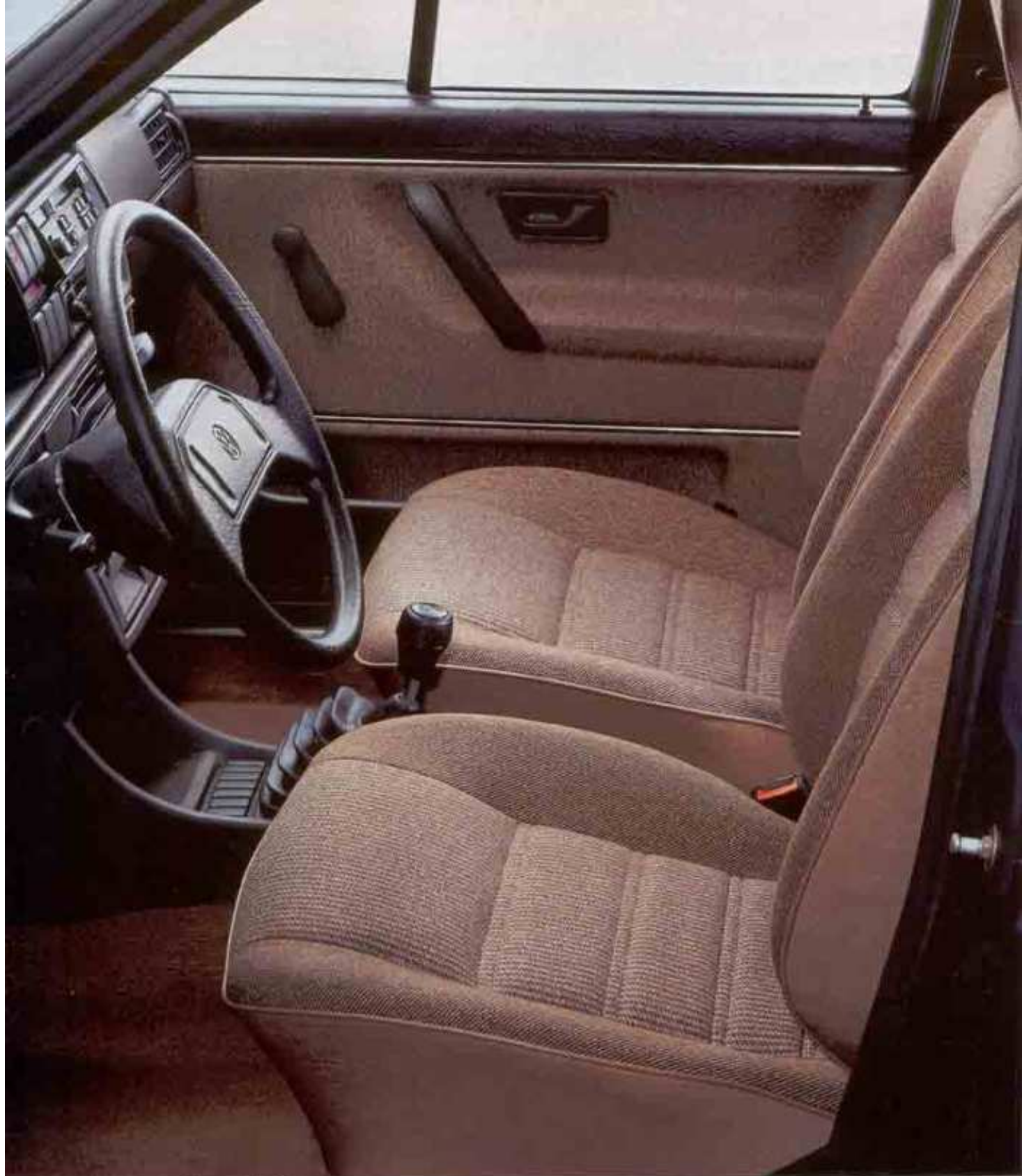
Der Innenraum des Golf GL Extra: Audi-System.