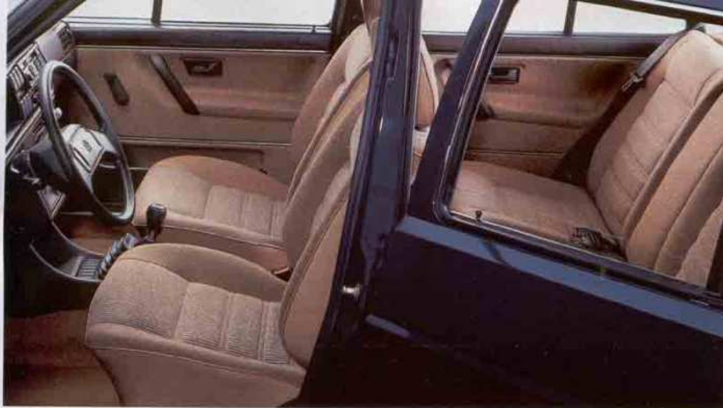
Der Innenraum des Golf CL Extra: Audio-System!