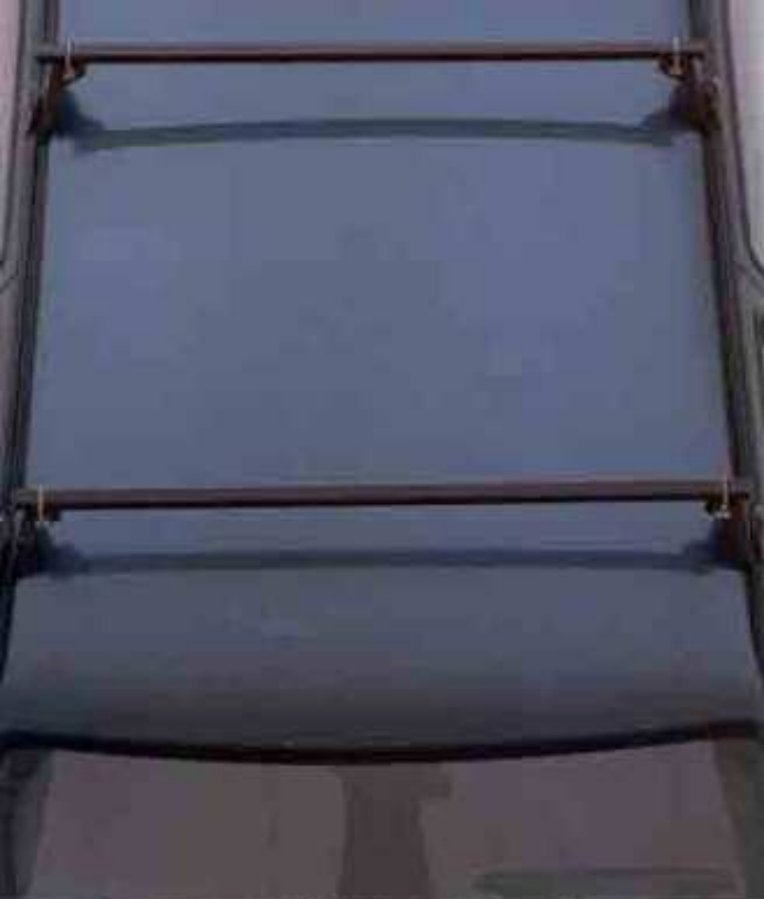
Das Grundträgerelement für Ski-, Surfbrett- und Fahrradhalter.