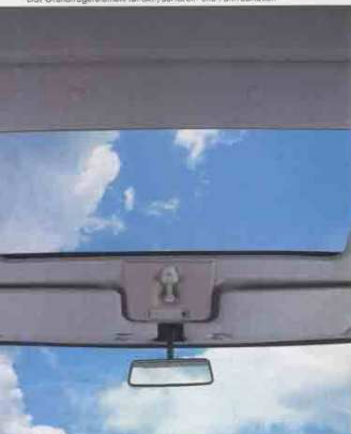
Das Schiebedach mit selbstaufstellendem Windabweiser.