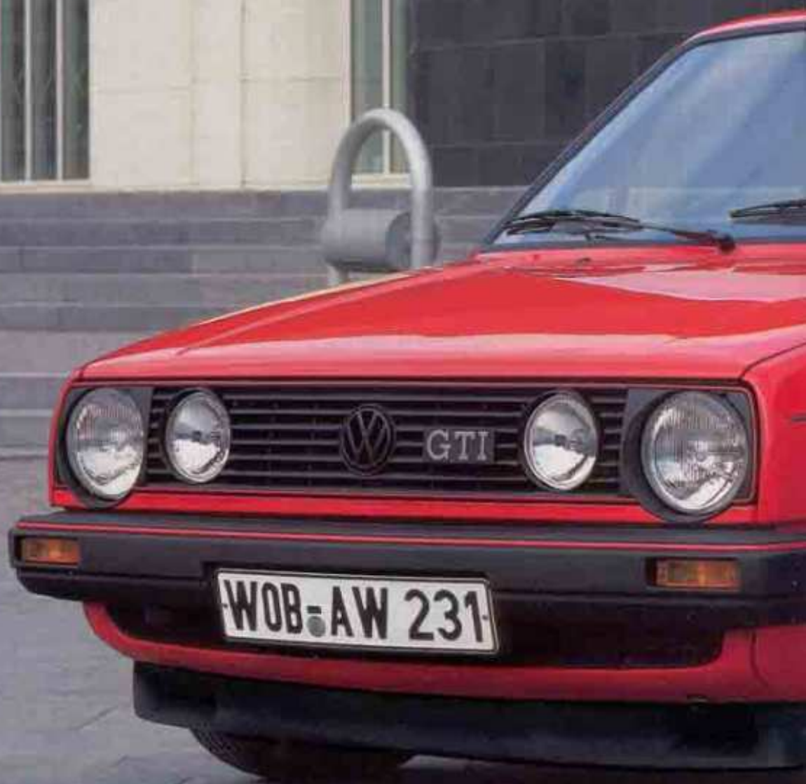
Der Golf GTI Extra: 6 J x 14-Räder mit 185/60 HR14-Reifen.