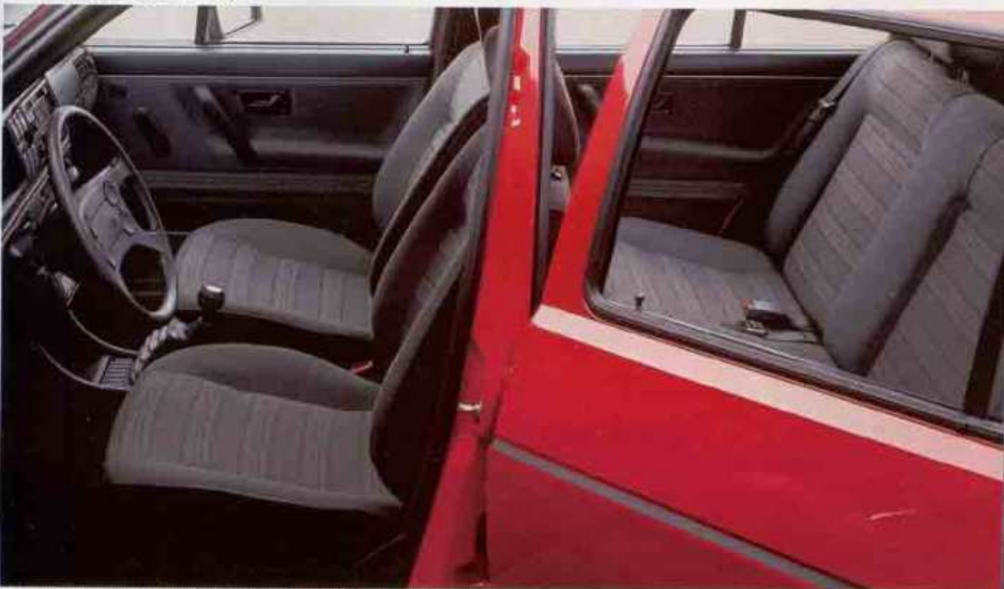
Der Innenraum des Golf GTD. Extras: Audio-System, Beifahreraußen Spiegel, Kopfstützen hinten.

Jetzt was ganz Starkes: der besonders sparsame Golf GTD. Dynamisch und kraftvoll, mit Doppelscheinwerfergrill, mit Heckspoiler, den breiten Reifen, den Kotflügelverbreiterungen, dem Vierspeichen-Sportlenkrad und der markanten schwarzen Heckfensterumrahmung.