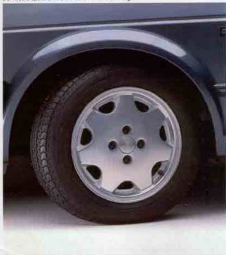
Das 6 J x 14-Leichtmetall-Schmiederad mit 185/60 HR 14-Reifen.