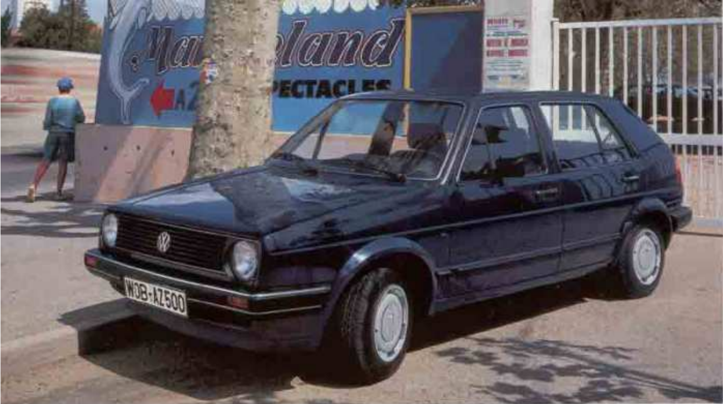
Der Golf GL, vierfüßig.