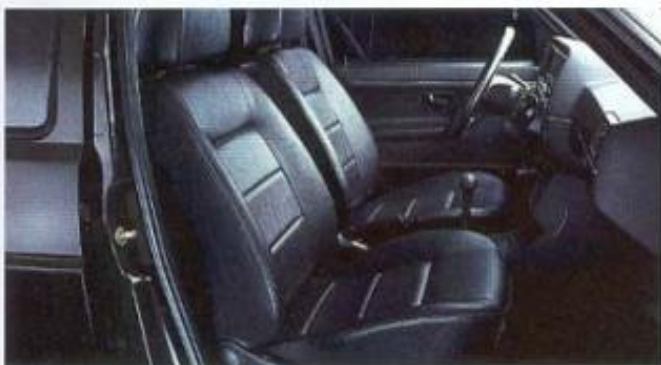
Die Innenraumvariante der Allround-Version.