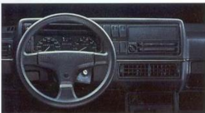
Die Armaturentafel des Golf Country mit Dreispeichen-Sportlenkrad.

Der Golf Country ist ein einzigartiges Spaß- und Freizeitauto für alle Individualisten. Aber da Geschmäcker nun mal verschieden sind, gibt es für den Country ab sofort eine neue Ausstattungsvariante.