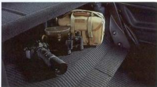
Die umklappbare Rücksitzbank und -lehne.