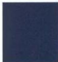
Brightblue met. SK 3034*