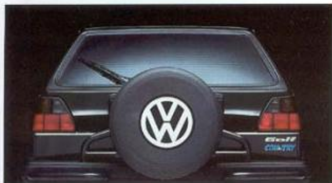
Das außenliegende Reserverad mit Schutzhülle.