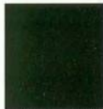
Dunkelgrün SK 9662