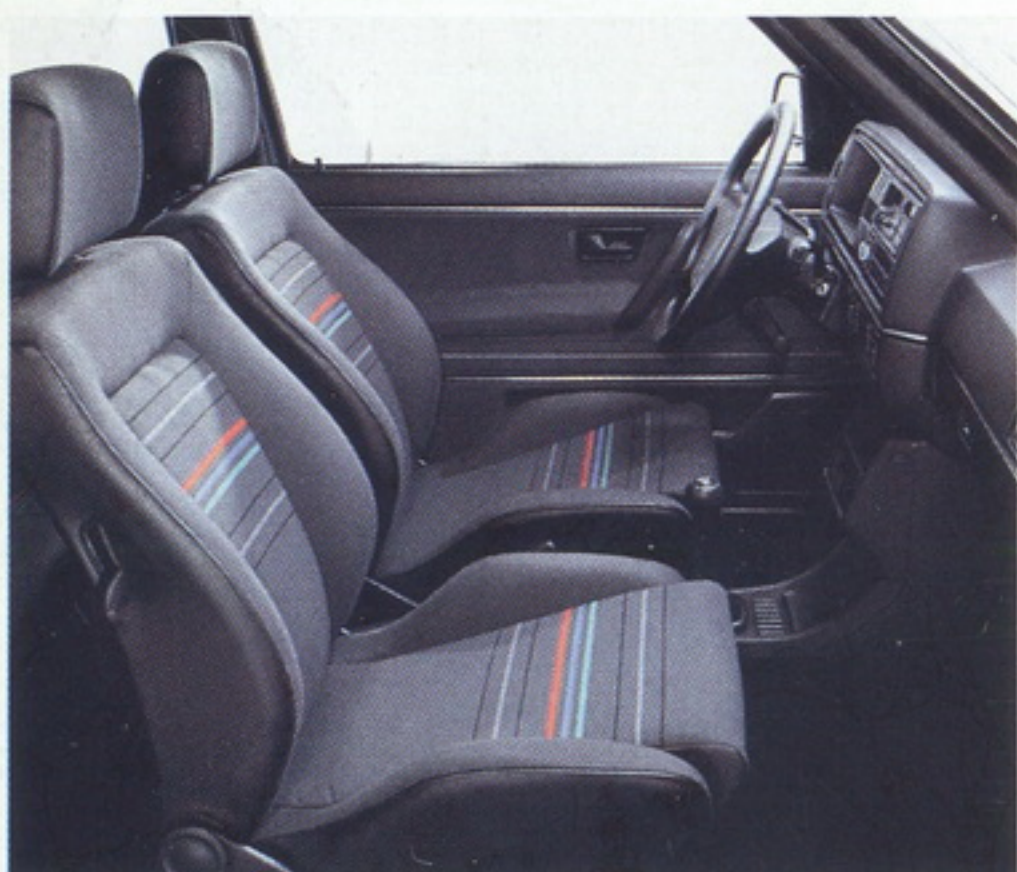
Der Innenraum des Golf Special.