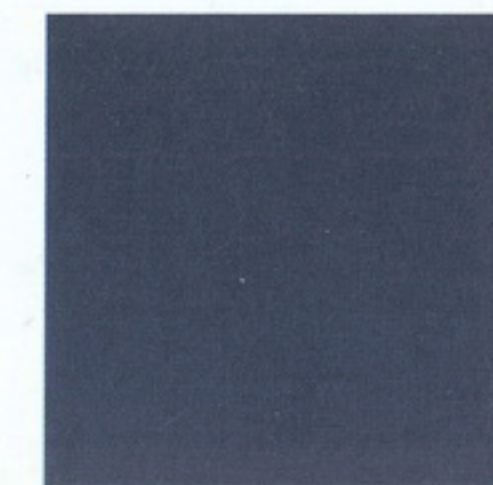
Heliosblau met. C5