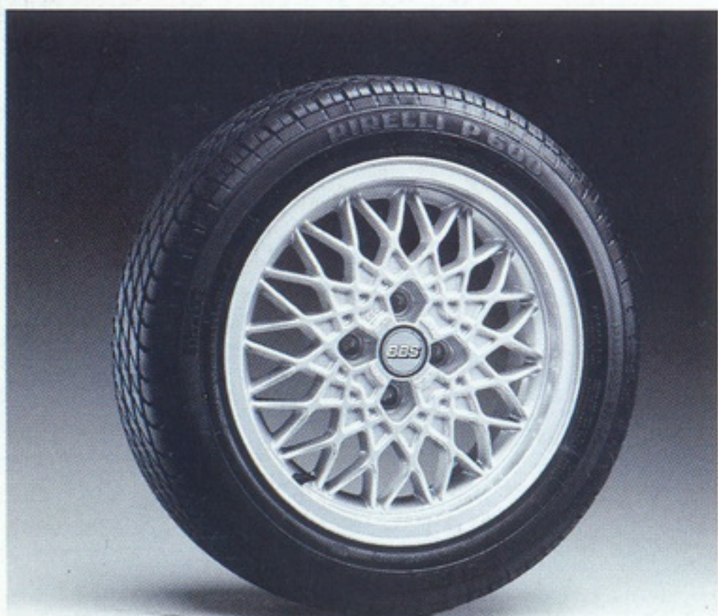
Die Felge des Golf Special.