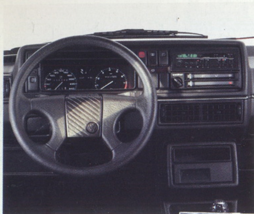
Die Armaturentafel des Golf Special.