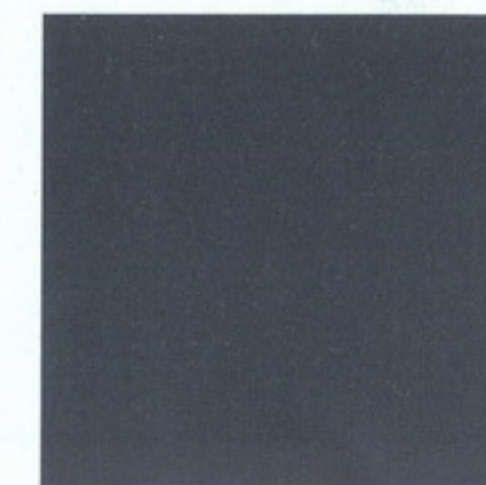
Schwarz met. 4961