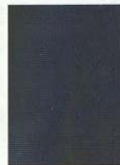
Atlasgrau metallic R4