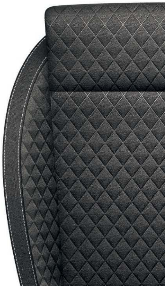
iV, sort (stof)