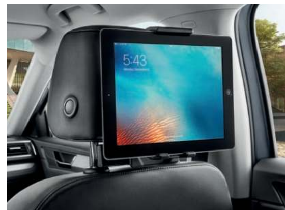
TABLET HOLDER TIL NAKKESTØTTE OG ARMLÆN