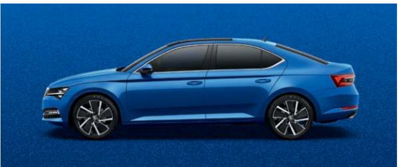
RACE BLUE METALLAK