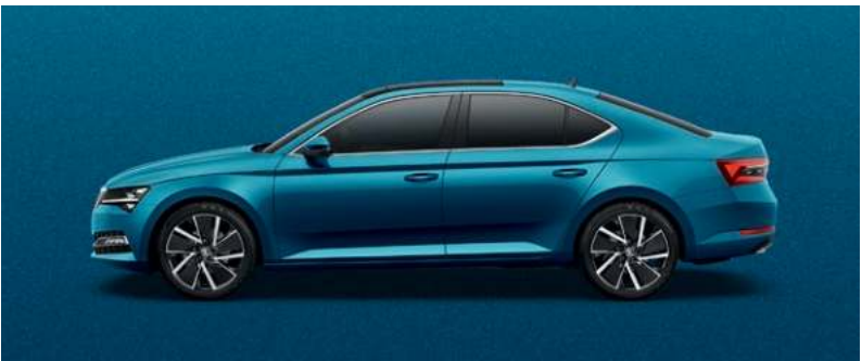
LAVA BLUE METALLAK