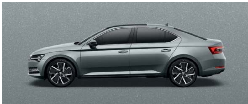
BUSINESS GREY METALLAK