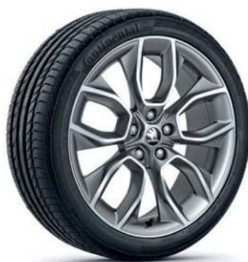
19" CRATER alufælg, design i antracit**