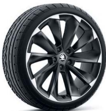
19" SUPERNOVA aluminiumsfælg i sort*