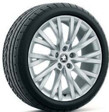
18" ANTARES aluminiumsfælge**