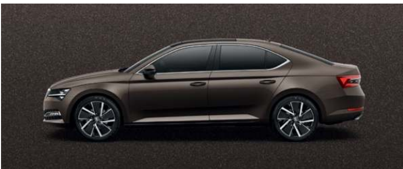
MAGNETIC BROWN METALLAK