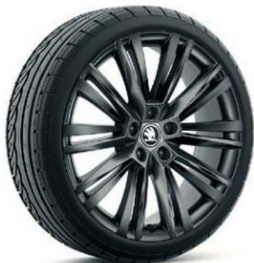
19" CANOPUS aluminiumsfælge i sort højglans**