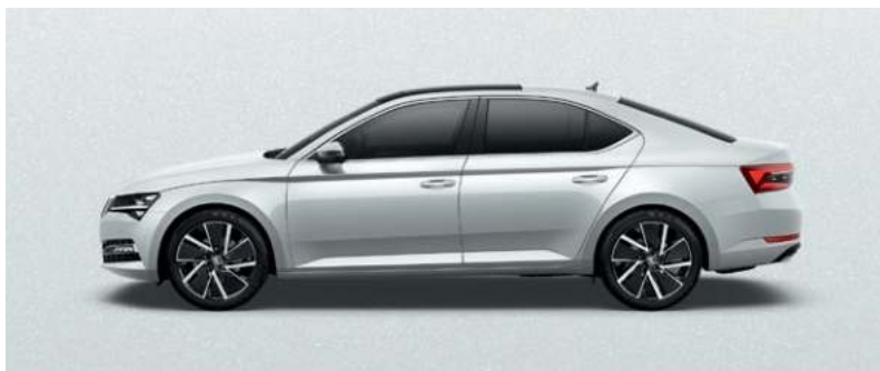
MOON WHITE METALLAK