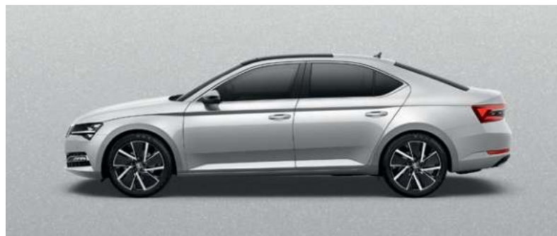
BRILLANT SILVER METALLAK