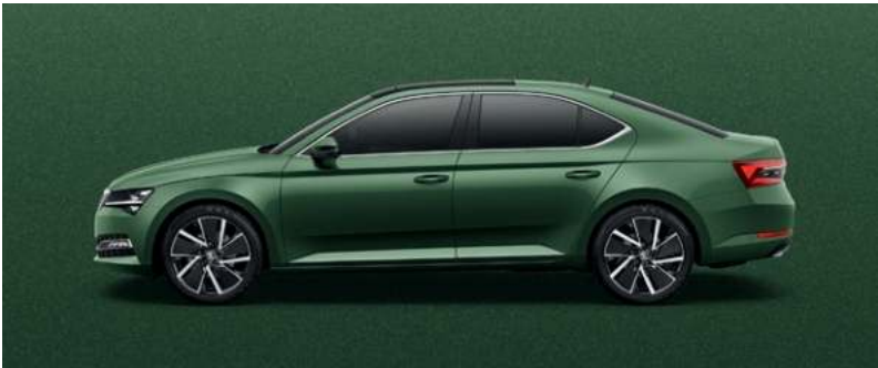
EMERALD GREEN METALLAK