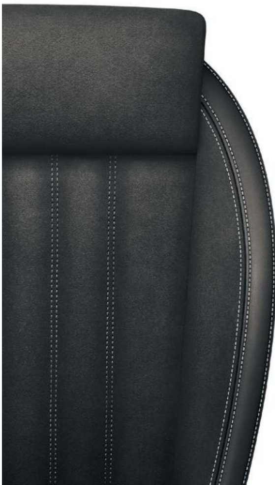
iV/iV Plus (Alcantara/læder/kunstlæder)