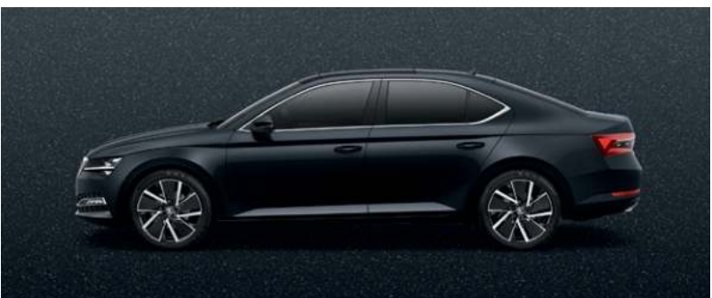
CRYSTAL BLACK METALLAK