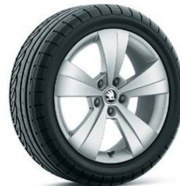
17" TRITON aluminiumsfælge**