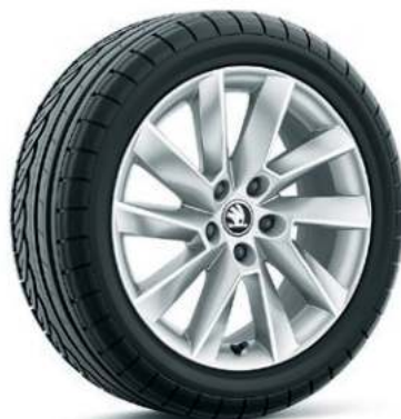
17" STRATOS aluminiumsfælge** (Standard iV & iV PLUS)