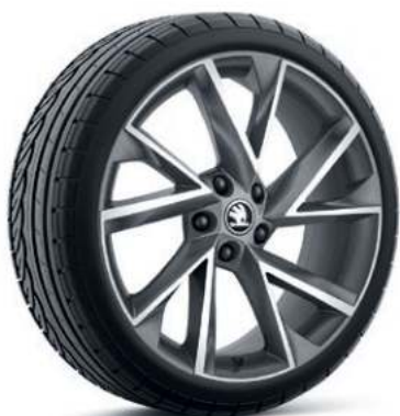
19" VEGA aluminiumsfælg i antracit*