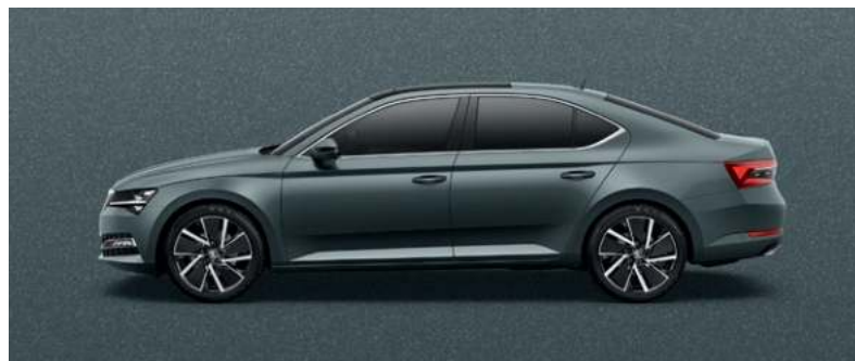
QUARTZ GREY METALLAK