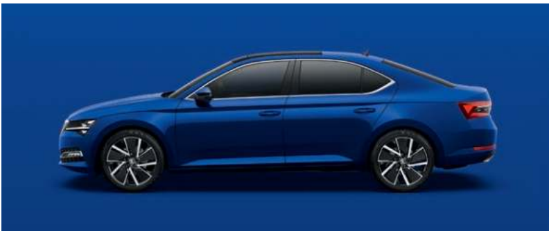
ENERGY BLUE STANDARDLAK