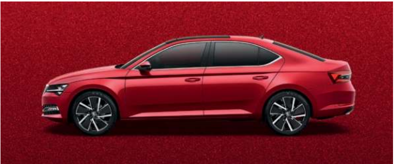
VELVET RED METALLAK