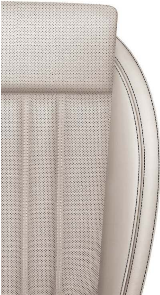
iV Plus beige (perforeret læder/kunstlæder) ventilerede forsæder