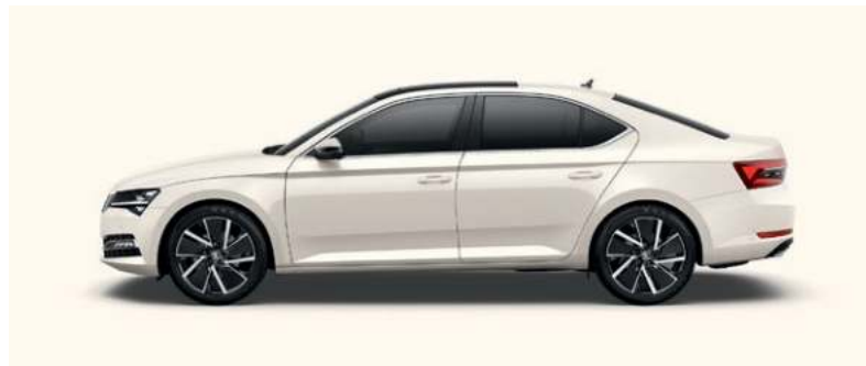
CANDY WHITE UNILAK