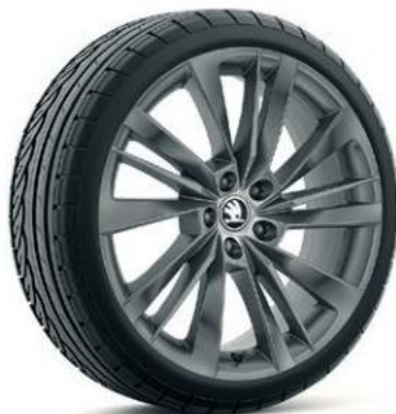
19" ACAMAR aluminiumsfælge i antracit**