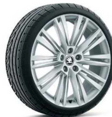
19" CANOPUS aluminiumsfælg**