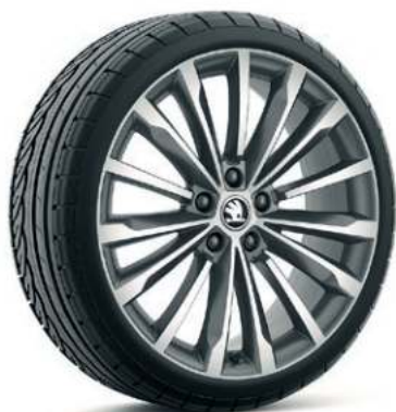
19" TRINITY alufælg, design i antracit**