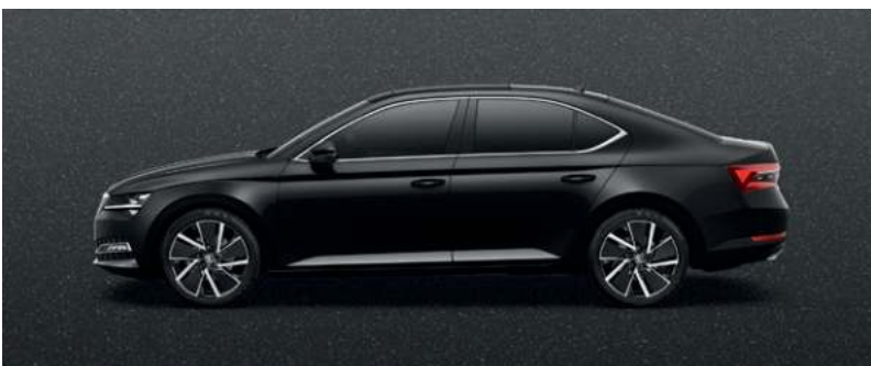
MAGIC BLACK METALLAK