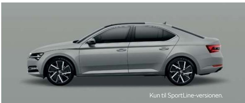
STEEL GREY UNILAK