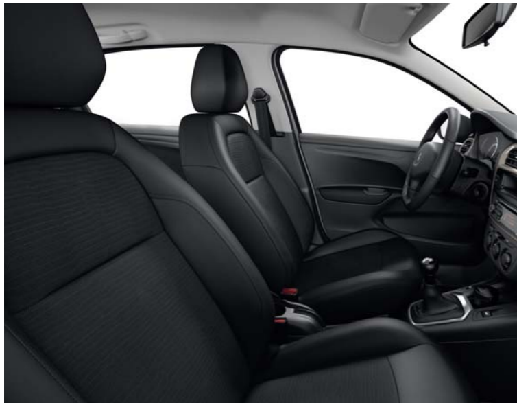
03 TISSU OLINE MISTRAL