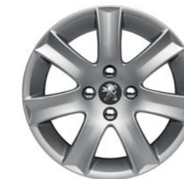
JANTE ALUMINIUM 16" SPA*

*En série, en option ou indisponible selon les versions.