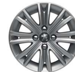
JANTE ALUMINIUM 15" HARVEY *