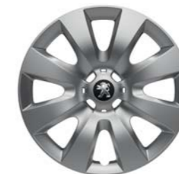
ENJOLIVEUR 15" HOBART*