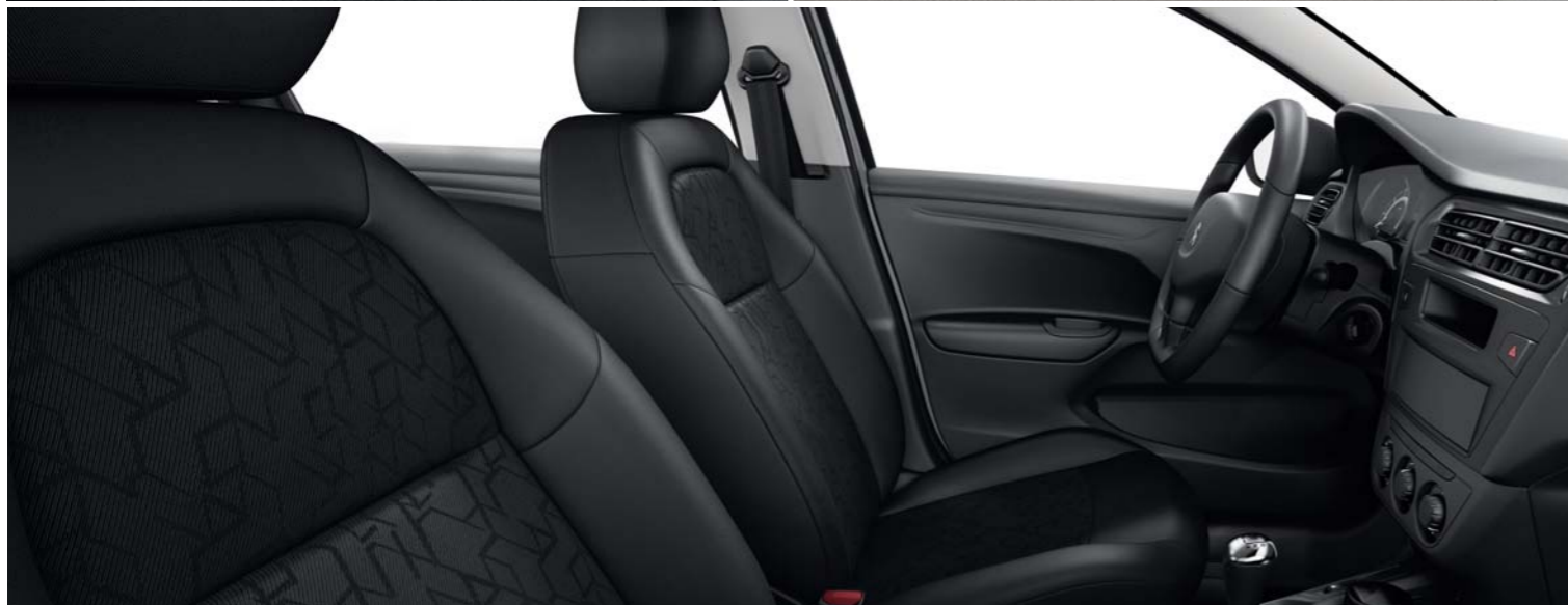
05 TISSU ISAR MISTRAL