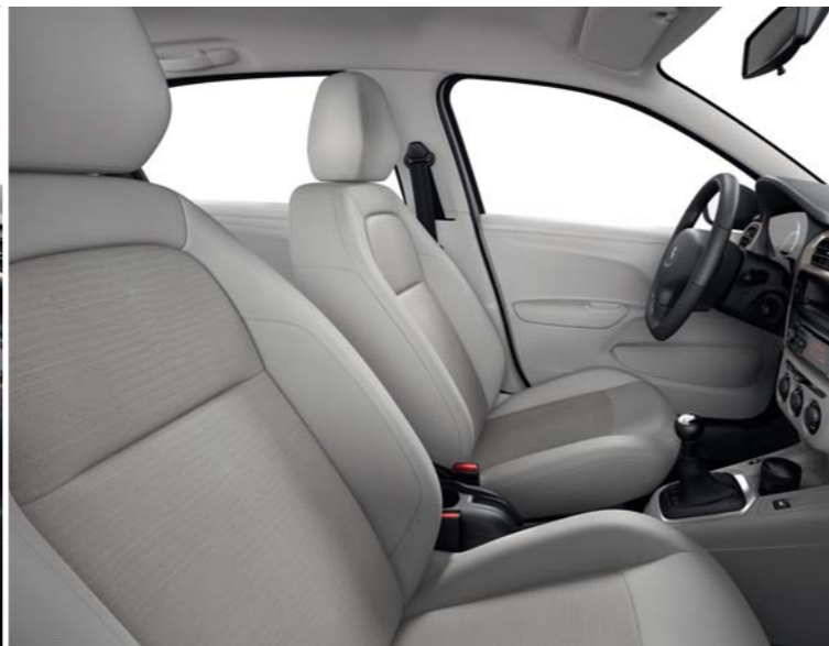
04 TISSU OLINE LAMA