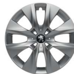
ENJOLIVEUR 15" BORE*