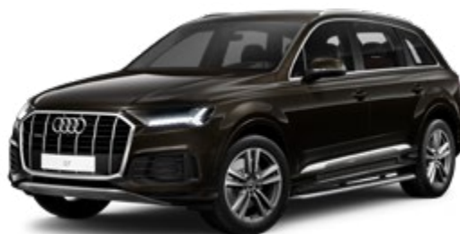
Tamarind Brown Metallic