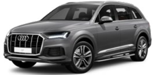
Samurai Gray Metallic