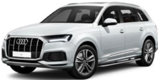
Glacier White Metallic