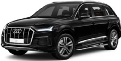
Myth Black Metallic