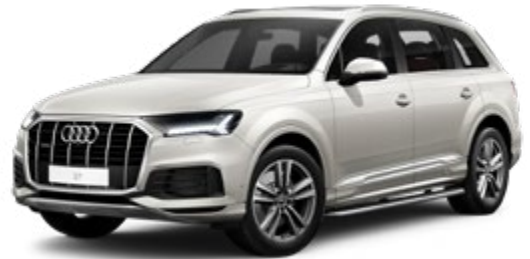
Vicuna Beige Metallic