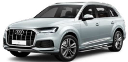
Satellite Silver Metallic