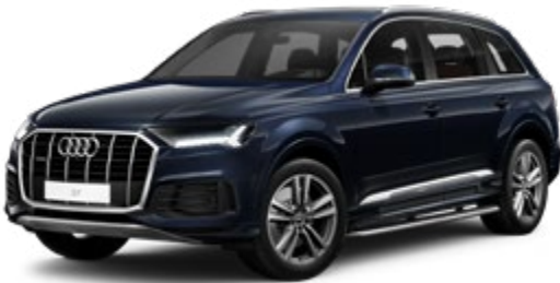
Waitomo Blue Metallic