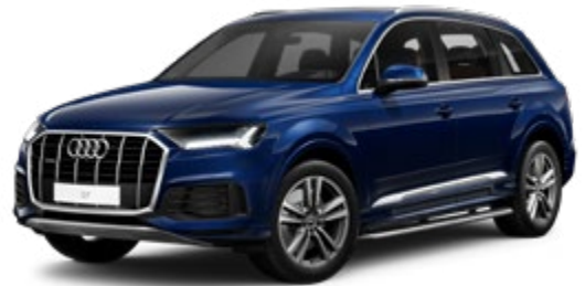
Navarra Blue Metallic