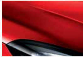
Pull Me Over Red