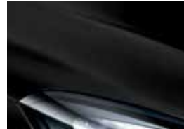
Black Meet Kettle