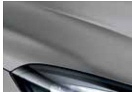
Satin Steel Gray