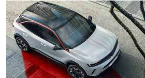
05 GS Line Features & Equipments