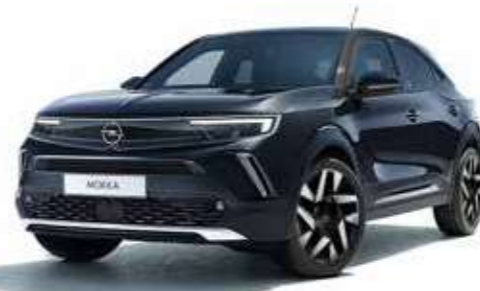
Diamond Black Elegance