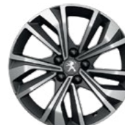
17" MERION, diamond cut, two-tone