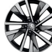
18" Two-Tone Alloy Wheels