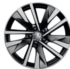
18" Two-Tone Alloy Wheels