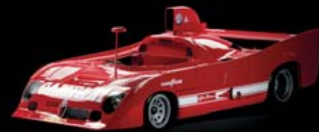
1975 - Tipo 33 TT12 Domina el "Mundial de Marcas"