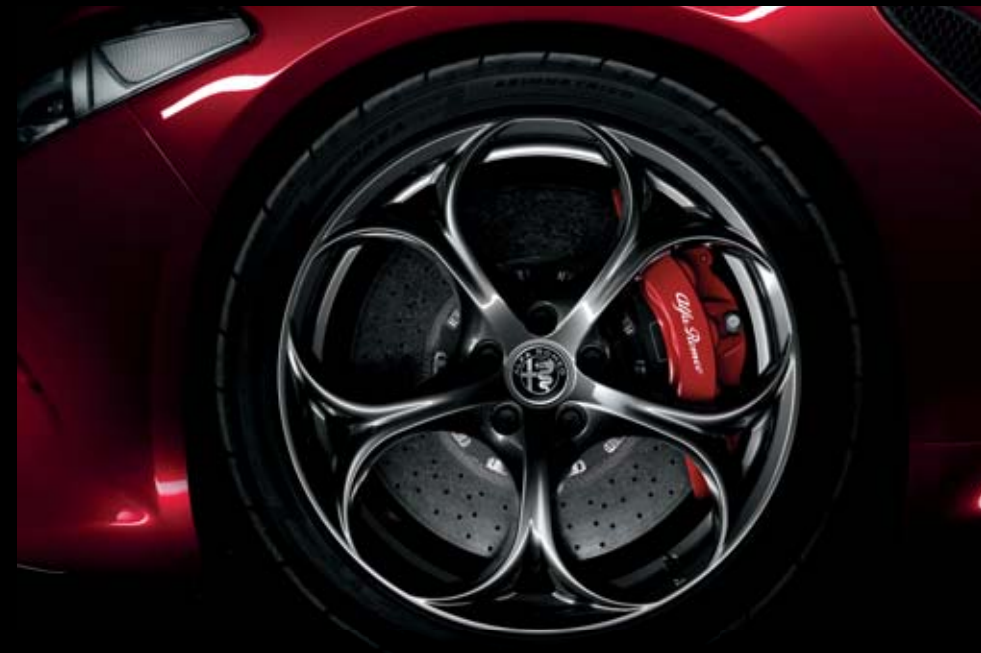
Llantas de 19" cromadas oscuras