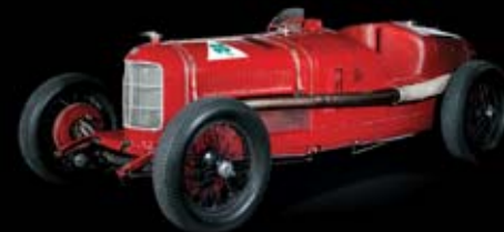
1925 - Gran Premio Tipo P2 El primer campeonato del mundo de la historia