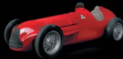
1951 - GP Tipo 159 "Alfetta" Gana los dos primeros mundiales de Fórmula 1