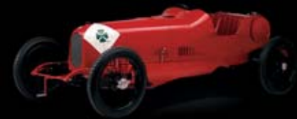
1923 - RL Targa Florio Domina la Targa Florio. Nace el Quadrifoglio

Al principio era un simple amuleto, más tarde se convirtió en algo mucho más mágico: récords en pista y victorias en carreras, ganadas por Alfa Romeo y sus pilotos. Cuando Ugo Sivocci ganó la Targa Florio en 1923, su trébol de cuatro hojas cruzó la línea de meta antes que él. Desde entonces, el Quadrifoglio ha acompañado a Alfa Romeo en sus victorias más legendarias: desde el P2 en el campeonato del mundo de 1925, hasta los "Alfetta" 158 y 159 en el campeonato del mundo de Fórmula 1 en 1950 y 1951 respectivamente. El Quadrifoglio es el símbolo de esa suerte que se puede labrar cuando se anteponen prestaciones y tecnología, como hace Alfa Romeo desde siempre.