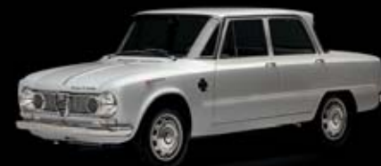
1963 - Giulia TI Super El Giulia hace su aparición