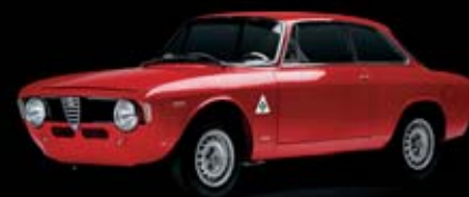
1965 - Giulia Sprint GTA GTA Imbatible entre los "Turismo"