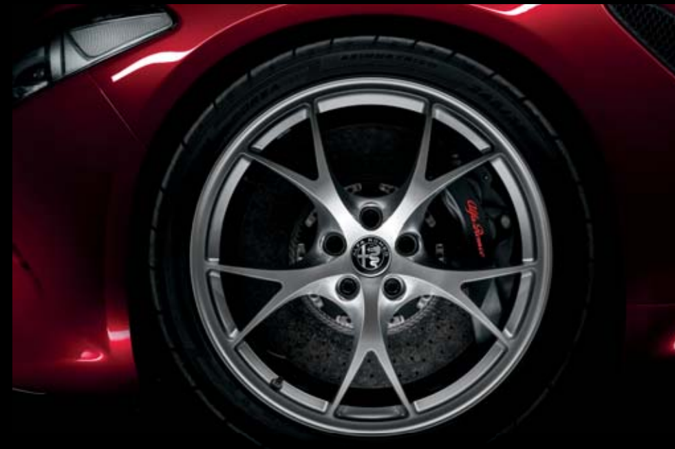
Llantas de 19" ultraligeras