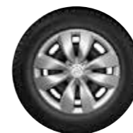
EMBELLECEDOR ASTÉRODÉA 15"