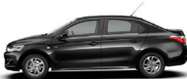
NEGRO ONYX (O)