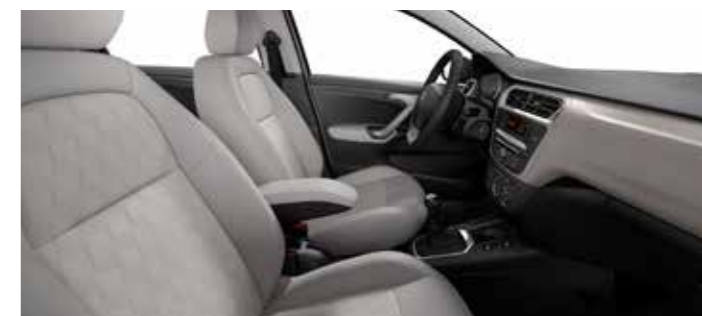
TEJIDO WAXE GRIS CLARO