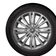
LLANTA BOSTON 16"