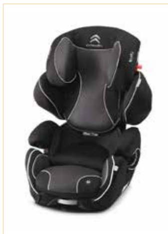
Gama de asientos infantiles