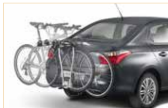
Portabicicletas sobre enganche de remolque

EL CITROËN C-ELYSEE es fácil de personalizar y dispone de numerosos accesorios prácticos.