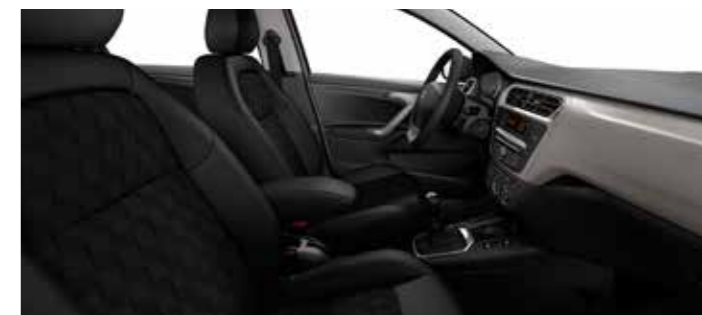
TEJIDO WAXE GRIS OSCURO