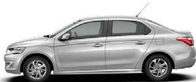
GRIS ALUMINIUM (M)