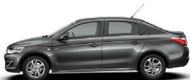
GRIS SHARK (N)