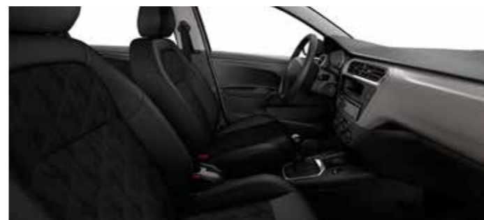
TEJIDO BIRDY GRIS OSCURO