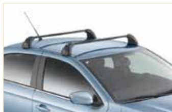
Barras de techo