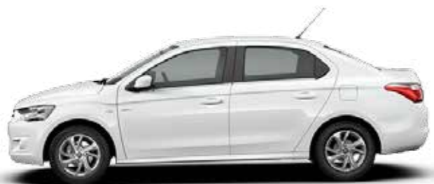
BLANCO BANQUISE (O)