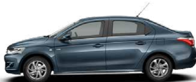
AZUL KYANOS (M)