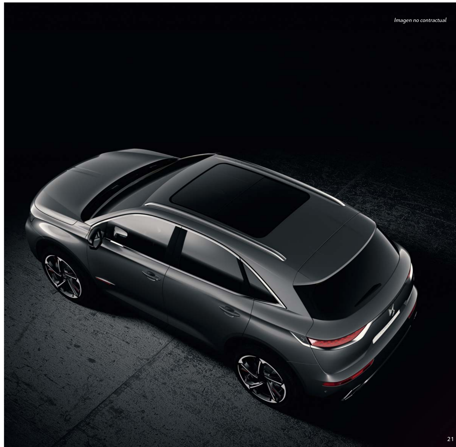
Imagen no contractual

Anticipar es el leitmotiv de la DS ACTIVE SCAN SUSPENSION. Para ello, la cámara situada detrás del parabrisas analiza las características de la carretera y las reacciones del DS 7 CROSSBACK (velocidad, ángulo del volante, frenado, etc.). Cuatro sensores de altura y tres acelerómetros transmiten estos datos en tiempo real a un calculador que actúa sobre cada una de las ruedas independientemente y según la información que recibe, regula la suspensión de manera continua para una mayor firmeza o suavidad. Funcionalidad, delicadeza y tranquilidad se unen en la conducción de este SUV excepcional.