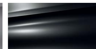
Gris Graphito (M)