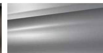
Gris Plata (M)