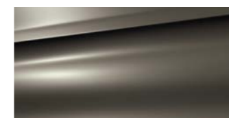
Beige Mativoire (M)