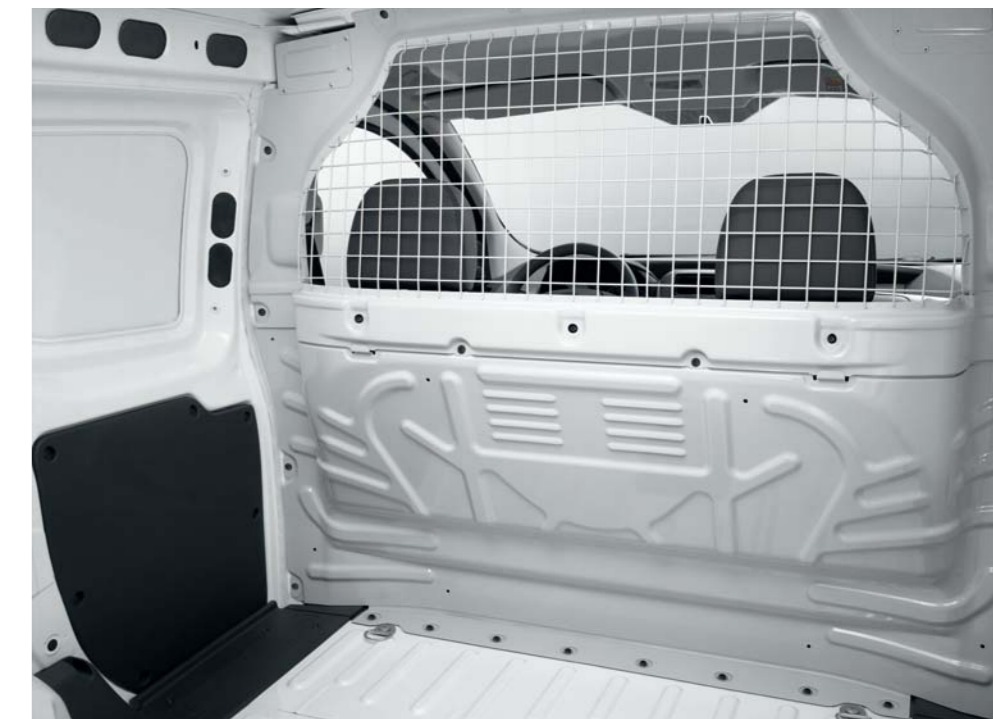
Panel de separación de plancha con rejilla en la parte superior

* Y otros materiales de acompañamiento. (M) : metalizado. Los colores metalizados y nacarados están disponibles en opción.