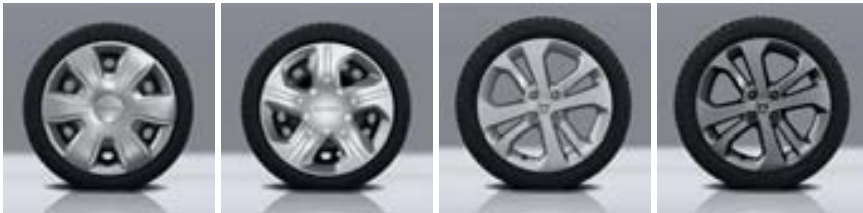
EMBELLECEDOR TISA 15"