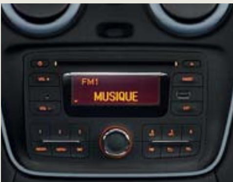
PLUG & RADIO