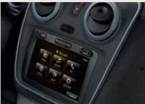
CONNEXIONES JACK Y USB EN LA CONSOLA