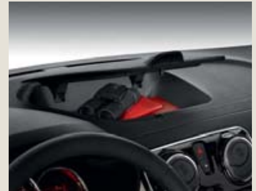
Porta-objetos en la parte alta del salpicadero.