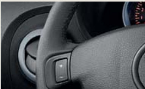
REGULADOR Y LIMITADOR DE VELOCIDAD