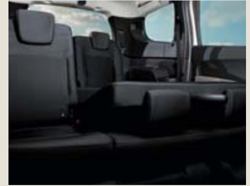
Banqueta 2ª fila abatible 1/3 - 2/3*.