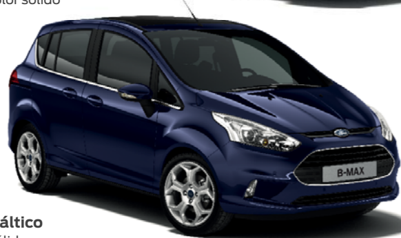
Azul Báltico Color sólido