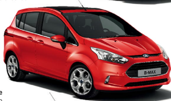
Rojo Race Color sólido