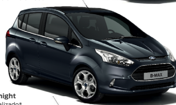
Gris Midnight Color metalizado*