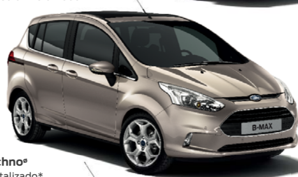
Gris Techno* Color metalizado*