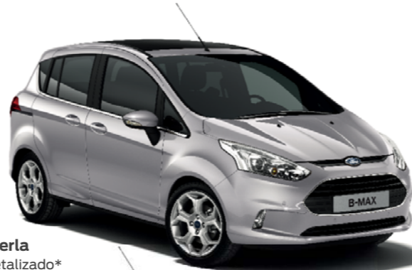
Plata Perla Color metalizado*