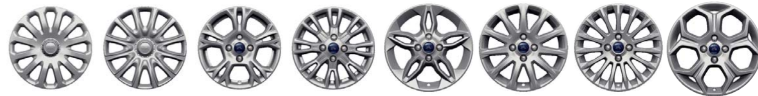
Cubre llantas de 15" y 12 radios (De serie en Ambiente) Cubre llantas de 15" y 12 radios (De serie en Trend) Llanta de aleación de 15" y 5 radios (Opcional en Trend) Llanta de aleación de 15" y 7 radios (Próxima comercialización) Llanta de aleación de 16" y 5 radios (De serie en Titanium X) Llanta de aleación de 16" y 11 radios (Opcional en Trend) Llanta de aleación de 16" y 15 radios (De serie en Titanium) Llanta de aleación de 17" y 5 radios (Opcional en Titanium y Titanium X)

Disfruta eligiendo el color y la tapicería de tu nuevo Ford B-MAX. Sabrás cual es la elección adecuada al instante.