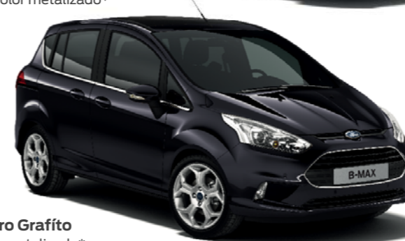
Negro Grafito Color metalizado*