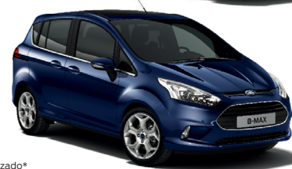
Azul Egeo Color metalizado*

*Fecha de disponibilidad a determinar. *La pintura Frozen White, metalizada y la tapicería de cuero son opciones con coste adicional. El Ford B-MAX está cubierto por la Garantía de protección antiperforación de Ford durante 12 años a partir de la fecha de la primera matriculación. Sujeto a términos y condiciones. Nota Las imágenes que aparecen en este catálogo son solo ilustrativas de los colores de carrocería y pueden no coincidir con las especificaciones actuales. Los colores y tapicerías reproducidos en este catálogo podrían mostrar variación respecto a la realidad debido a las limitaciones del proceso de impresión.