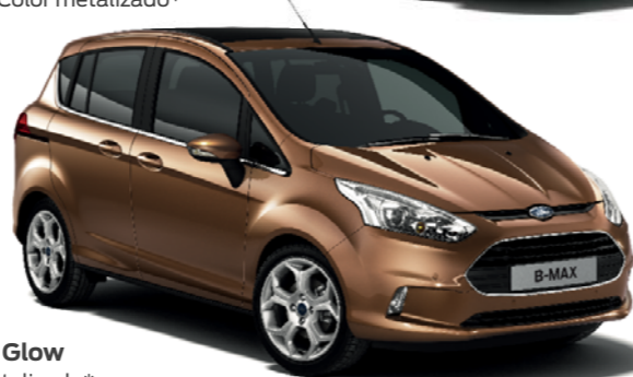
Marrón Glow Color metalizado*