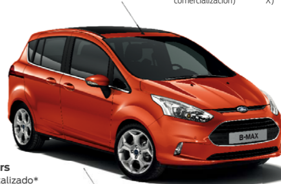
Rojo Mars Color metalizado*