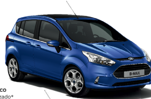
Azul Náutico Color metalizado*