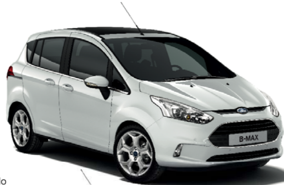
Blanco* Color sólido