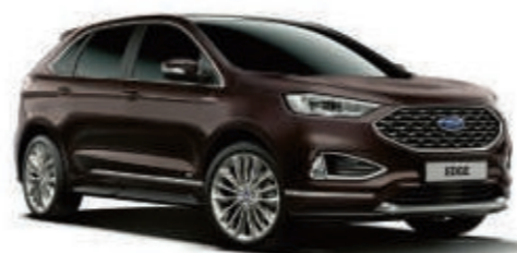
Vignale Nerissimo ® Metalizado*