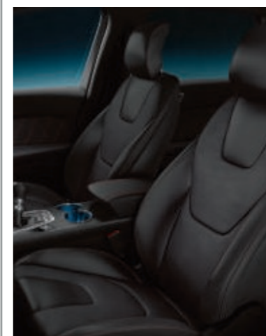
Cuero Parcial Salerno Perforado Sport en Ebony (De serie en ST-Line)