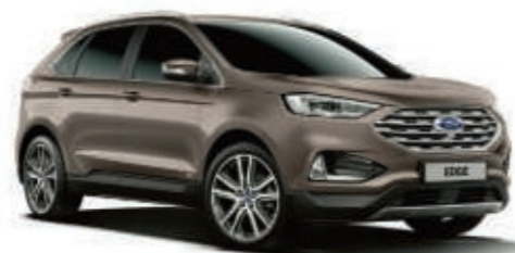
Gris Stone Metalizado*