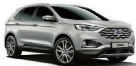
Plata Ingot Metalizado*