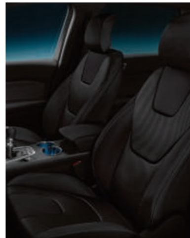
Tapicería Reno en relieve en Prada Ebony (De serie Titanium)