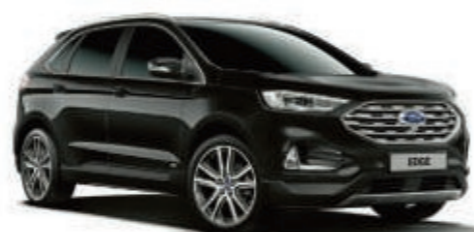
Negro Azabache Metalizado*