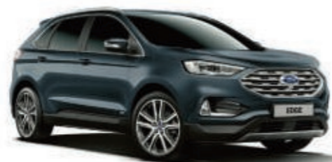
Verde Mar Báltico Metalizado*