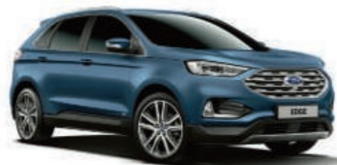
Azul Metallic Metalizado*