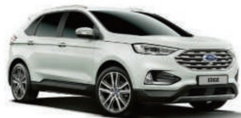
Blanco Oxford Sólido