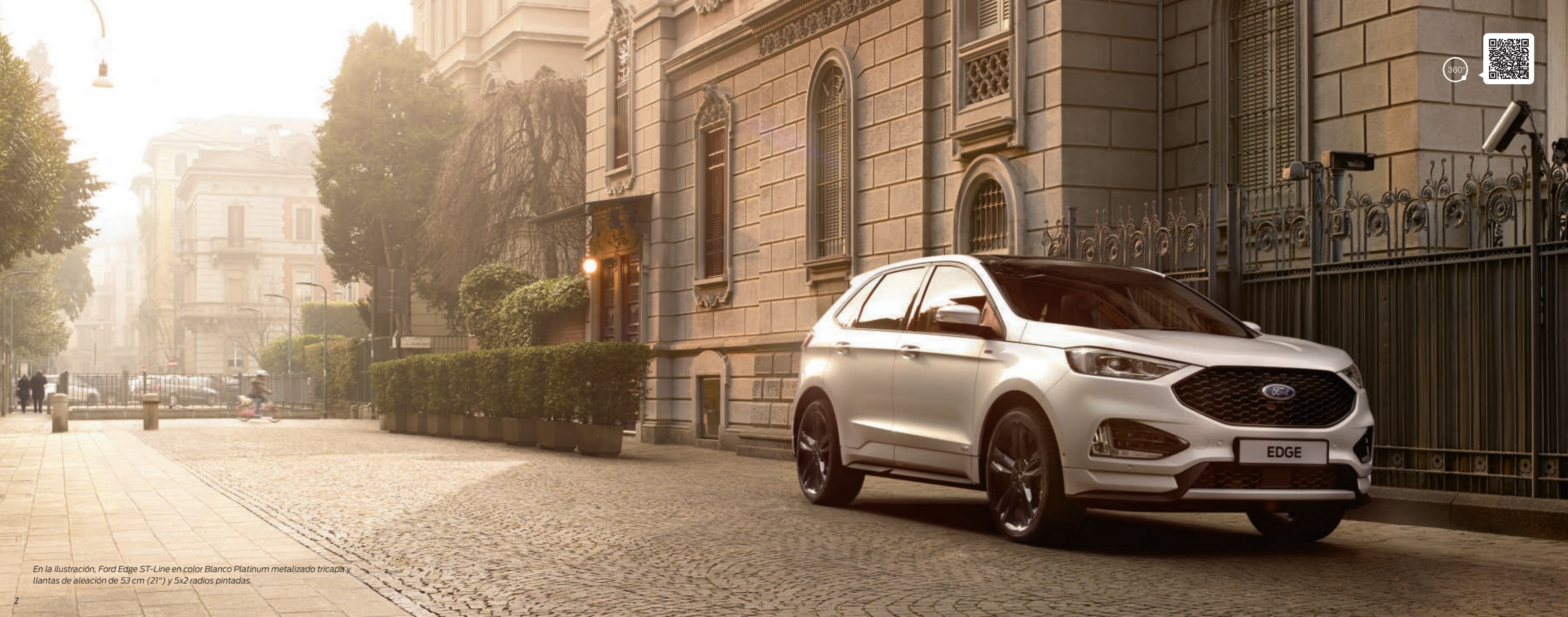
En la ilustración, Ford Edge ST-Line en color Blanco Platinum metalizado tricapa y llantas de aleación de 53 cm (21") y 5x2 radios pintadas.