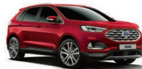
Rojo Rubí Metalizado con revestimiento transparente*