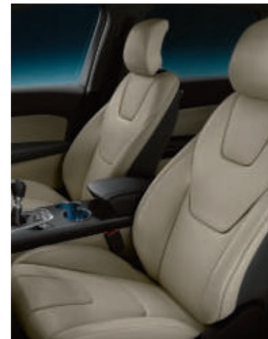
Cuero Salerno micro perforado en Blanco Ceramic (Opción en Titanium)