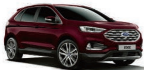
Burdeos Velvet Metalizado tricapa*