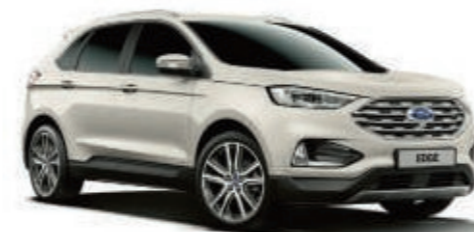
Blanco Platino Metalizado tricapa*