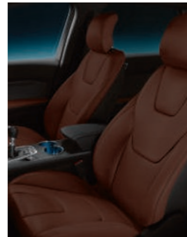
Cuero Salerno en Tobacco (Opción en Titanium)