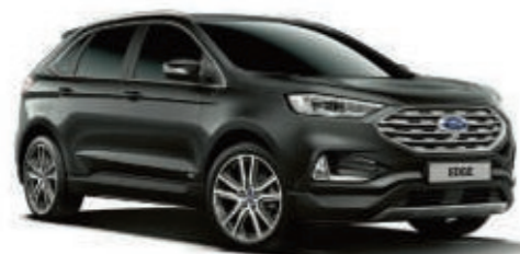
Gris Magnético Metalizado*