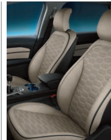
Cuero perforado Windsor en Blanco Cashmere (De serie en Vignale)