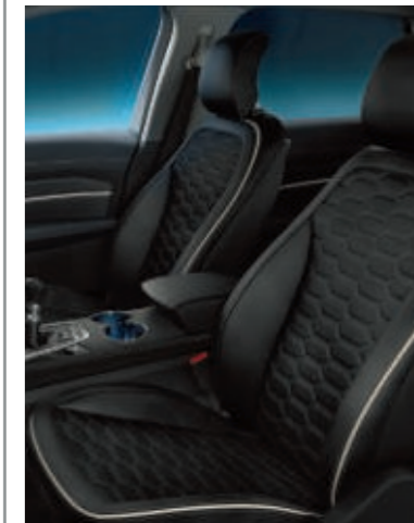
Cuero perforado Windsor en Negro Ebony (Opción en Vignale)