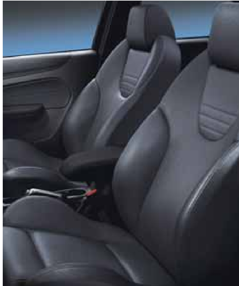
Fronte de asiento de de cuero Recaro Louis en Ebony Laterales de asiento de piel Verona en Ebony

Elije tu color de carrocería de una rica paleta de colores, incluido el Naranja Eléctrico tricapa metalizado de edición limitada.