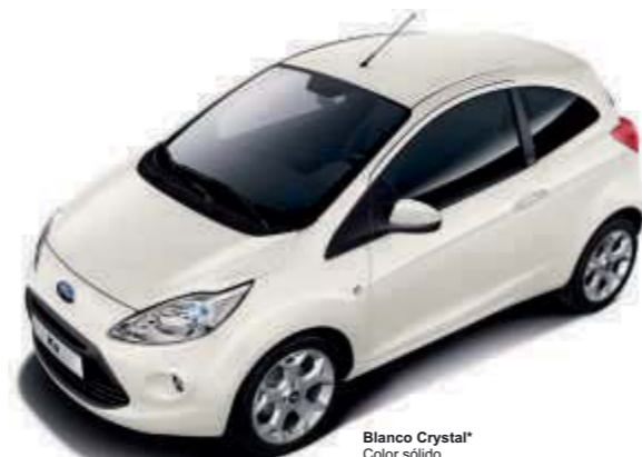
Blanco Crystal* Color sólido