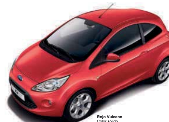
Rojo Vulcano Color sólido