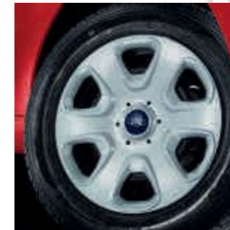
Embelledor de 14" (De serie en Trend+)