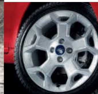
Llanta de aleación de 16" y 5 radios de diseño Y (Opcional en Titanium+, de serie en Black Edition y Grand Prix)