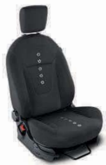
Tapicería de asientos y paneles de puertas de diseño exclusivo En negro e inserciones de anillos con acabado cromado y cabeceros negros.

Nota: Black Edition está disponible únicamente con el color exterior negro Midnight.