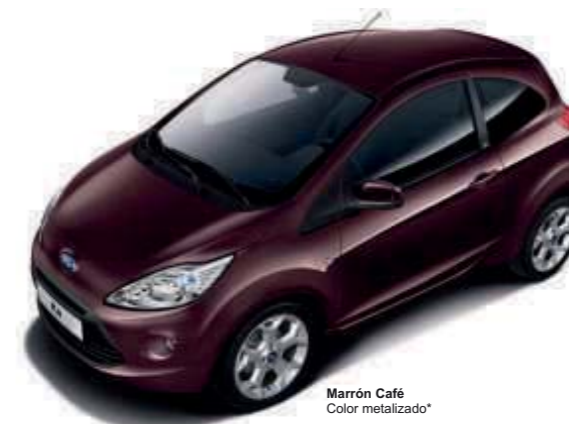
Marrón Café Color metalizado*