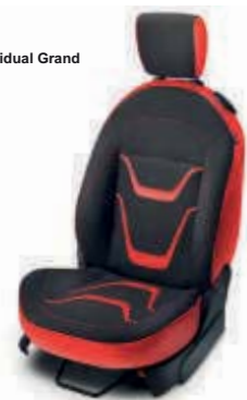
Tapicería individual Grand Prix (Grand Prix)