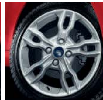
Llanta de aleación de 16" de 5x2 radios. (Opcional en Titanium+)