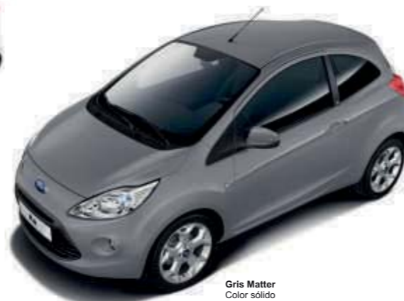
Gris Matter Color sólido