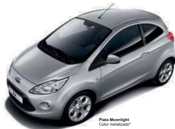
Plata Moonlight Color metalizado*