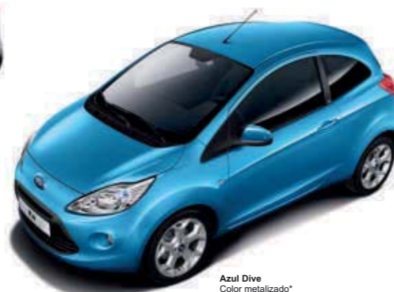
Azul Dive Color metalizado*