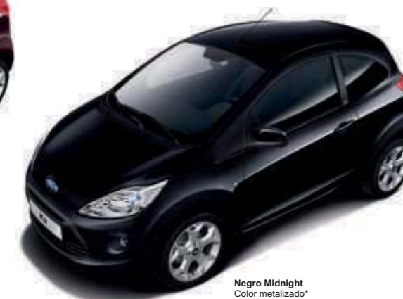
Negro Midnight Color metalizado*