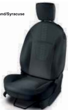
Tela Gris Fairland/Syracuse (Titanium+)