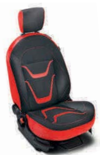
Asientos con tapicería exclusiva Grand Prix en rojo con inserciones en rojo

*Grand Prix sólo está disponible con color exterior rojo Vulcano.