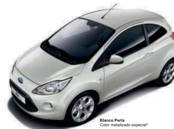
Blanco Perla Color metalizado especial*