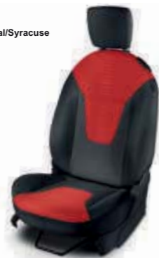
Tela Rojo Coral/Syracuse (Titanium+)