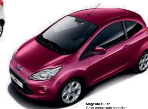
Magenta Blush Color metalizado especial*

*El color blanco Crystal, los colores metalizados y especiales son opciones con coste adicional.