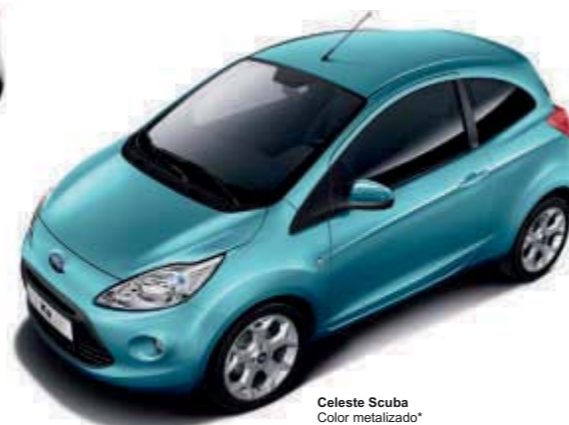
Celeste Scuba Color metalizado*