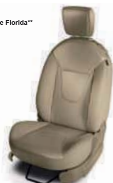
Cuero en Beige Florida** (Titanium+)