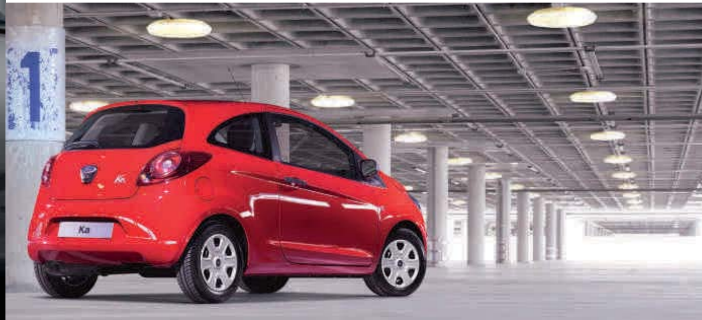
Imagen de arriba: El modelo mostrado es un Ford Ka Trend con pintura Rojo Vulcano (opcional).

Imagen página opuesta: El modelo mostrado es un Ford Ka Trend con interior Syracuse/Fairland y Music Pack (opcional).