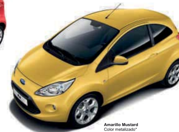
Amarillo Mustard Color metalizado*