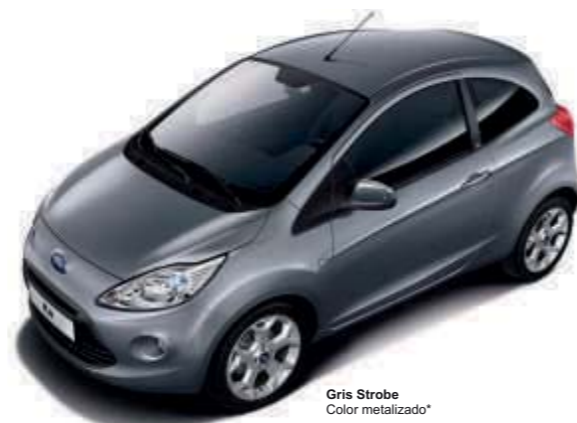
Gris Strobe Color metalizado*