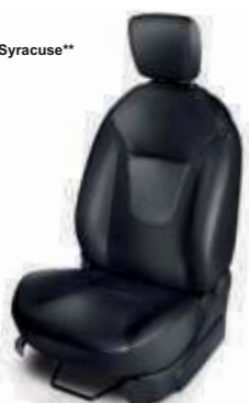
Cuero en Gris Syracuse** (Titanium+)