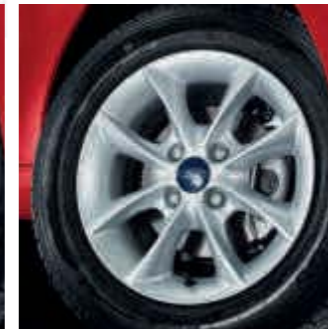
Llanta de aleación de 14" y 8 radios (Opcional en Trend+, Accesorio)