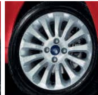
Llanta de aleación de 15" y radios múltiples (De serie en Titanium+, Accesorio)