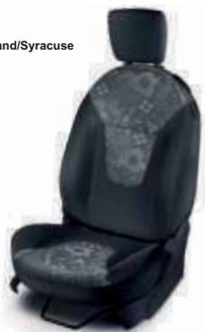
Tela Gris Fairland/Syracuse (Trend+)