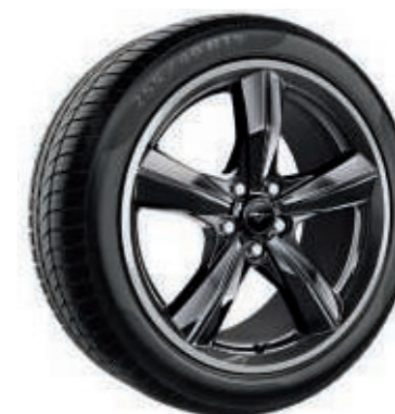
Llantas de aleación de 19" x 9" (delanteras) y 19" x 9,5" (traseras) con diseño de 5 radios con tema "BULLIT" y pintura en negro brillante

Equipadas con neumáticos delanteros 255/40 y traseros 275/40. (Consultar disponibilidad)