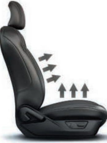
Los asientos delanteros de piel llevan calefacción y refrigeración, y cuentan con ajuste eléctrico de 6 posiciones. El asiento del conductor también incluye apoyo lumbar ajustable eléctrico. (De serie)

El acogedor interior del Mustang tiene asientos delanteros de cuero con calefacción y refrigeración, ajuste eléctrico de seis posiciones y apoyo lumbar eléctrico para el conductor, para que puedas encontrar tu posición de conducción ideal. Los protectores de estribo de las puertas delanteras llevan un emblema de MUSTANG iluminado.