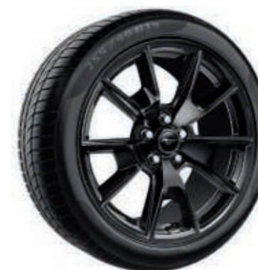
Llantas de aleación de 19" x 9" (delanteras) y 19" x 9,5" (traseras) con diseño de 5 radios en V y pintura en negro brillante con frente mecanizado

Equipadas con neumáticos delanteros 255/40 y traseros 275/40. (Consultar Disponibilidad)