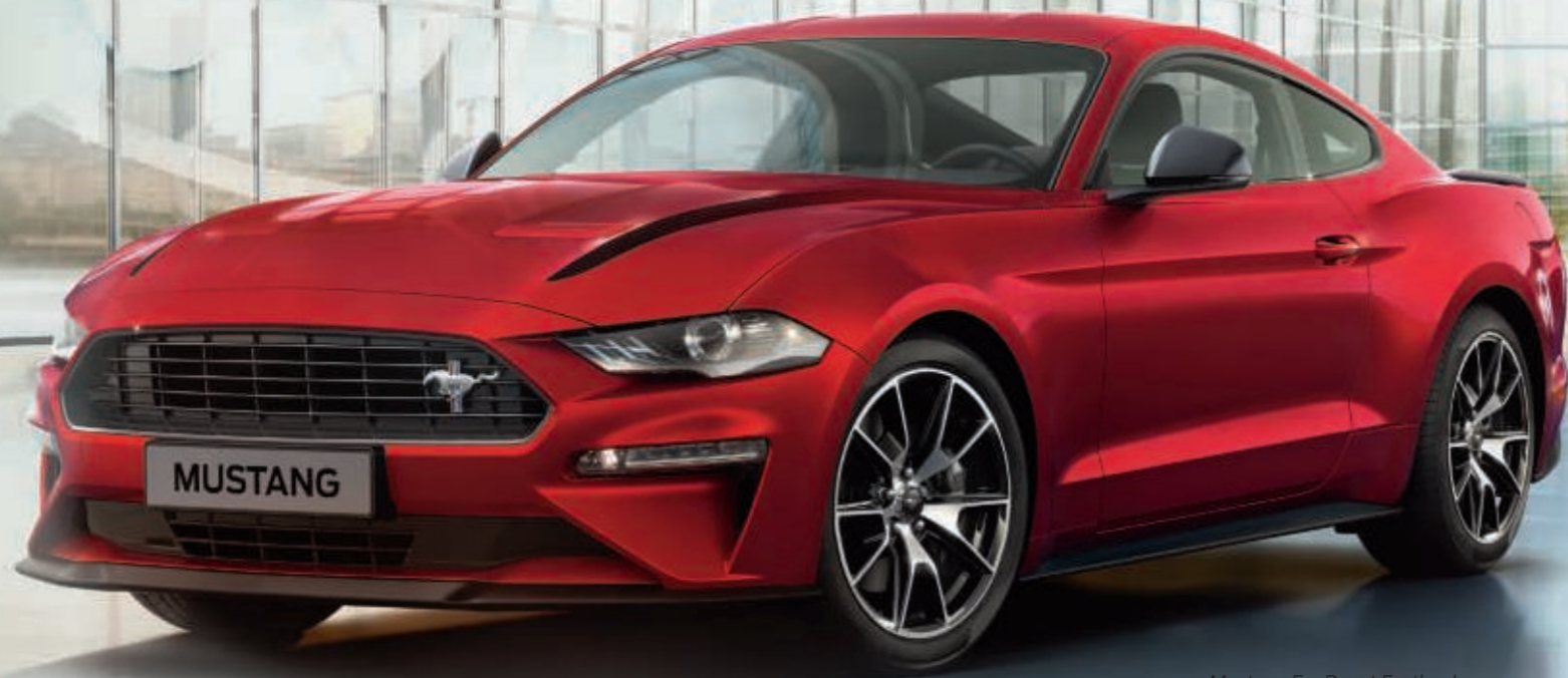
Mustang EcoBoost Fastback con carrocería en color Rojo Lucid (opción), con llantas de aleación de 19" y diseño de 5 radios en V con acabado mecanizado y pintura negra de bajo brillo.