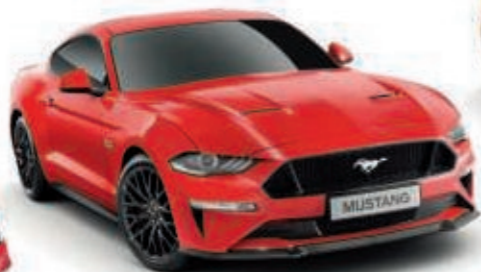
Rojo Race Color de la carrocería sólido*