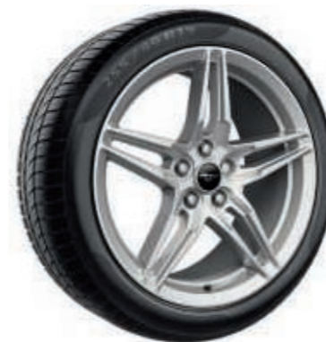
Llantas de aluminio forjado de 19" x 9" (delanteras) y 19" x 9,5" (traseras) con pintura Luster Nickel

Equipadas con neumáticos delanteros 255/40 y traseros 275/40. (De serie en GT)