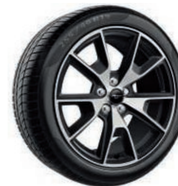
Llantas de aleación de 19" x 9" y diseño de 5 radios en V con acabado mecanizado y pintura en negro de bajo brillo

Complementa el estilo impresionante de tu nuevo Mustang con un juego de llantas de aleación de precioso diseño. Ofrecen una combinación ideal de resistencia y peso ligero, no solo con un aspecto excelente, sino que también ayudan a reducir el peso no suspendido para mejorar la marcha y la conducción.