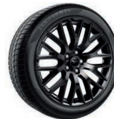
Llantas de aleación de 19" x 9" (delanteras) y 19" x 9,5" (traseras) con diseño de 5 radios en Y y pintura en negro brillante

Equipadas con neumáticos delanteros y traseros 255/40. (De serie en EcoBoost)