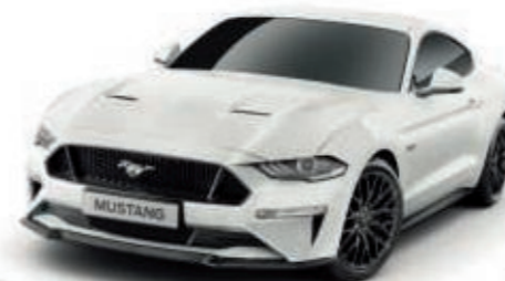
Blanco Color de la carrocería sólido