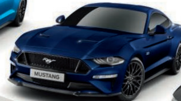
Kona Blue Color de la carrocería metalizado*