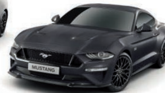
Gris Magnético Color de la carrocería metalizado*