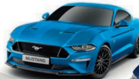
Azul Velocity Color de la carrocería metalizado*