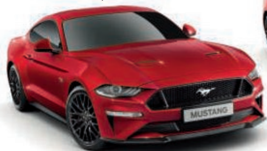
Rojo Lucid Color de la carrocería metalizado (barniz teñido)*