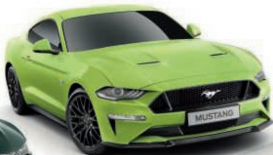
Verde Lima Color de la carrocería sólido