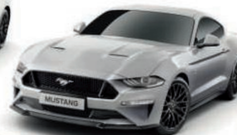
Plata Iconic Color de la carrocería metalizado*