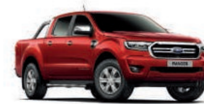
Rojo Cobre Pintura metalizada*