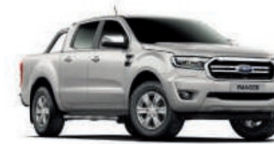
Plata Perla Pintura metalizada*