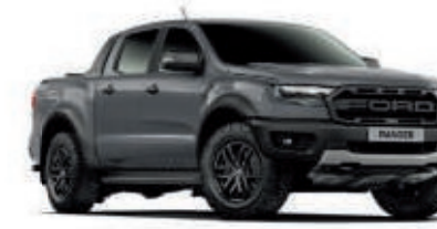
Gris Conquer Pintura sólida* (Ranger Raptor solamente)