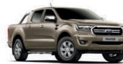
Plata Luna Pintura metalizada*