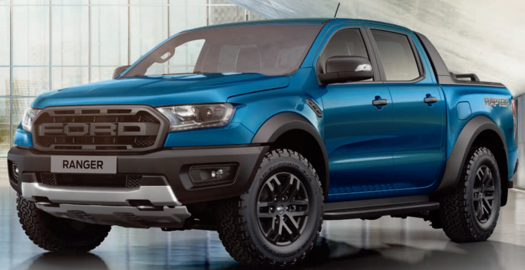
Arriba: El modelo de la imagen es un Raptor Doble Cabina en color Azul Ford Performance (opción).

Escanea el código QR para acceder al contenido adicional y ver la excepcional historia de Ford en acción.