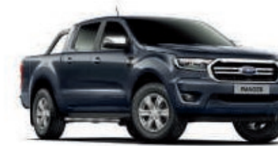
Gris Zinc Pintura metalizada*