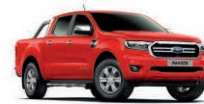
Rojo Vulcano Pintura sólida