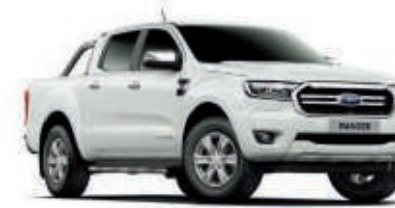
Blanco Pintura sólida