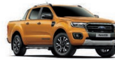
Naranja Sabre Pintura metalizada* (Ranger Wildtrak solamente)