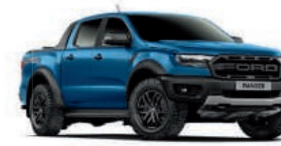
Azul Ford Performance Pintura metalizada* (Ranger Raptor solamente)