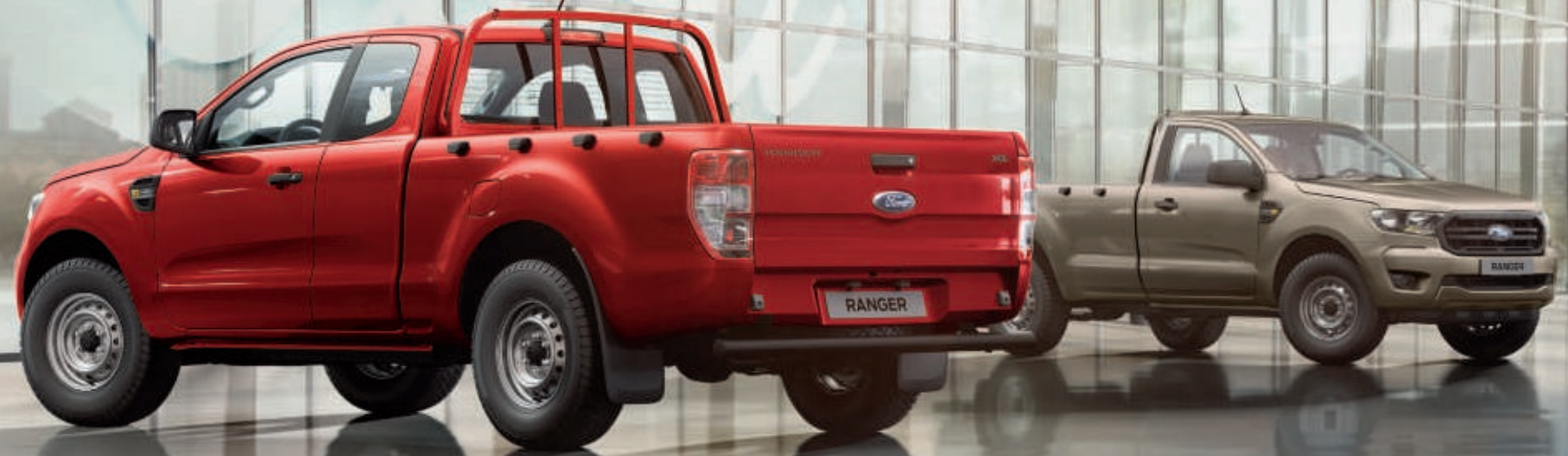
Izquierda: La versión mostrada es un XL Super Cab en color Rojo Cobre (opción).