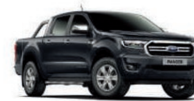
Negro Shadow Pintura metalizada*