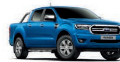
Azul Lightning Pintura metalizada*