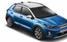
USP (Sporty Blue / Clear White) No disponible con acabado GT-line