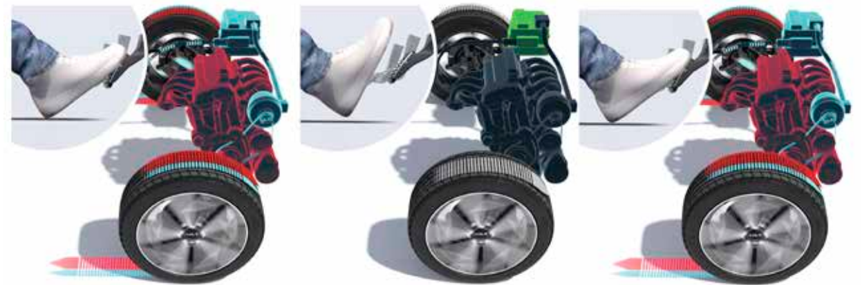
Representación visual simplificada del modo sistema MHEV iMT.

Al desacelerar hasta detenerse, el motor de combustión se apaga automáticamente para ahorrar combustible.