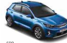
SPB (Sporty Blue)