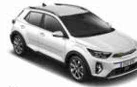
UD (Clear White) Sólido