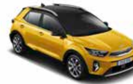
BMV (Most Yellow / Aurora Black Pearl)