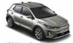
URG (Urban Green) No disponible con acabado GT-line