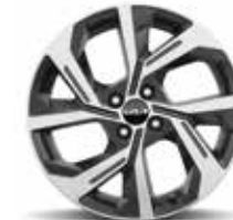
GT-line Neumáticos 205/55 con llantas de aleación de 43 cm -17"-

De conformidad con la Normativa (EU) 2020/740 sobre eficiencia de neumáticos y otros parámetros consulta nuestro sitio web [www.kia.com]. La información facilitada sobre neumáticos es meramente informativa.