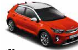
UBE (Signal Red / Clear White) No disponible con acabado GT-line