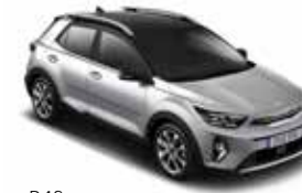
B4S (Silky Silver / Aurora Black Pearl)