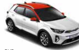
RUD (Clear White / Aurora Black Pearl)