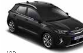
ABP (Aurora Black Pearl)