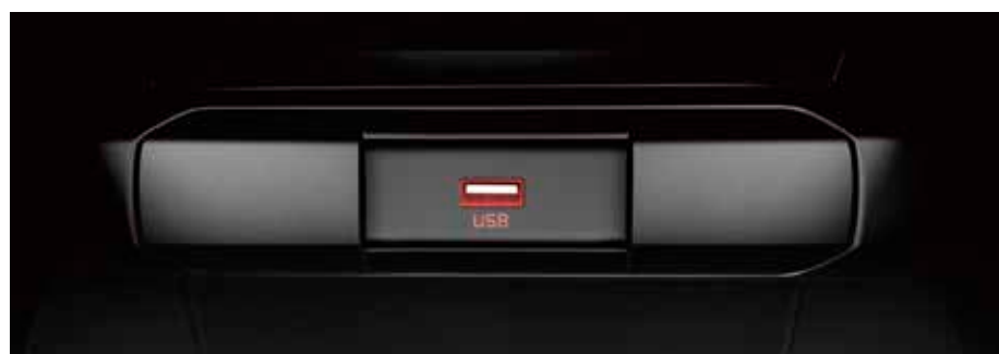
Toma USB frontal. Una salida USB te permite cargar móviles y otros dispositivos.