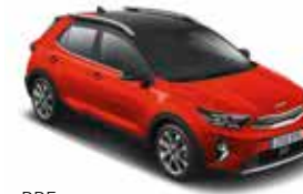
BBE (Signal Red / Aurora Black Pearl)