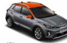
APX (Perennial Grey) / Tan Orange)