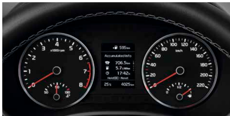
Panel de instrumentos tipo Supervision 10,7 cm (4,2"). La pantalla muestra información esencial del vehículo y del sistema de audio (según versiones).

En un mundo de velocidad vertiginosa, la información es poder y el Kia Stonic la sitúa exactamente donde la necesitas, a la vez que disipa toda distracción.