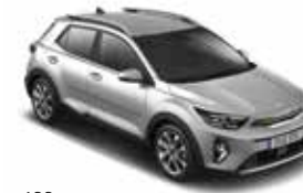
4SS (Silky Silver)