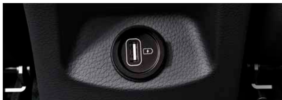
Cargador USB en las plazas traseras. Una clavija USB en la parte posterior del reposabrazos central permite también a los pasajeros de la parte trasera cargar sus dispositivos (según versiones).