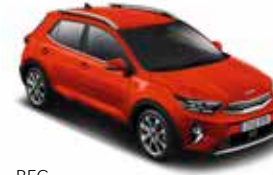
BEG (Signal Red)