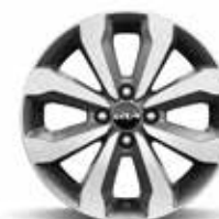
CONCEPT & DRIVE Neumáticos 195/55 con llantas de aleación de 40 cm -16"-