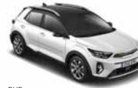
RUD (Clear White / Aurora Black Pearl)