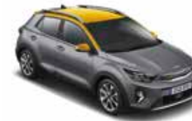
MPR (Perennial Grey / Most Yellow)