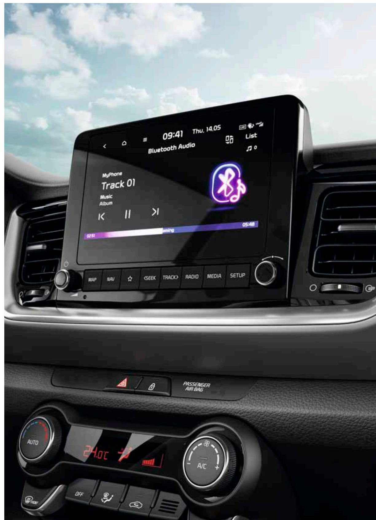
Navegador con pantalla de 20cm (8"). El elegante Sistema de infoentretenimiento, cuenta con una pantalla multimedia de alta definición de 20 cm (8") con cámara trasera (según versiones).