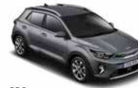
PRG (Perennial Grey)