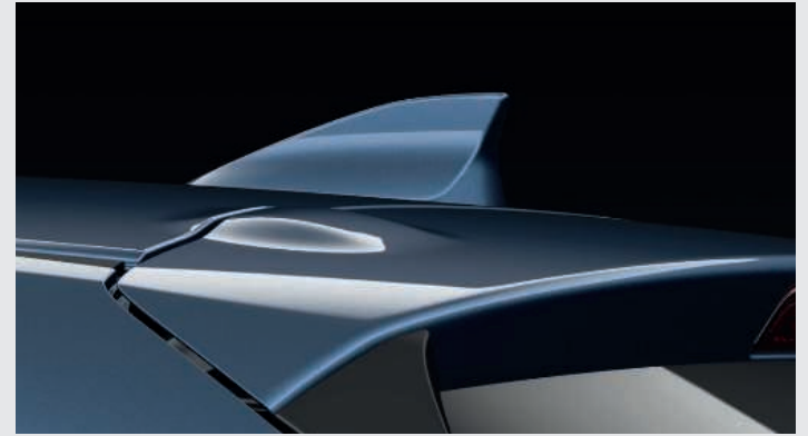
ANTENA DE ALETA DE TIBURÓN

Un coche compacto diseñado para grandes cosas. Una expresión perfecta del galardonado diseño KODO - Alma del Movimiento -, el nuevo Mazda2 Black Tech Edition tiene un porte sólido, líneas musculosas y una apariencia dinámica que te invita a entrar y disfrutar de una experiencia de conducción inigualable. Hasta el más mínimo detalle está cuidadosamente elaborado, tanto el interior como el exterior son una expresión de puro confort. Hay una razón por la cual el diseño estalla con energía, carácter y vitalidad. Es el extraordinario rendimiento de la tecnología SKYACTIV de última generación que proporciona unos excelentes consumos y una gran capacidad de respuesta sin comprometer esa unión perfecta entre coche y conductor que llamamos Jinba Ittai.