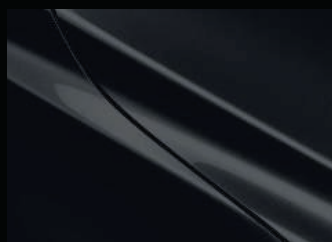
Jet Black Mica