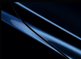
Deep Crystal Blue