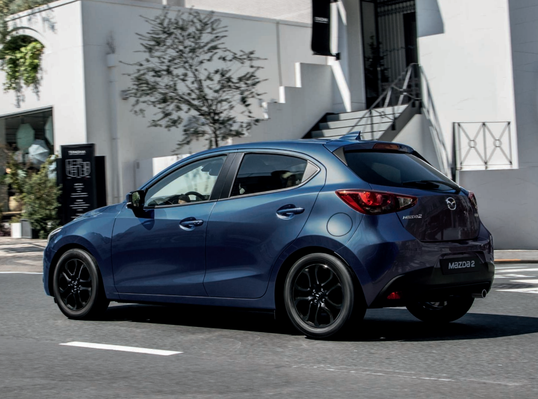
MAZDA 2 en Eternal Blue