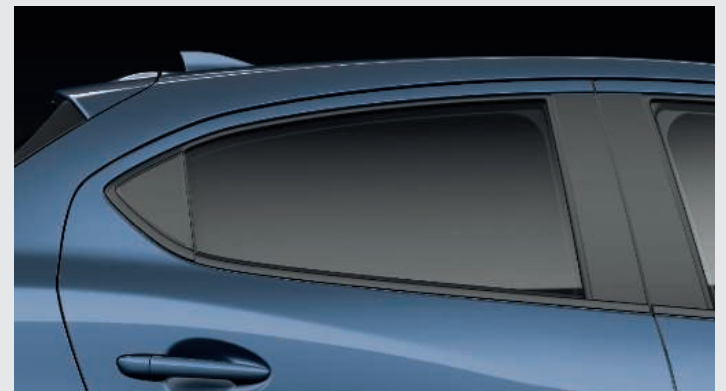
CRISTALES CON TRATAMIENTO DE PRIVACIDAD