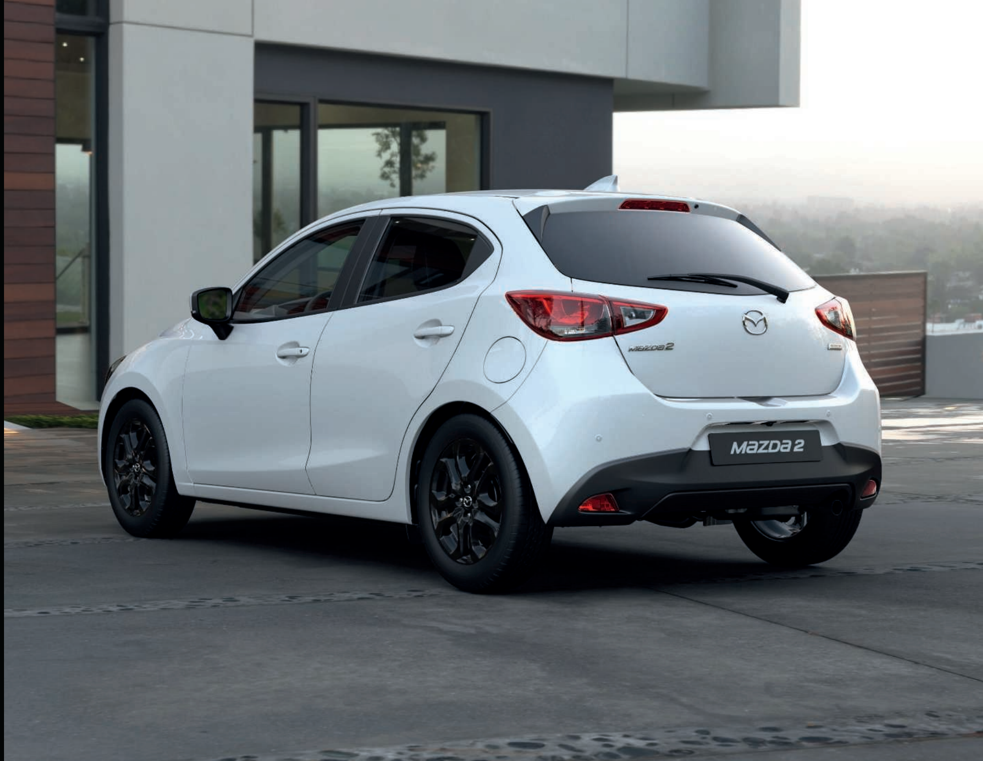
MAZDA 2 en Snowflake White Pearlescent