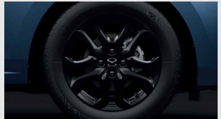
LLANTAS DE ALEACIÓN DE 16" BLACK METAL