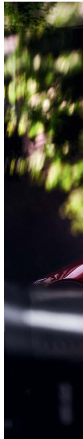
La imagen muestra un Mazda CX-3 en Soul Red Crystal