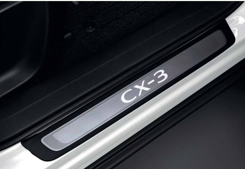
Umbrales de puerta iluminados

Hemos diseñado toda una serie de accesorios que complementan a tu Mazda CX-3 2021. Para ver toda la lista de accesorios originales Mazda para tu Mazda CX-3 2021, visita https://www.mazda.es/configurador/