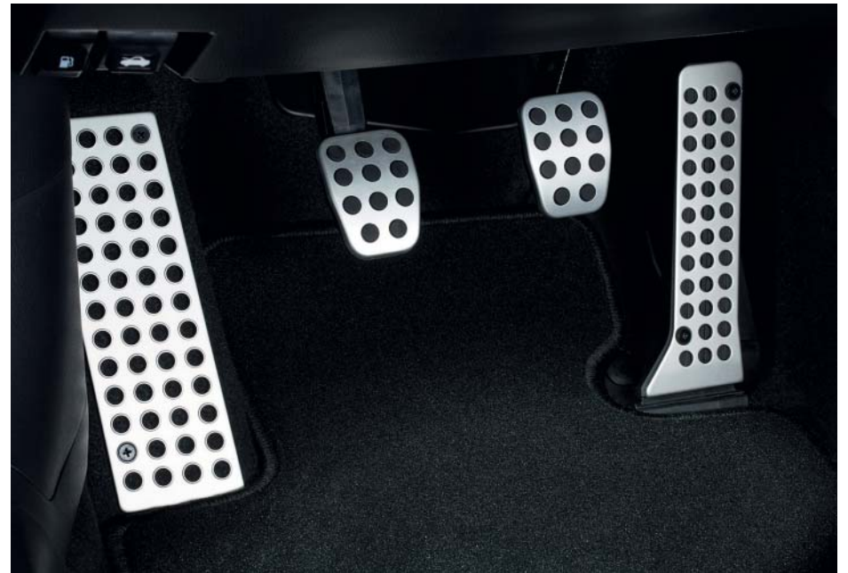
Juego de pedales de aluminio