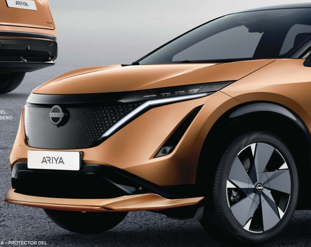
A - PROTECTOR DEL PARACHOQUES DELANTERO