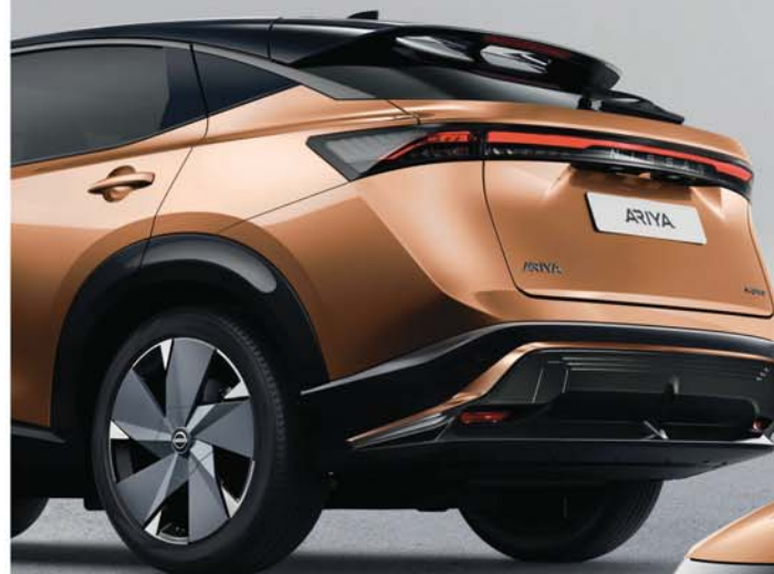
B - PROTECTOR DEL PARACHOQUES TRASERO