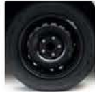
Llanta de acero de 15"