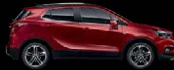
Rojo Corinto 6