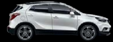
Blanco Alpino 8