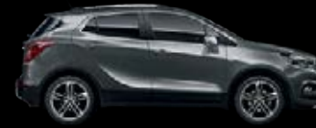
Gris Acero 7