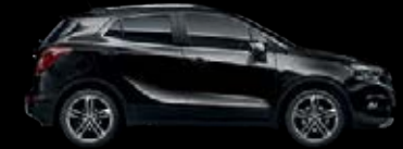
Negro Mineral 7