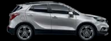
Plata Blade 7