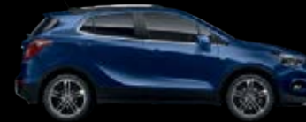
Azul Océano 8