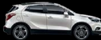
Blanco Nácar 6