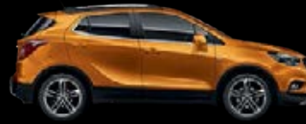
Naranja Ámbar 6

Configura tu MOKKA X al detalle en www.opel.es .