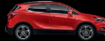
Rojo Rubí 8