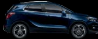
Azul Constelación 7