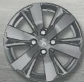
Llanta de aluminio de 16" HYDRE - Gris Dilium brillante