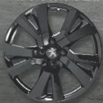
Llanta de aluminio de 17" ERIDAN - Full Black**