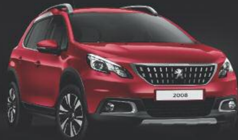
Allure Rojo Ultimate.

(1) Cuero y otros materiales. Para más detalles sobre el cuero, consultar las características técnicas disponibles en el punto de venta o en el sitio de Internet www.peugeot.es .