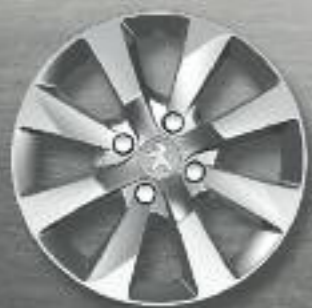
Embelecedor plancha 15" IODE