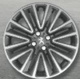
Embelecedor plancha 16" SILICE