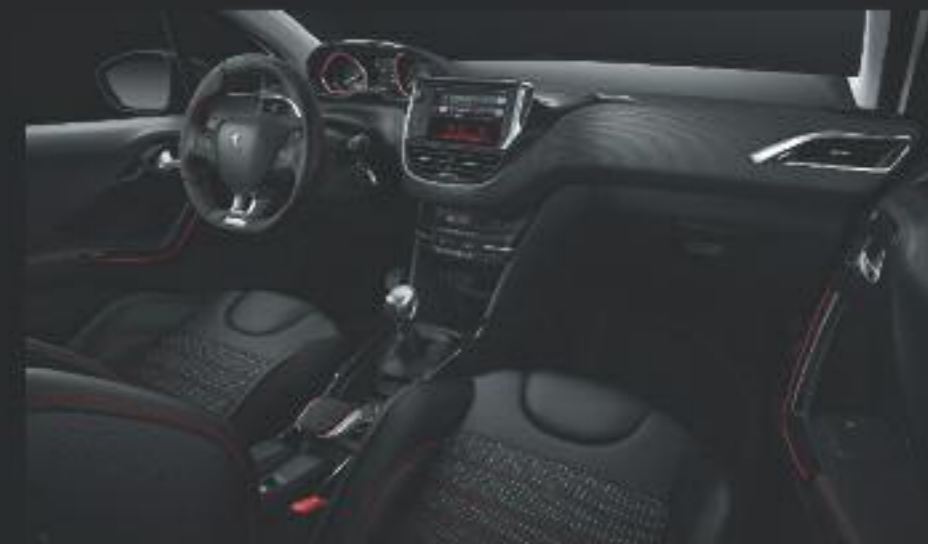
Tapicería específica GT Line.