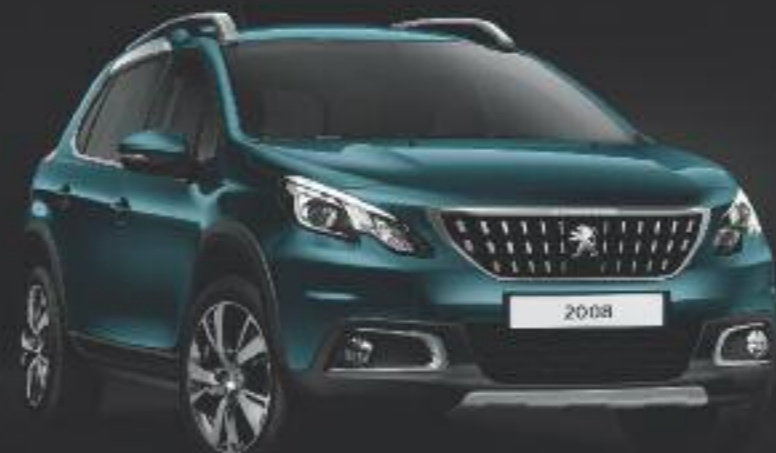
Allure Emerald Crystal / Llantas de aluminio de 17" ERIDAN Gris Anthra diamante brillante.