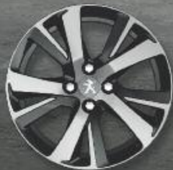
Llanta de aluminio de 17" ERIDAN - Negro diamante brillante