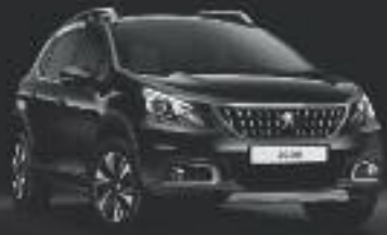
Negro Perla Nera