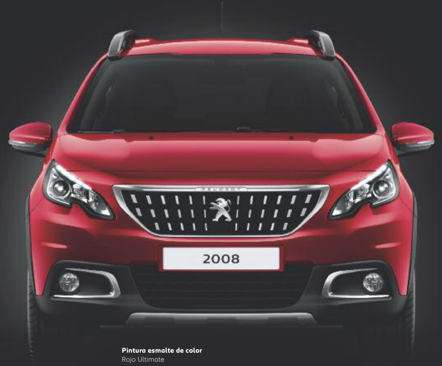
Pintura esmalte de color Rojo Ultimate

* Colores disponibles según versiones/tapicerías.