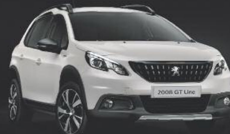
GT Line Blanco Nacarado / Llantas de aluminio de 17" ERIDAN Negro diamante brillante.