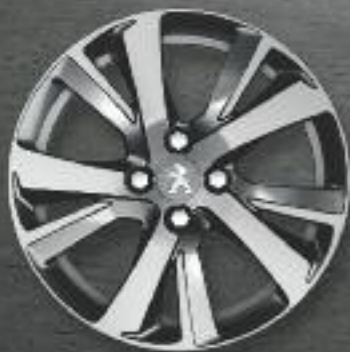
Llanta de aluminio de 17" ERIDAN - Gris Anthra diamante brillante