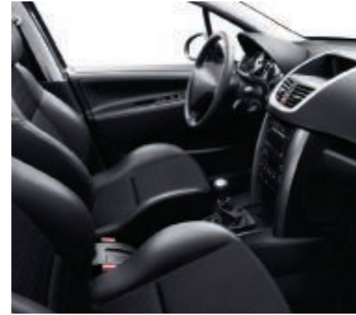
Malla Melilla Negro