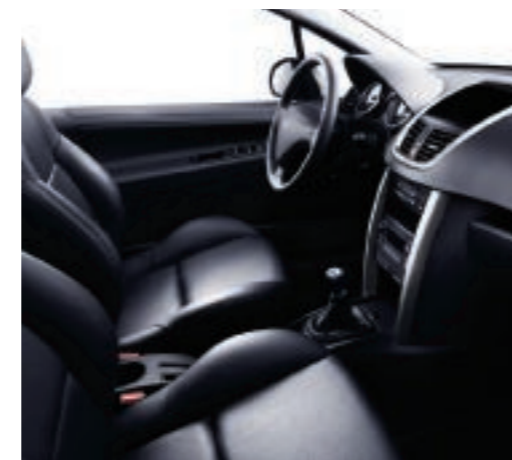
Opción cuero perforado negro Mistral Acompañamiento cuero negro