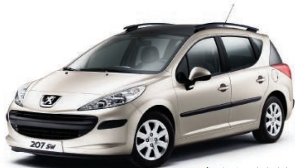
Barra de techo y techo de cristal panorámico opcionales