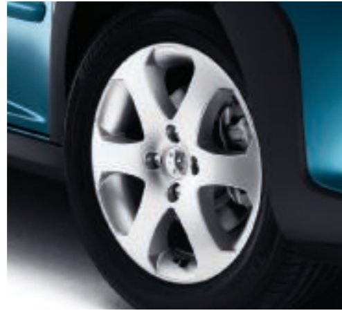
Llanta Outdoor 16" (no encadenable)