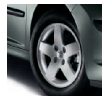
Llanta de Aluminio Monaco 15"