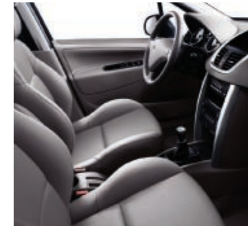
Opción cuero perforado crudo Acompañamiento cuero crudo