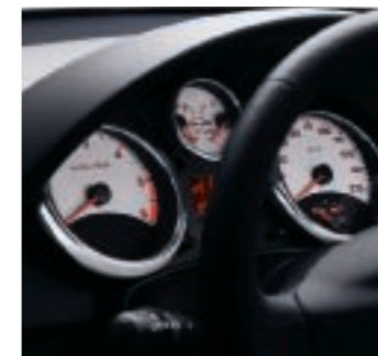
Cuadro de indicadores Sport de 5 esferas blancas