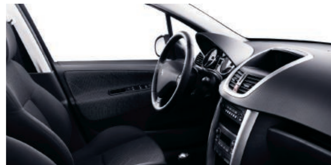
Malla Zindal Negro/Metal