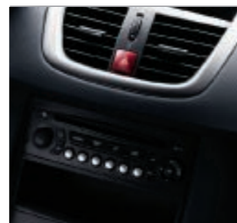
Decoración Gris Lion