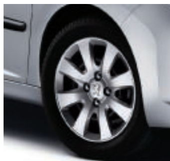
Embellecedor Hobart 15"