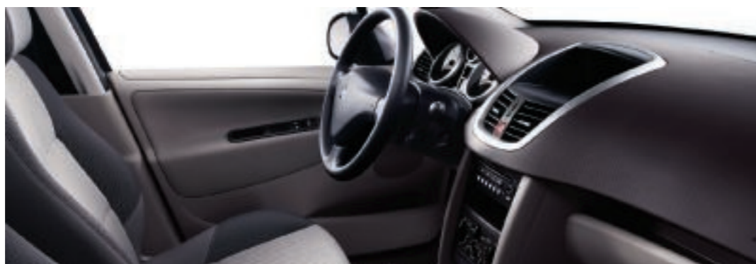
Malla Pachinko crudo