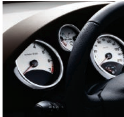
Cuadro de indicadores 5 esferas blancas y arqueado cromado