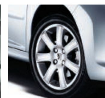
Llanta de aluminio Spa 16"