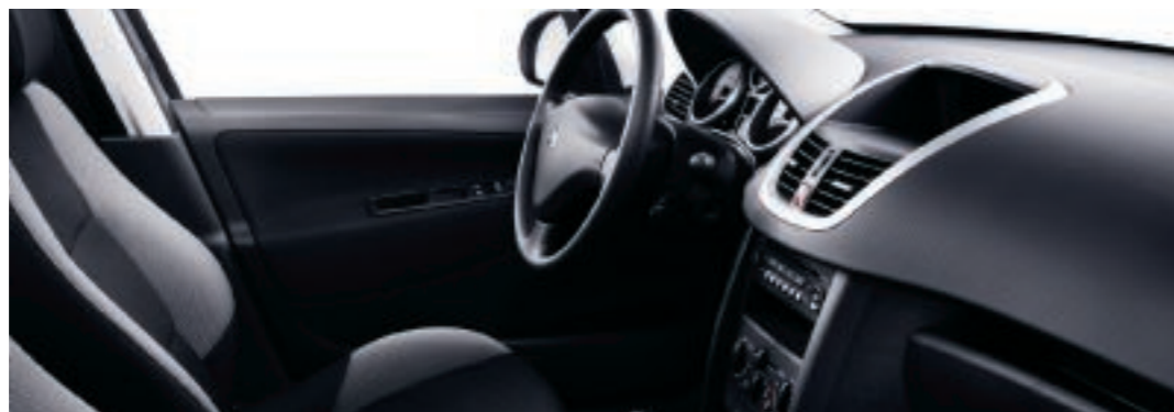
Malla Pachinko negro