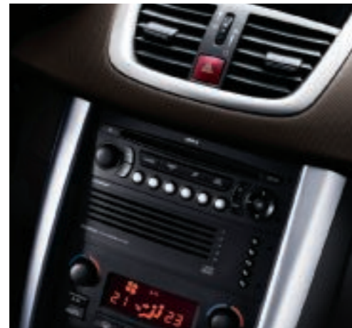
Decorados Grinium chaud