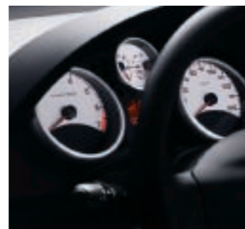
Cuadro de indicadores Confort de 4 esferas blancas