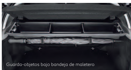
Guarda-objetos bajo bandeja de maletero