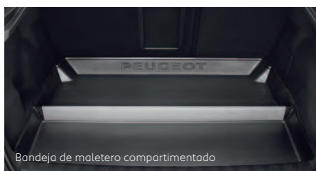
Bandeja de maletero compartimentado