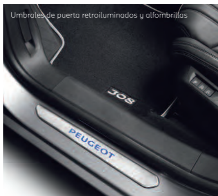
Umbrales de puerta retroiluminados y alfombrillas