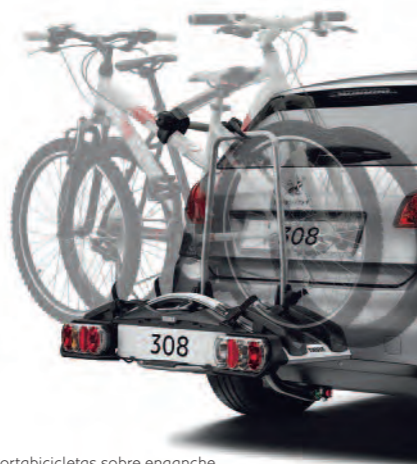
Portabicicletas sobre enganche