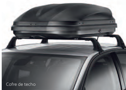
Cofre de techo