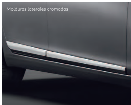
Molduras laterales cromadas