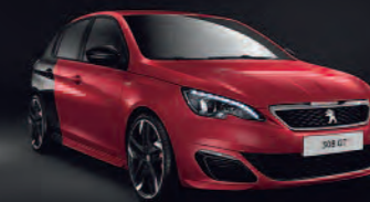
Rojo Ultimate / Negro Perla Nera

** Solo disponible en la versión 270 cv.