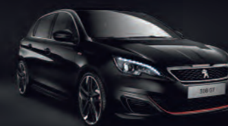
Negro Perla Nera