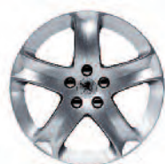
Llanta de aluminio Cosmos 17"