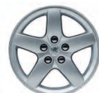
Llanta de aluminio Quasar 16"

*De serie, opcional o no disponible según versiones.