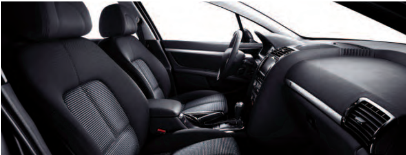
Trenzado Andorra Azulado