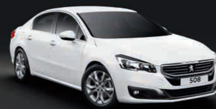
PINTURA opaca - Blanco Banquise