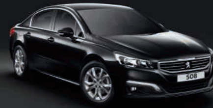
Negro Perla Nera