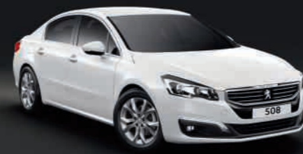
PINTURA nacarada- Blanco Nacarado