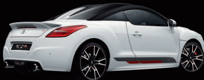
Adhesivo lateral MyRCZ B

El RCZ R propone también una personalización compuesta por un techo de carbono brillante o satinado, adhesivos de carrocería y carcasas de los espejos retrovisores en negro.