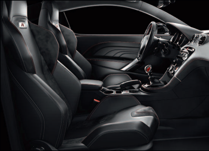
Asientos báquet Semicuero/Alcántara