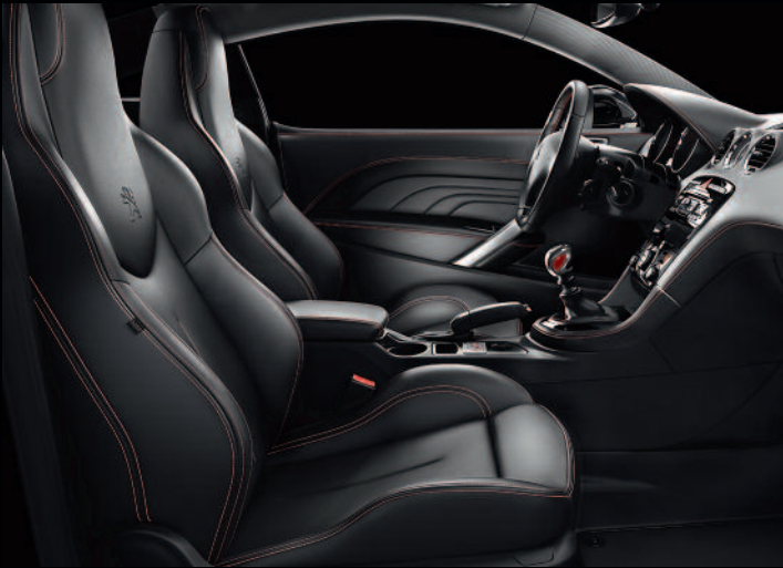
Opción de Paquete Cuero* Napa Mistral con pespunte rojo

*Asientos eléctricos y calefactados de cuero y otros materiales. Consulta las Tarifas y las Características técnicas en el punto de venta o en www.peugeot.es .