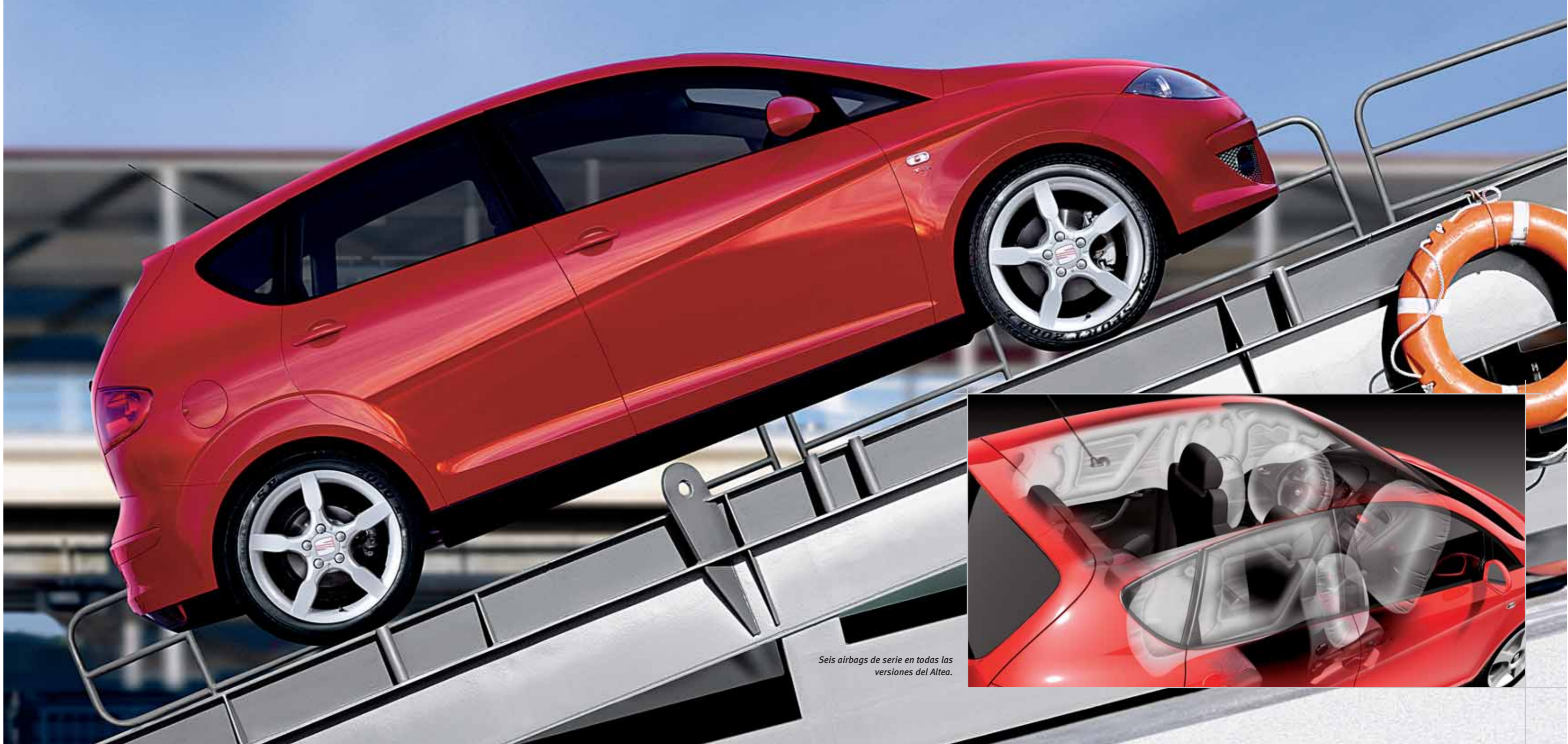
Seis airbags de serie en todas las versiones del Altea.

Siguiendo los principios de SEAT, todos y cada uno de los elementos que componen la Seguridad Pasiva del Altea superan todas las expectativas. Como siempre, en buenas manos.