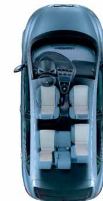
Asientos multiposición para reorganizar el espacio. Permite ampliar el volumen del maletero hasta 510 litros.