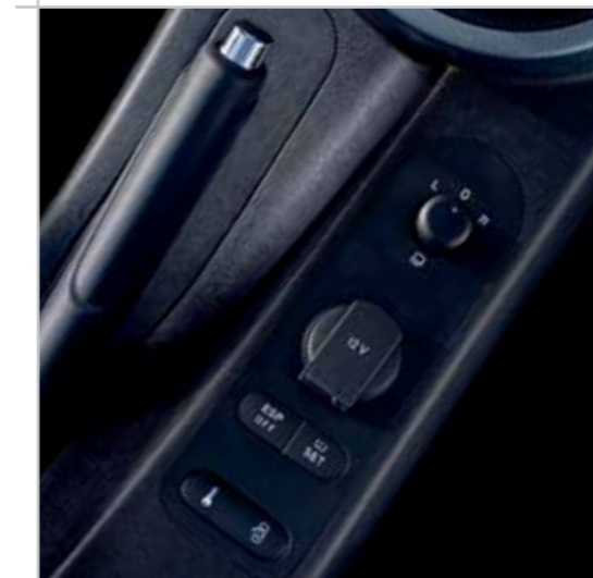
Comodidad al alcance de la mano: ajuste del retrovisor eléctrico, tomas de 12 V, desconexión de los sistemas TCS, ESP, sensor de presión de los neumáticos y cierre centralizado.