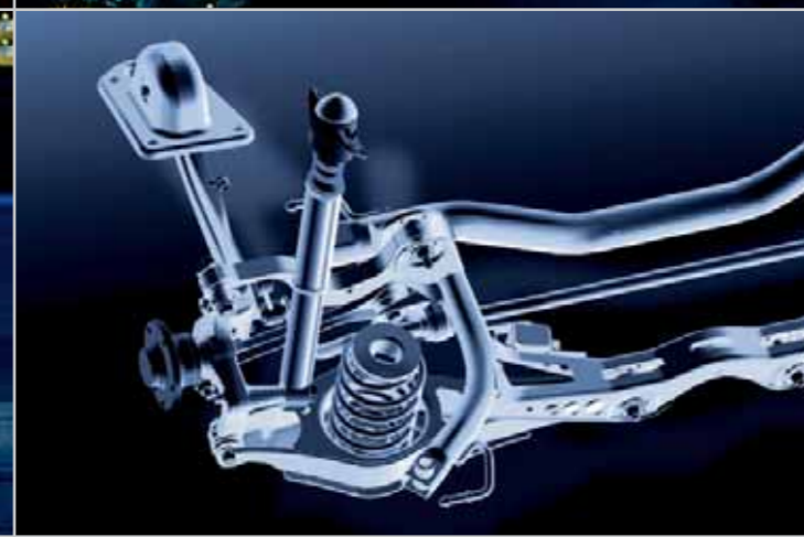
La suspensión trasera independiente multi-link proporciona gran sensación de seguridad y estabilidad en carretera.