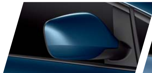
AZUL APOLO I4I4 METALIZADO