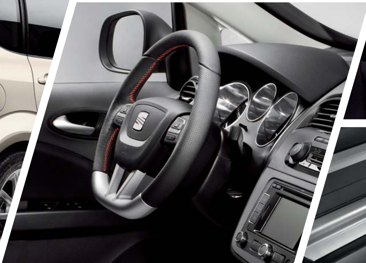
VOLANTE DEPORTIVO EN ALUMINIO. 1P9064241A