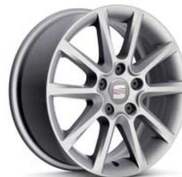
16" ENEA ■■