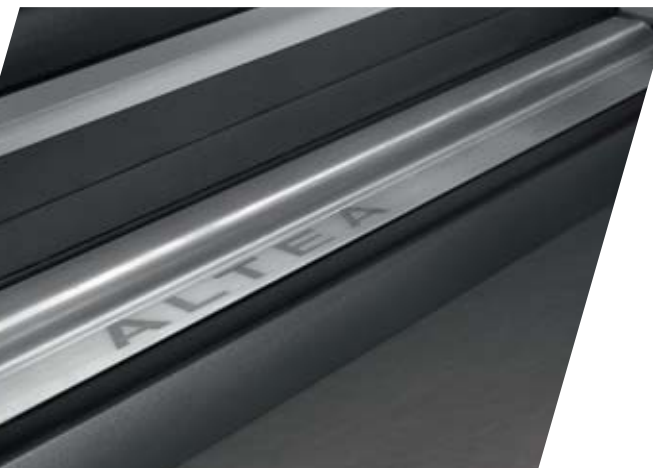
ESTRIBERA CON LOGO ALTEA. 5P1071500