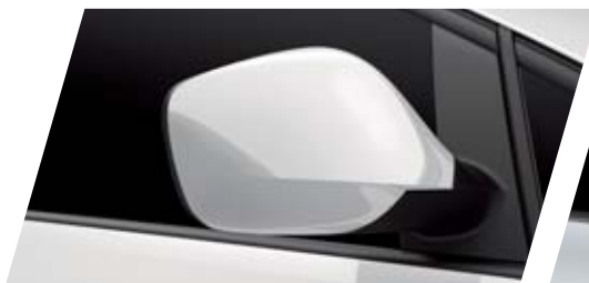
BLANCO B4B4 SUAVE