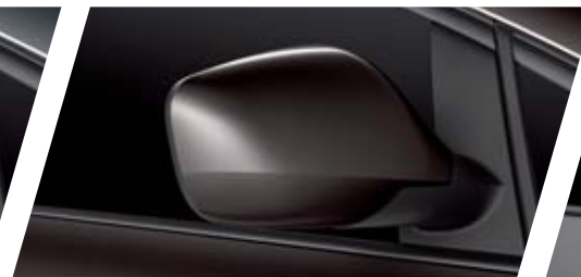
FT GRIS TÉCNICO T4T4 METALIZADO