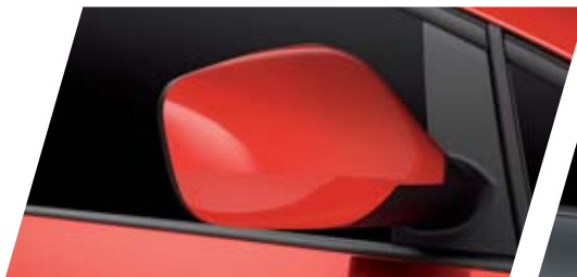
ROJO EMOCIÓN 9M9M SUAVE