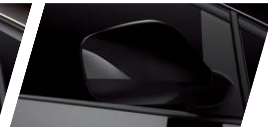
FT NEGRO COSMOS L8L8 METALIZADO