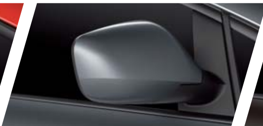
FT GRIS PIRINEOS 0C0C METALIZADO