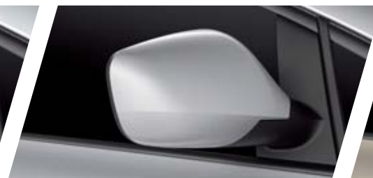
FT PLATA ESTRELLA P5P5 METALIZADO