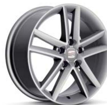
17" ALBEA ■■

I-TECH // Freetrack /FT/ Serie ■■ Opcional ■■