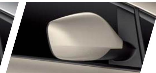
FT BEIGE BALEA L7L7 METALIZADO