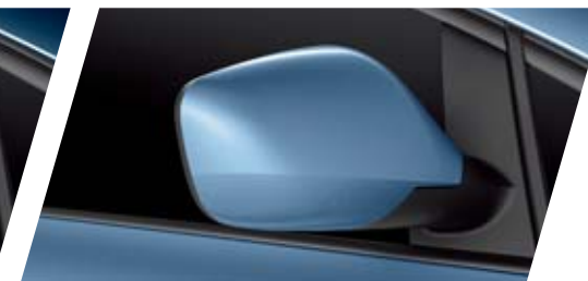
FT AZUL TOSSA R1R1 METALIZADO