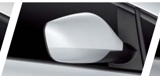
FT BLANCO NEVADA 2Y2Y METALIZADO