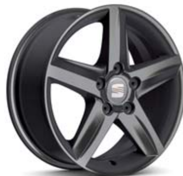
16" ELIO TITANIUM ■■