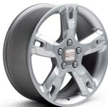
17" CONECTOR ■■