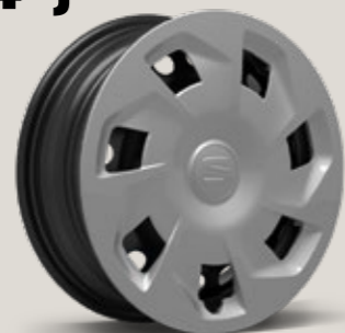
Urban 10/02 M&Y