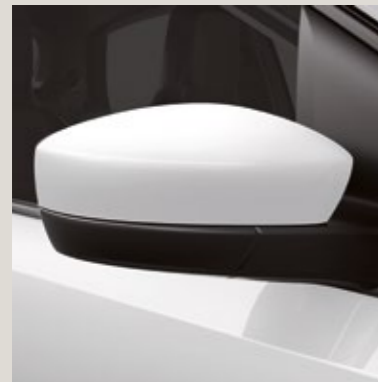
Blanco 1 M&Y