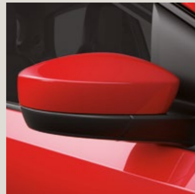
Rojo Tornado 1 M&Y