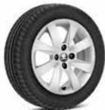
Llantas de aleación blancas de 38 cm (15") Crux