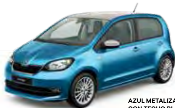
AZUL METALIZADO CRISTALINO CON TECHO BLANCO CANDY