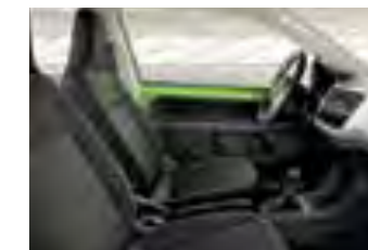
INTERIOR MARFIL STYLE Panel de instrumentos plateado