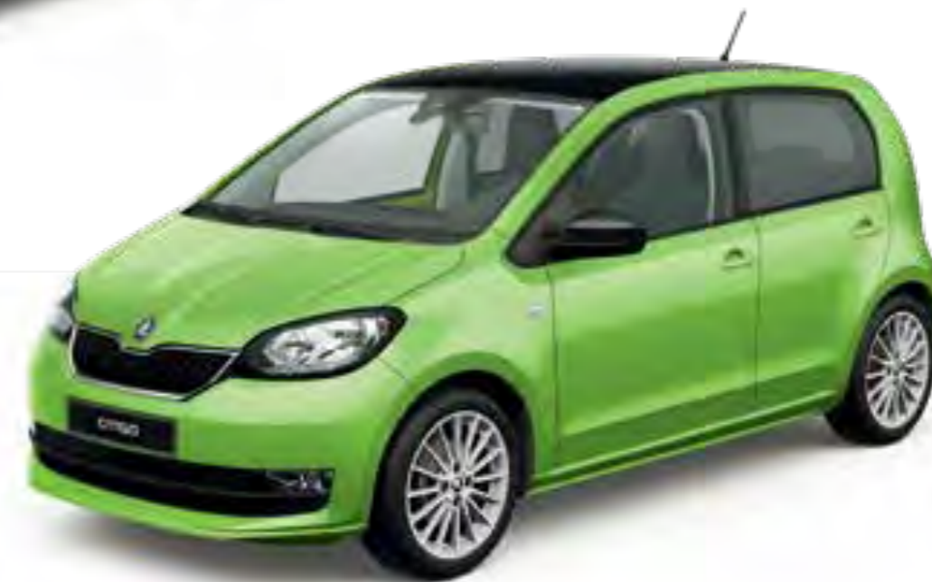
VERDE KIWI UNI CON TECHO NEGRO