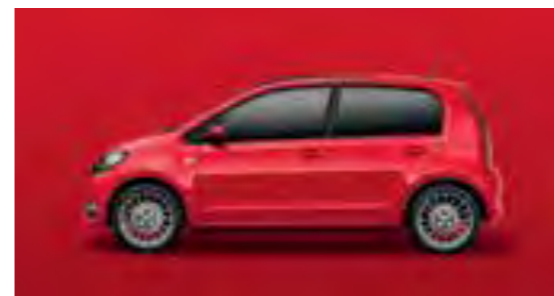
ROJO TORNADO UNI