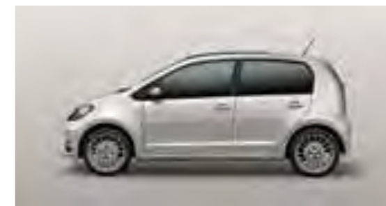
PLATA TUNGSTENO METALIZADO