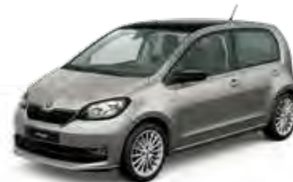
PLATA TUNGSTENO METALIZADO CON TECHO NEGRO