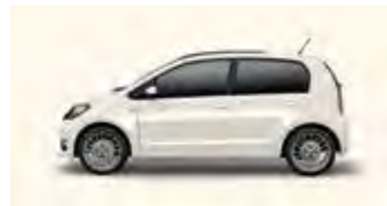
BLANCO CANDY UNI