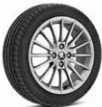
Llantas de aleación plateadas de 41 cm (16") Serpens