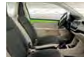
INTERIOR MARFIL STYLE Panel de instrumentos negro satinado y marfil