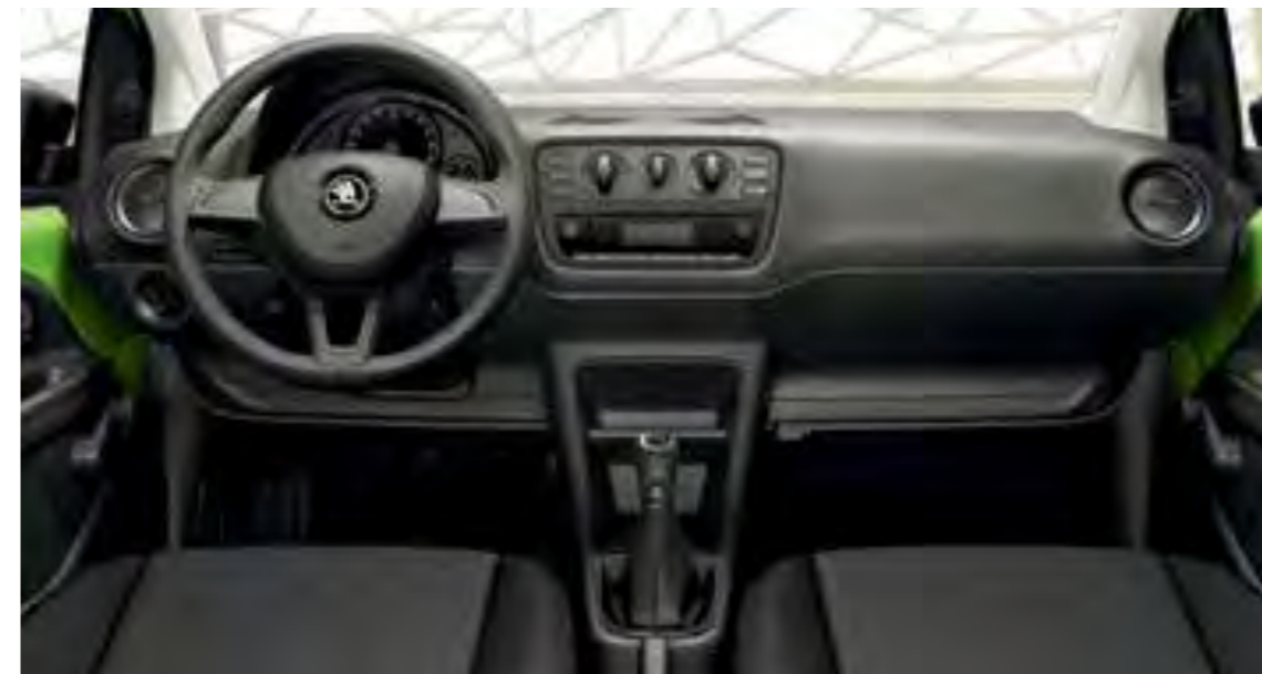
INTERIOR NEGRO ACTIVE Panel de instrumentos negro

El equipamiento de serie de la versión Active incluye retrovisores exteriores y manillas de puerta de color negro, marco de parrilla cromo, volante ajustable, cuatro ganchos en el maletero, etc.