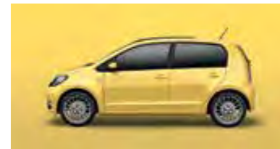
AMARILLO GIRASOL UNI