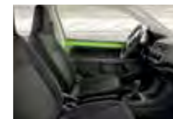
INTERIOR MARFIL STYLE Panel de instrumentos negro