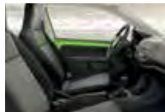
INTERIOR NEGRO AMBITION Panel de instrumentos negro