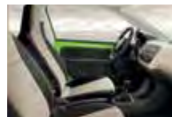
INTERIOR NEGRO AMBITION Panel de instrumentos negro y marfil