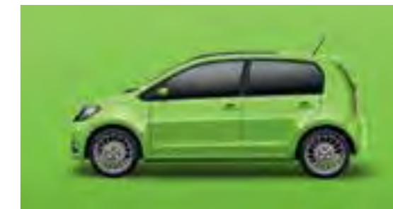
VERDE KIWI UNI