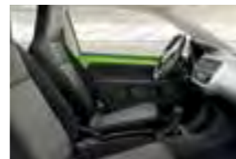
INTERIOR NEGRO AMBITION Panel de instrumentos negro y plateado