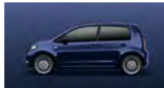
ZAFIRO OSCURO METALIZADO