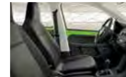
INTERIOR NEGRO ACTIVE Panel de instrumentos negro