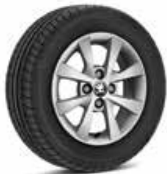
Llantas de aleación plateadas de 36 cm (14") Apus