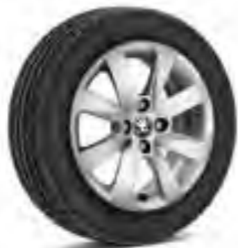
Llantas de aleación plateadas de 38 cm (15") Crux