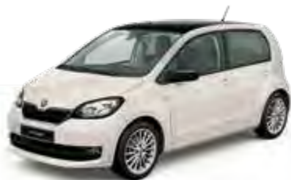
BLANCO CANDY UNI CON TECHO NEGRO

Personaliza el CITIGO con tus colores favoritos utilizando ColourConcept. Este sistema te permitirá combinar distintos colores de carrocería, crear un contraste con él y las tapas de los retrovisores exteriores en negro o blanco.