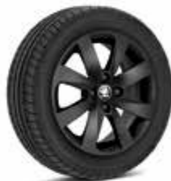
Llantas de aleación negras de 38 cm (15") Crux