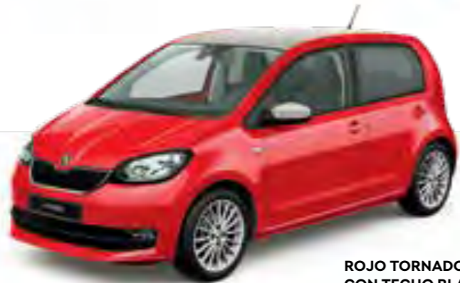
ROJO TORNADO UNI CON TECHO BLANCO CANDY