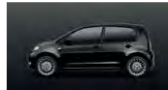
NEGRO INTENSO METALIZADO