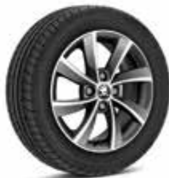
Llantas de aleación antracita de 38 cm (15") Conan