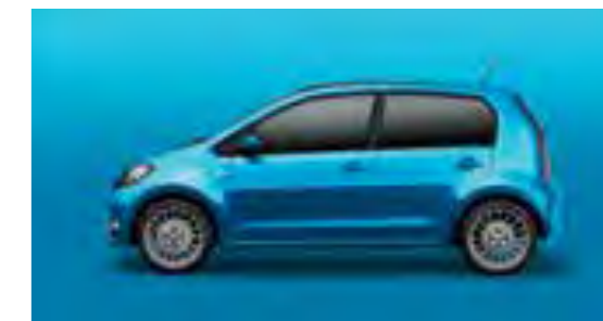
AZUL CRISTALINO METALIZADO