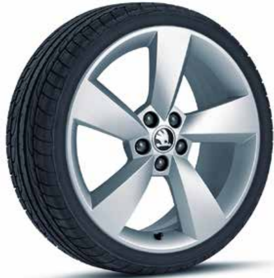
Llantas de aleación Prestige de 43 cm (17")