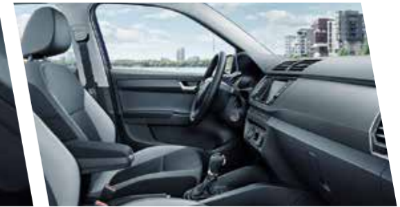
Interior Ambition en gris, con molduras en gris oscuro.