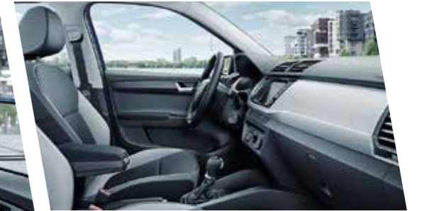
Interior Ambition en gris, con molduras en look aluminio cepillado claro.