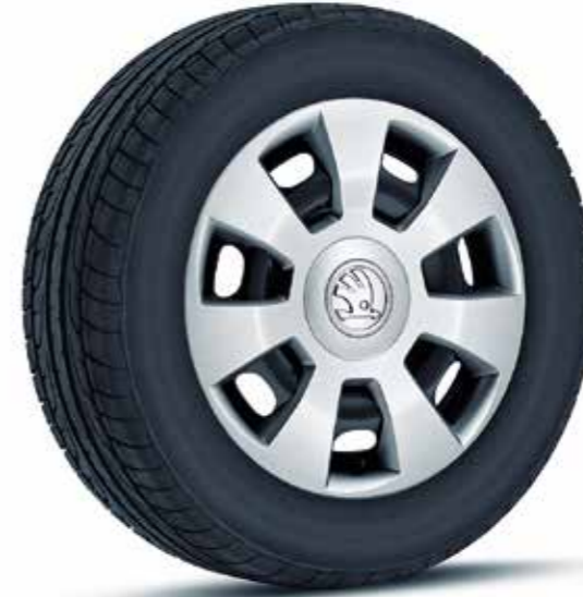
Llantas de acero de 36 cm (14") con embellecedores Flair