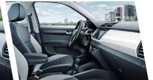
Interior Ambition en azul con molduras en blanco piano.