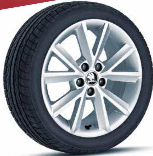
Llantas de aleación Beam plateadas de 41 cm (16")