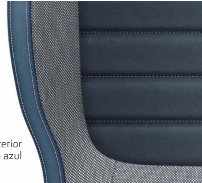
Interior Style en azul