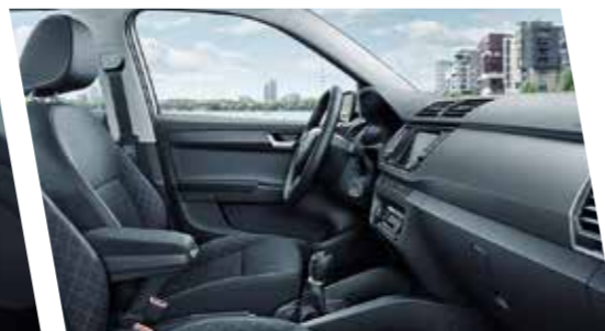
Interior Style en negro con molduras en gris oscuro.

La versión Style también incluye elementos decorativos cromados. Puedes elegir entre diferentes tapicerías para los asientos y varias combinaciones de color. El equipamiento de serie incluye llantas de aleación de 38 cm (15"), Easy Start, aire acondicionado, radio táctil Swing, bluetooth, luz diurna LED, asientos del conductor y del acompañante ajustables en altura.