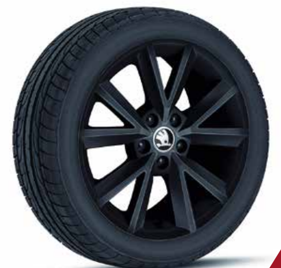
Llantas de aleación Beam negras de 41 cm (16")