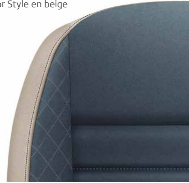
Interior Style en beige