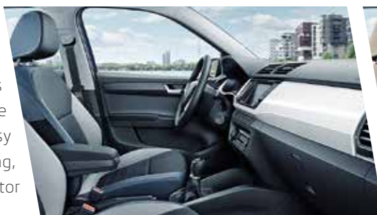
Interior Style en azul con molduras en blanco piano.

La versión Style también incluye elementos decorativos cromados. Puedes elegir entre diferentes tapicerías para los asientos y varias combinaciones de color. El equipamiento de serie incluye llantas de aleación de 38 cm (15"), Easy Start, aire acondicionado, radio táctil Swing, bluetooth, luz diurna LED, asientos del conductor y del acompañante ajustables en altura.