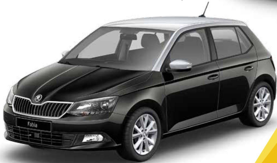
Plateado con ColourConcept