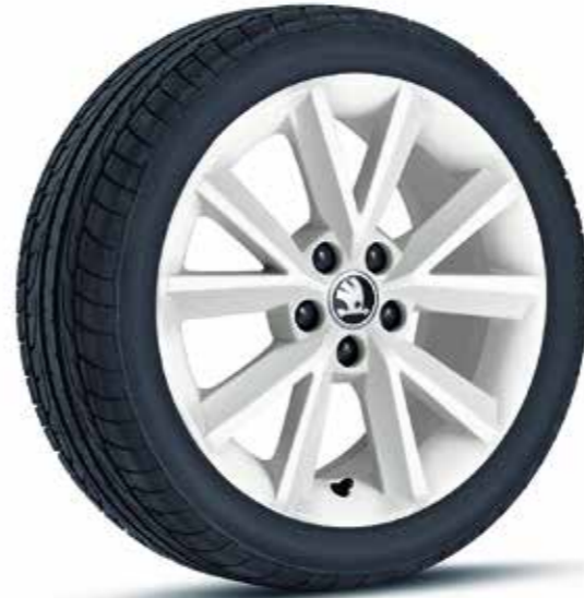
Llantas de aleación Beam blancas de 41 cm (16")