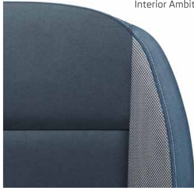
Interior Ambition en azul