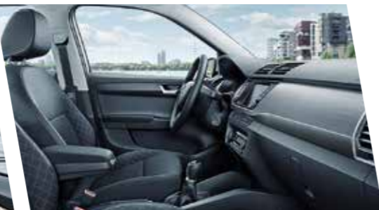
Interior Style en negro con molduras en look aluminio cepillado oscuro.