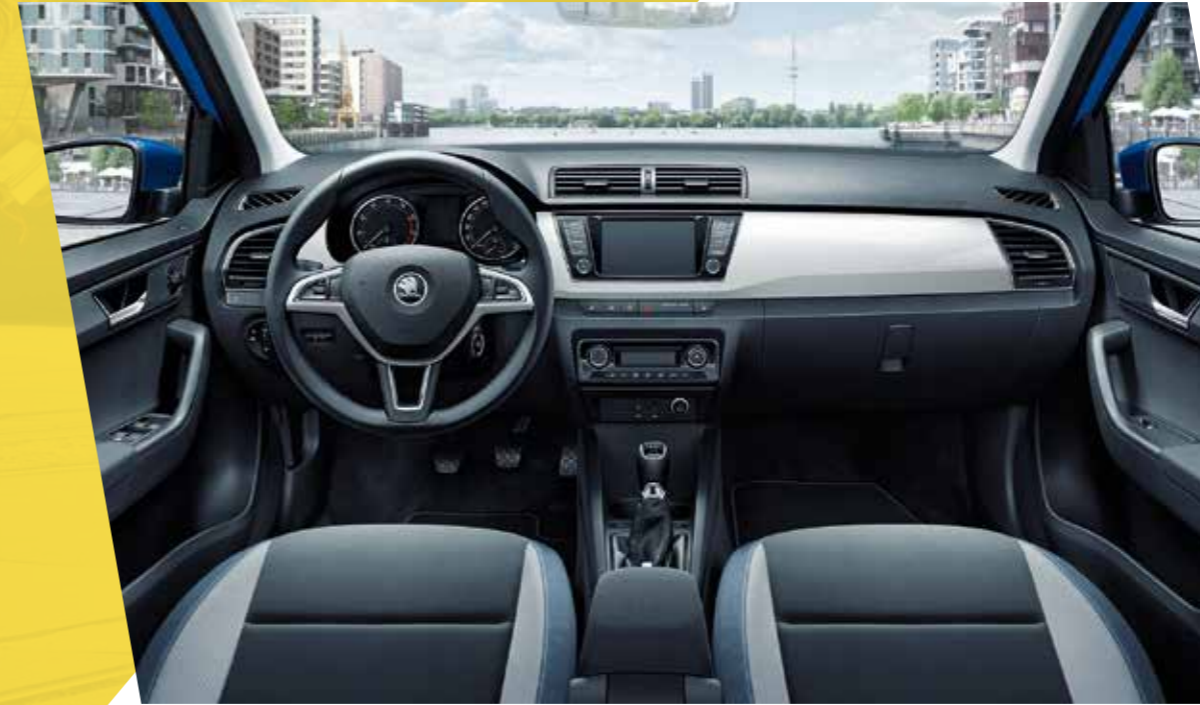
Interior Ambition en azul, con molduras en blanco piano.

La versión de interior Ambition incluye elementos decorativos cromados, como las manetas, los marcos de las ranuras de ventilación del aire, los marcos del panel de instrumentos. Puedes elegir entre diferentes tapicerías para los asientos y varias combinaciones de color. El equipamiento de serie incluye Radio táctil Swing con bluetooth, asiento ajustable en altura para el conductor, volante de cuero multifunción para radio y teléfono, Front Assist y seis airbags.