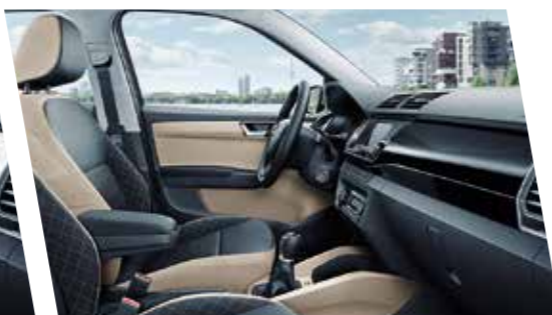
Interior Style en beige con molduras en negro piano.