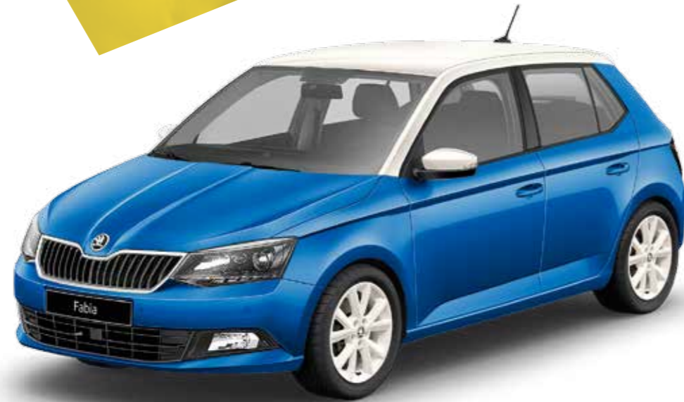
Blanco con ColourConcept