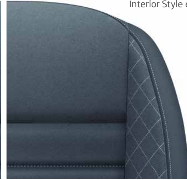
Interior Style en negro