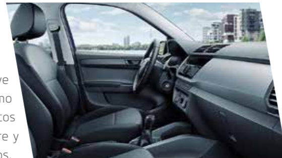
Interior Active en negro, con molduras en gris.

La versión de interior Active incluye elementos decorativos en negro, como las manetas de las puertas, los marcos de las ranuras de ventilación del aire y los marcos del panel de instrumentos.