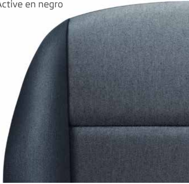
Interior Active en negro