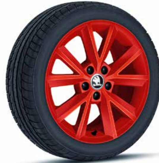
Llantas de aleación Beam rojas de 41 cm (16")