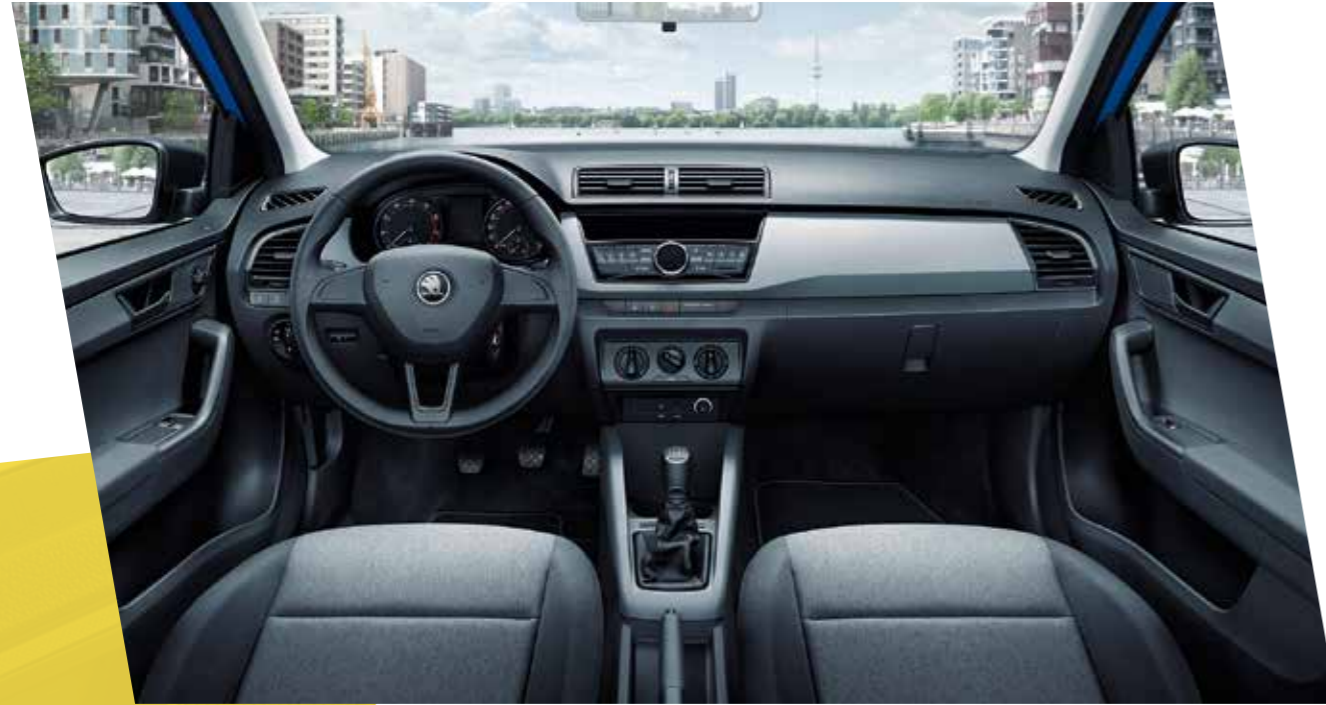
Interior Active en negro, con molduras en gris.

La versión de interior Active incluye elementos decorativos en negro, como las manetas de las puertas, los marcos de las ranuras de ventilación del aire y los marcos del panel de instrumentos.