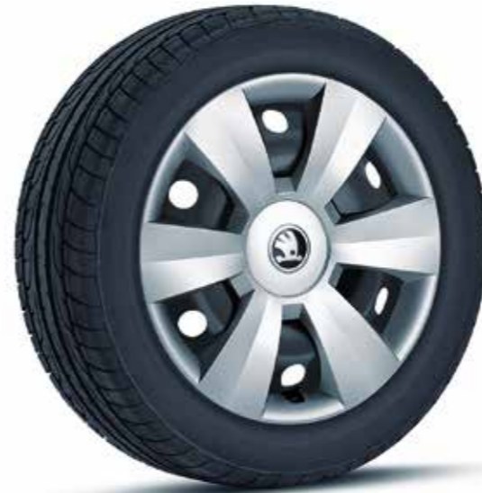
Llantas de acero de 38 cm (15") con embellecedores Dentro