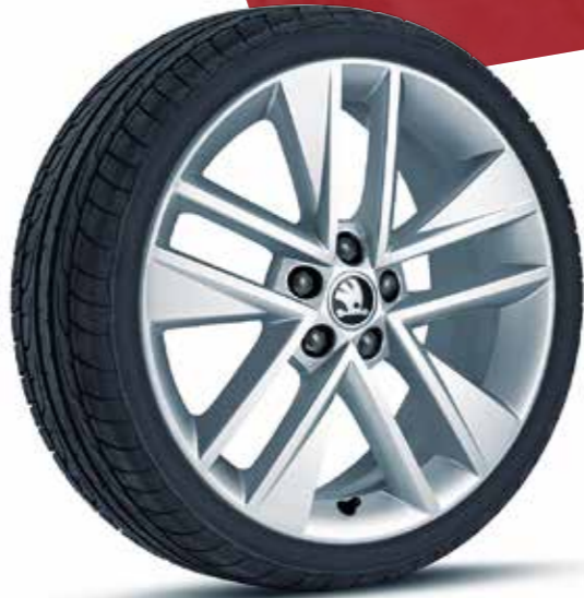
Llantas de aleación Clubber de 43 cm (17")