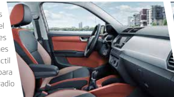
Interior Ambition en rojo con molduras en look aluminio cepillado.

La versión de interior Ambition incluye elementos decorativos cromados, como las manetas, los marcos de las ranuras de ventilación del aire, los marcos del panel de instrumentos. Puedes elegir entre diferentes tapicerías para los asientos y varias combinaciones de color. El equipamiento de serie incluye Radio táctil Swing con bluetooth, asiento ajustable en altura para el conductor, volante de cuero multifunción para radio y teléfono, Front Assist y seis airbags.