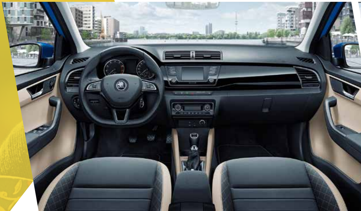
Interior Style en beige con molduras en negro piano.