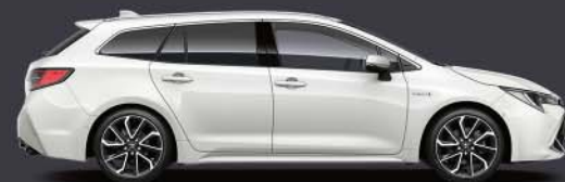
040 Blanco Classic