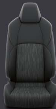
Tapicería mixta jaspeada Estándar en acabado Style