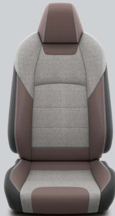
Tapicería de tela gris y marrón con pespunte en gris Estándar en TREK