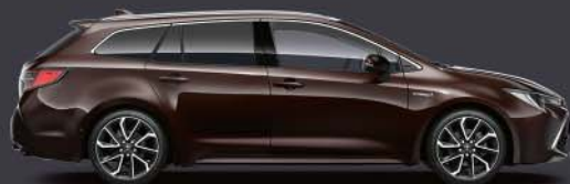
4W9 Marrón Espresso*