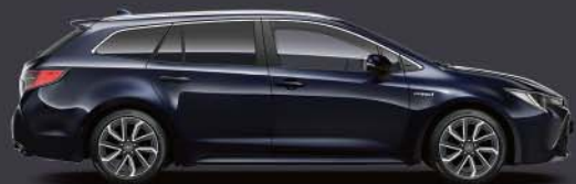
8X8 Azul Orión*