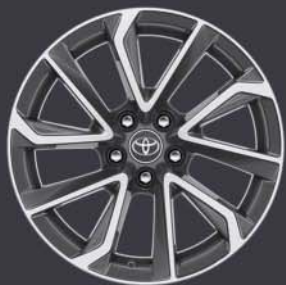
Llantas de aleación 18" bi-tono Estándar en acabado Advance