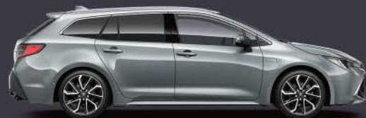
1H5 Gris Manhattan*