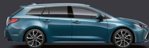
8U6 Azul Denim*