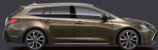
6X1 Bronce Oliva*§