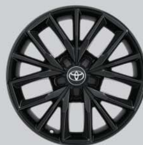
Llantas de aleación 17" negras Opcionales a todos los acabados