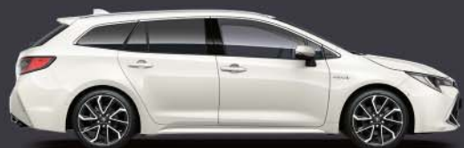
070 Blanco Perlado §