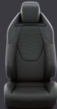
Tapicería tela, cuero y Alcantara® Estándar en acabado Advance