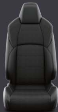
Tapicería tela negra Estándar en acabados Business Plus y Active Tech