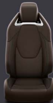
Tapicería cuero marrón Estándar en acabado Advance Luxury Marrón