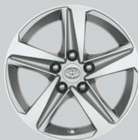
Llantas de aleación 16" 5 radios Opcionales a todos los acabados