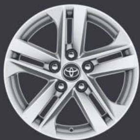
Llantas de aleación 16" Estándar en acabados Business Plus y Active Tech