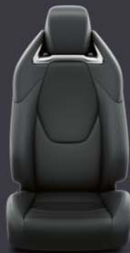
Tapicería cuero negro Estándar en acabado Advance Luxury Negro