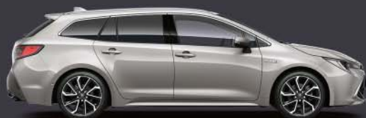
1J6 Plata Polar §