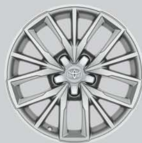
Llantas de aleación 17" Opcionales a todos los acabados