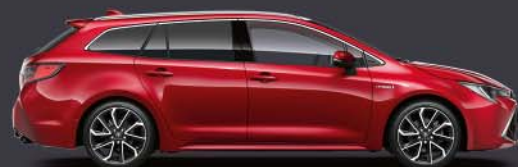
3U5 Rojo Emoción §