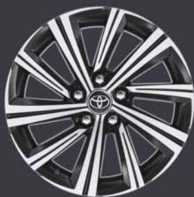
Llantas de aleación de 17" Estándar en acabado Style