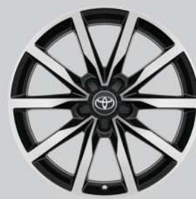
Llantas de aleación 18" Bi-tono Opcionales a todos los acabados