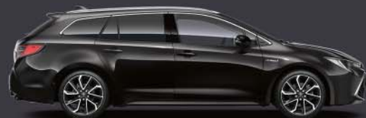
209 Negro Azabache*§