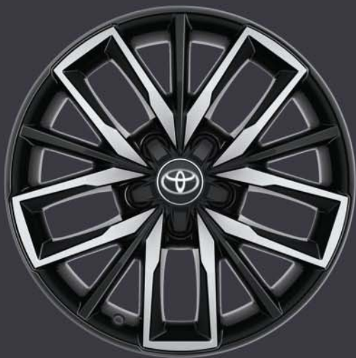
Llantas de aleación de 17" Bi-tono Estándar en TREK