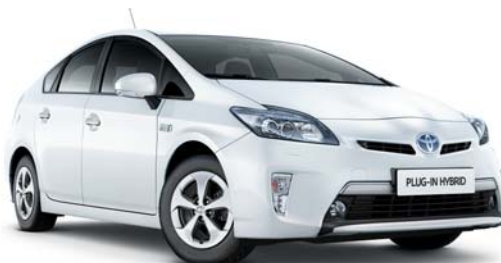
070 Blanco Perlado*