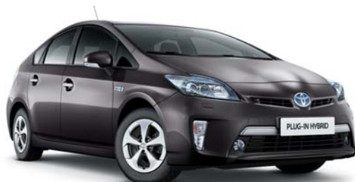
8V1 Gris Pizarra§