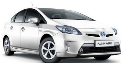
040 Blanco Classic