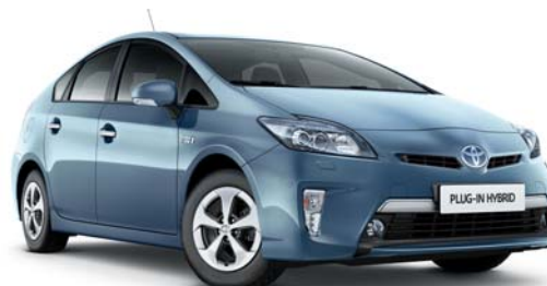
8W1 Azul Ártico§